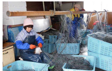
漁港外での網外し・選別作業状況