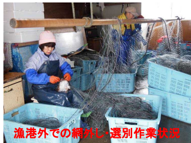
漁港外での網外し・選別作業状況