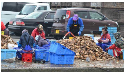
野天での陸揚げ・選別・出荷作業状況