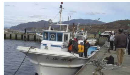
漁船を使用した避難訓練状況(イメージ)