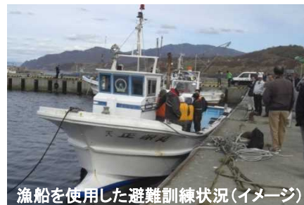
漁船を使用した避難訓練状況(イメージ)