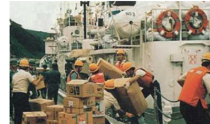
緊急物資輸送状況(イメージ)