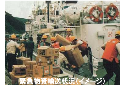
緊急物資輸送状況(イメージ)