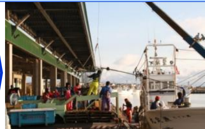
屋根付き岸壁での陸揚げ状況