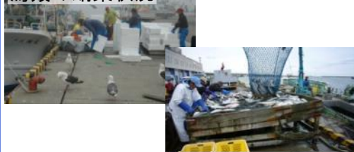
野天での陸揚げ状況