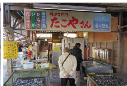
直売コーナー内の天日干し