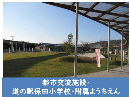
都市交流施設・ 道の駅保田小学校・附属ようちえん