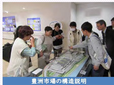
豊洲市場の構造説明