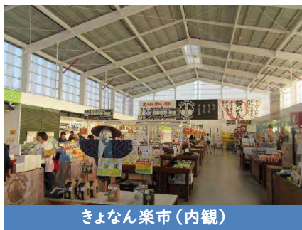
きよなん楽市(内観)