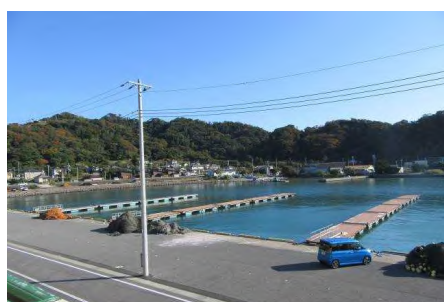
保田漁港 ビジターバース