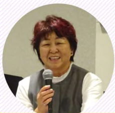
川口委員【サロマ湖】