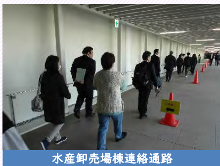
水産卸売場棟連絡通路