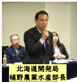
北海道開発局 植野農業水産部長