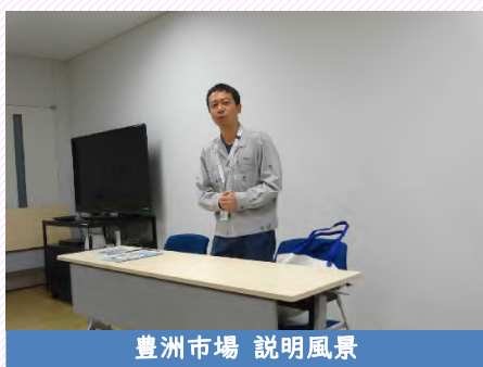
豊洲市場 説明風景