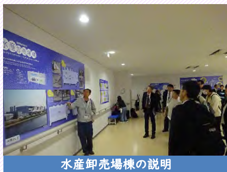
水産卸売場棟の説明