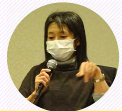
山形委員【根室(落石)】