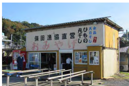
ばんや直売コーナー