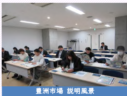
豊洲市場 説明風景