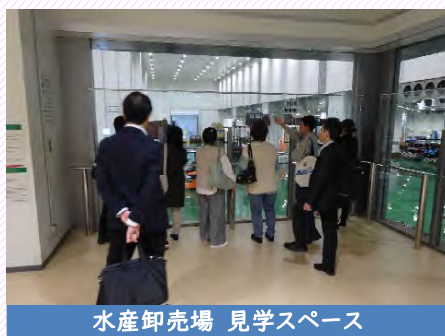
水産卸売場 見学スペース