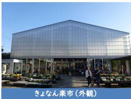
きよなん楽市(外観)

保田漁港の後は、「道の駅保田小学校」へと移動しました。こちらは旧保田小学校をリノベーションして作られた道の駅で、その中の「きよなん楽市」は旧保田小学校の体育館をリノベーションした直売所です。また、小学校に隣接する旧鋸南幼稚園を再利用して「都市交流施設・道の駅保田小付属ようちえん」もオープンしています。委員からは、「廃校は自分の地域にもあるので、参考にしたい」といった声が挙がりました。