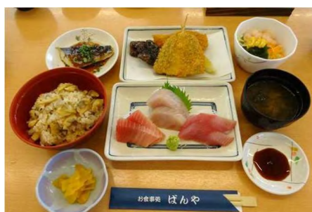
提供している料理