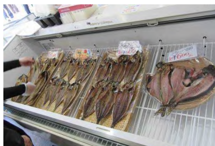
直売コーナー内の干物