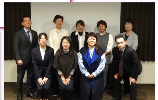
会議終了後に記念撮影