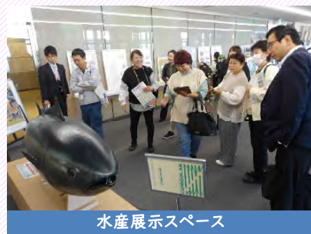
水産展示スペース