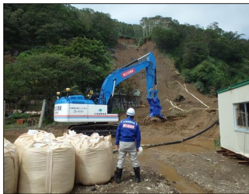
羅臼町崩落現場（H28. 8. 27）

※作業現場での説明については、以下問合せ先（釧路開発建設部防災対策官）までお問合せ願います。