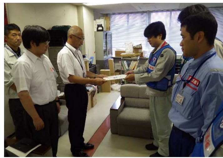
北見市(留辺蘂町)に調査結果を報告(8/30)