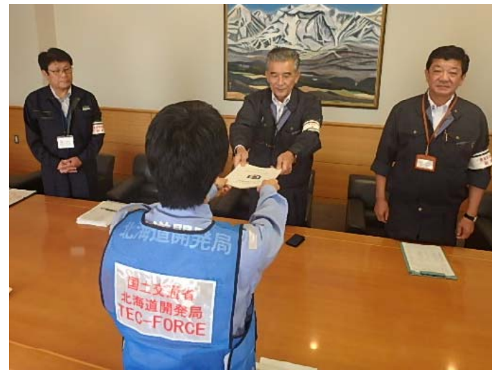
美瑛町長に調査結果を報告(8/29)