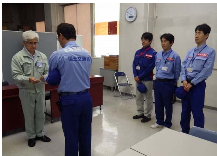
北見市(常呂町)に調査結果を報告(8/29)