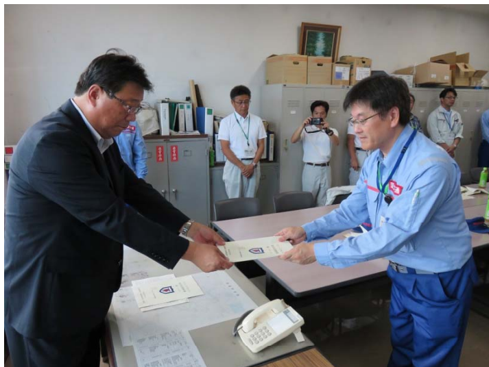
剣淵町長に調査結果を報告(8/29)