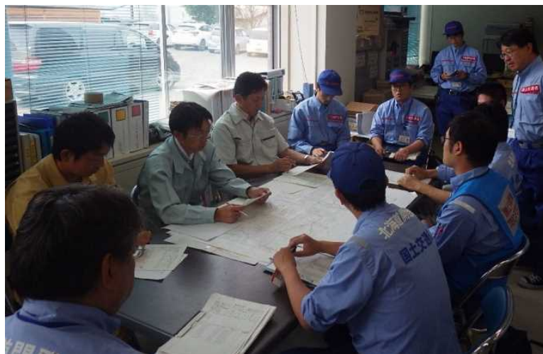
留萌開建河川班 南富良野町職員との打合せ