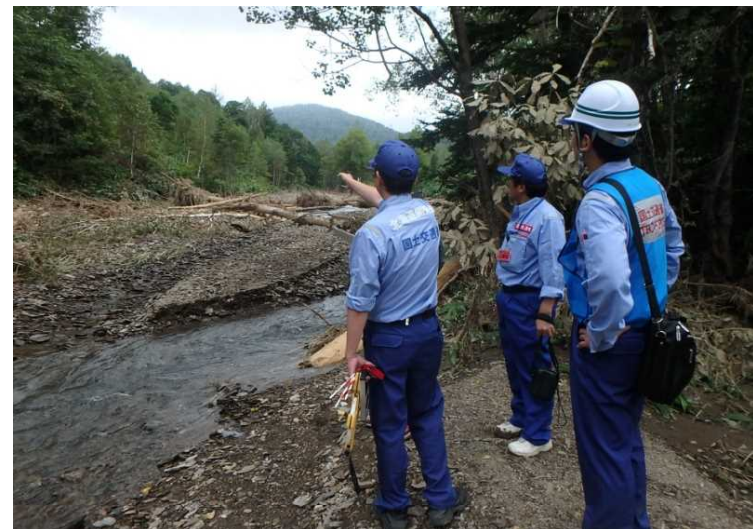
札幌開建道路班 南富良野町 被災状況調査