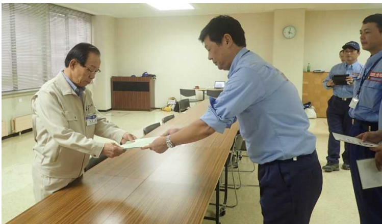
中国・四国地整の隊員が清水町長に調査結果を報告(9/3)