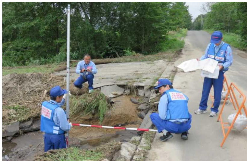
稚内開建道路班 清水町御影地区 被災状況調査