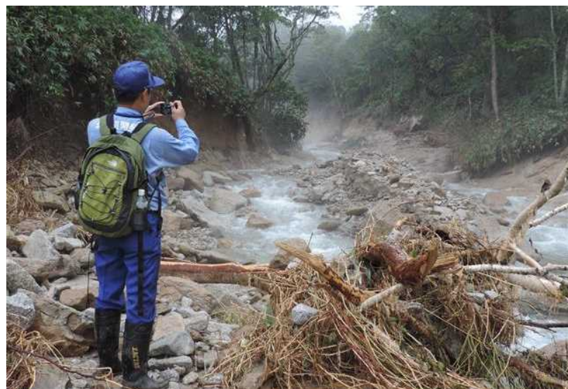
網走開建道路班 清水町 造林沢川土石流発生状況調査