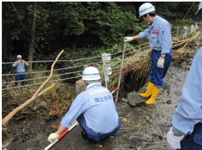
小樽開建道路班 芽室町 町道伏美線 土砂崩落箇所調査