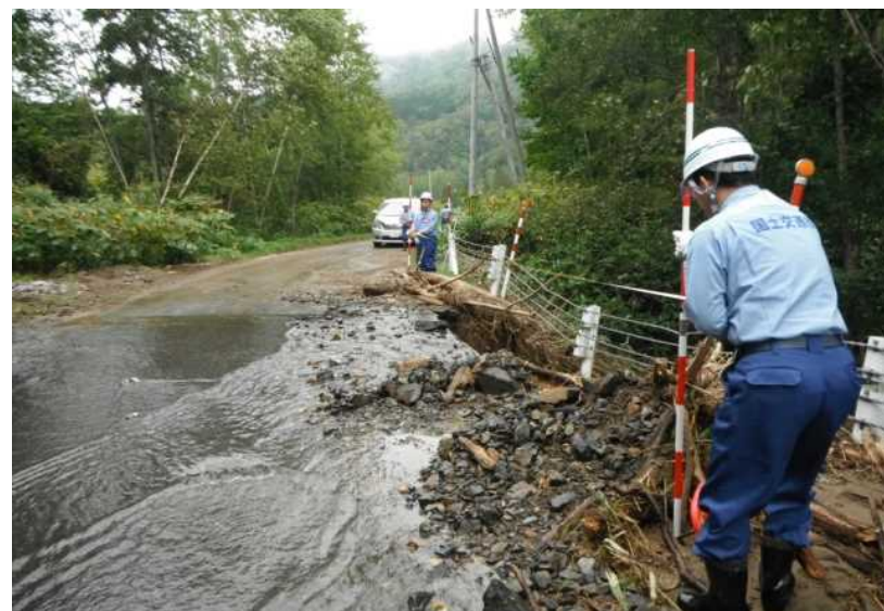
小樽開建道路班 芽室町 町道の路肩決壊箇所調査