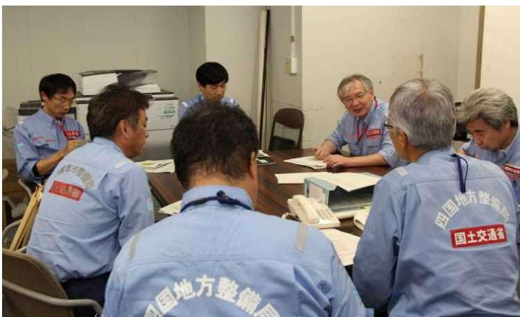
総合指令（北海道開発局：札幌）での班長会議(9/3)