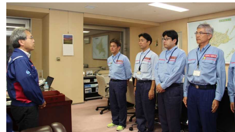
任務を完了し帰還する中国・四国地整隊員に御礼の挨拶(9/3)