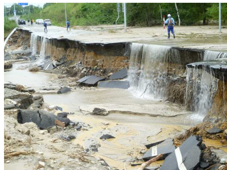
釧路開建河川班 清水町 上小林川被災箇所調査