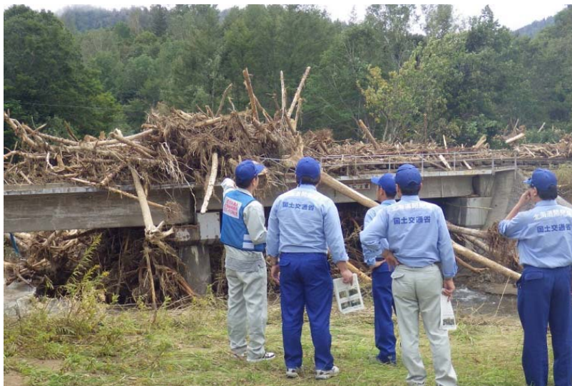
留萌開建河川班 南富良野町 トナム川被災状況調査