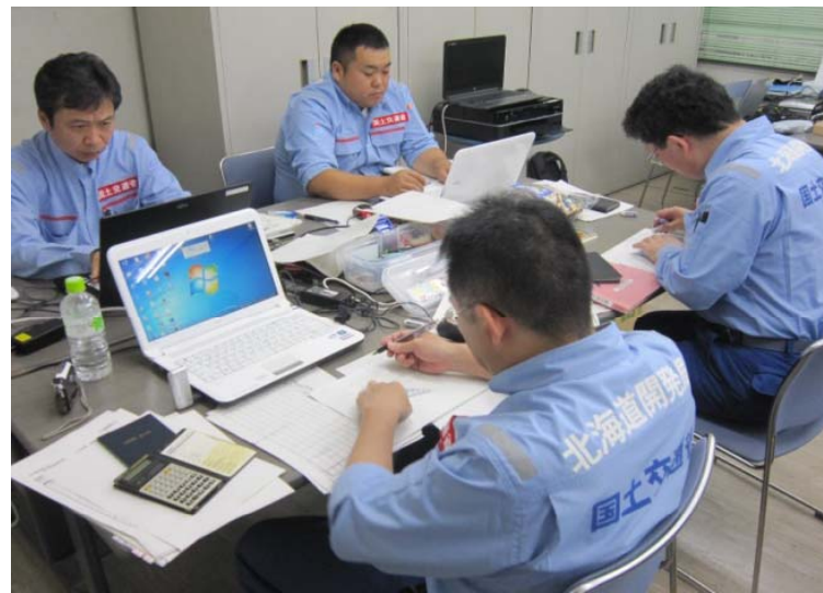
芽室町の調査結果を取りまとめる小樽開建道路班