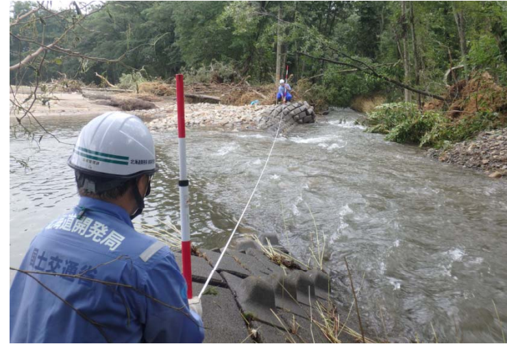
釧路開建河川班 清水町久山川 河岸侵食、護岸崩落箇所調査