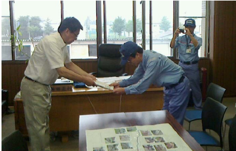
関東地整隊員から新得町長に調査結果を報告