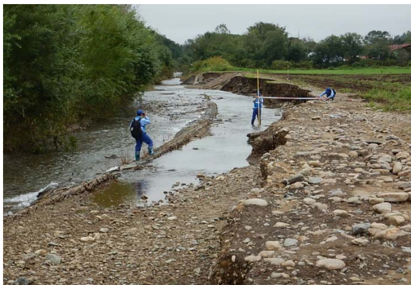
室蘭開建河川班 中札内村元更別 サラベツ川被災状況調査