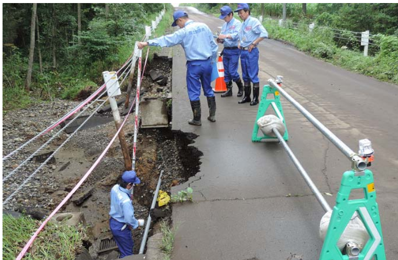
網走開建道路班 清水町 町道被災箇所調査