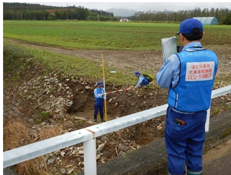
室蘭開建河川班 中札内村 被災状況調査