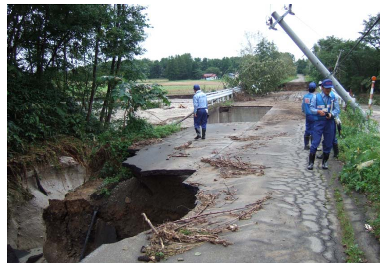
稚内開建道路班 清水町 旭山地区旭山橋 被災状況調査