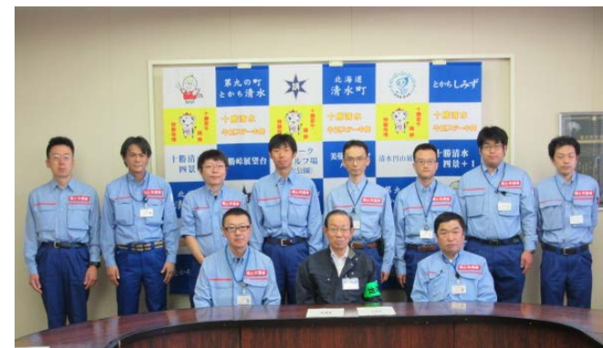
清水町長に成果報告を行う札幌開建及び網走開建の班長と隊員