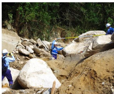
土砂災害被害状況の調査