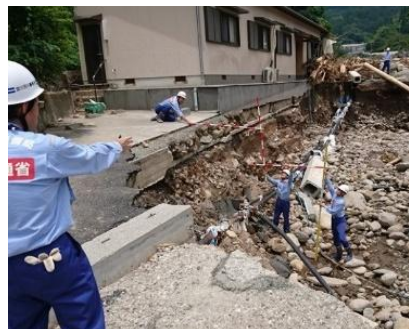
河川被害状況の調査