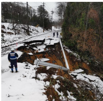
道路被害状況の調査