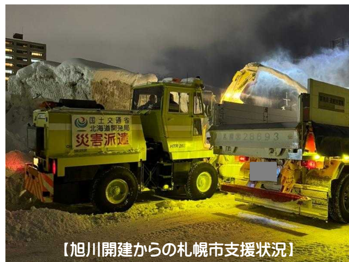
【旭川開建からの札幌市支援状況】