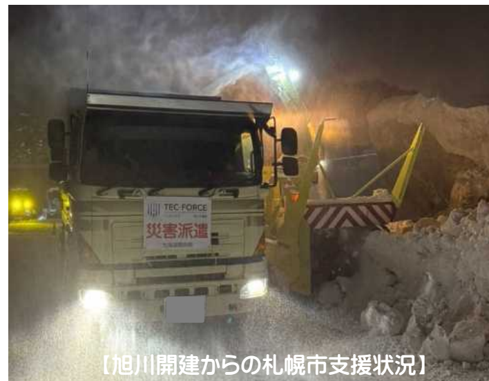
【旭川開建からの札幌市支援状況】