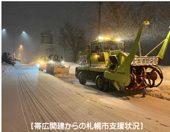
【帯広開建からの札幌市支援状況】