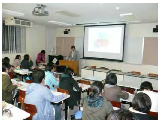
地元小学生(左)や管理衛生士を目指す 札幌近郊の大学生(右)への出前授業状況