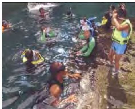
ダイバーと漁業者の連携によるウニの除去作業状況（左）と 子供達への水産教育・水泳教室（右）の状況