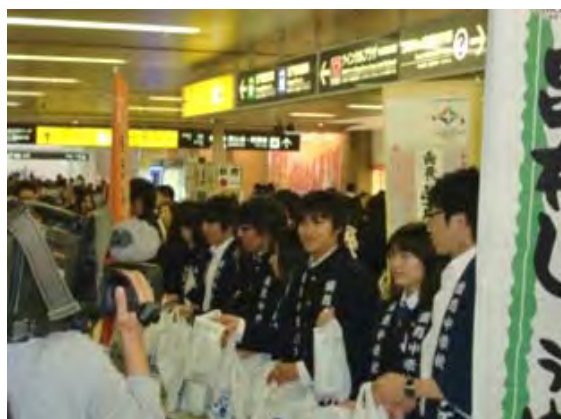
道外企業との連携による企業内マルシェ(左)と 地元学生による札幌での歯舞ブランドのPR活動(右)