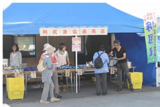
観光客への特産品試食・配布状況