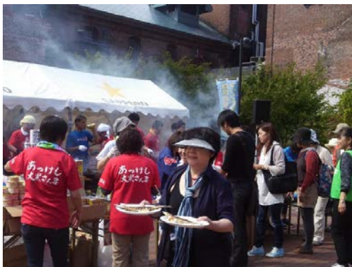
厚岸さんま祭り<札幌開催>

さらに、厚岸湖等の環境保全を意識した、漁協女性部が取り組んでいる魚介の形を模した「アクリルタワシ」の普及活動は、他地域に広がりを見せている点も評価されました。