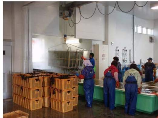
施設内での加工状況