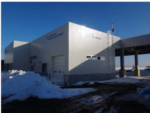
水産加工処理施設

新たな水産加工処理施設を建設し、作業の効率化とコスト削減を図りながら、漁獲から販売までの6次産業化に向けた取組を行っています。また、整備された水産加工処理施設は、屋根付き岸壁と一体的配置となっており、陸揚げ・選別・加工までの一貫した衛生管理対策を講じることで、水産物の鮮度維持・付加価値向上が図られ、利尻島を訪れる観光客や消費地での評価も高まっています。