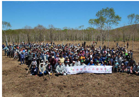
厚岸町民の森植樹祭