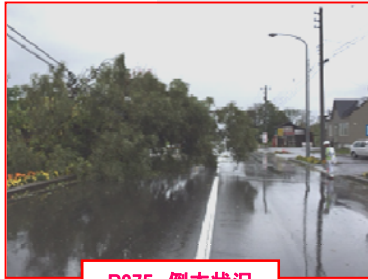
R275 倒木状況 (幌加内町政和)