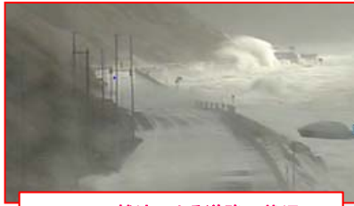
R232 越波による道路の状況 (苫前郡苫前町付近)