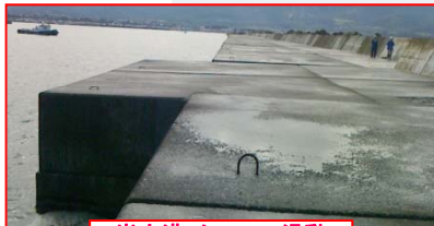
岩内港:ケーソン滑動