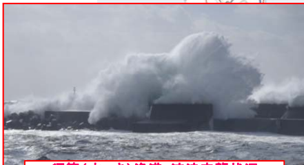
須築(すつき)漁港:波浪来襲状況