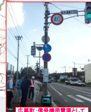
広尾町:信号機用電源として 発動発電機貸与

【国道通行止】「×」で表示 ●のべ9路線19区間(延べ167.2Km) ※最大7路線15区間(10月2日 15:00時点)