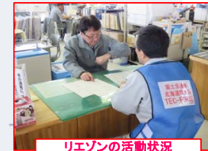
リエゾンの活動状況 稚内市

■リエゾン派遣 10月2日～4日 18市町村等へ57人・日(実人数47人) 【リエゾン派遣先】「●」で表示