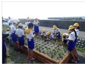
海浜植物の植栽・保護 [富山県：下新川海岸]