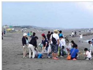
海岸清掃活動 [新潟県：新潟海岸]