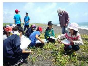
環境教育活動 [北海道：胆振海岸]