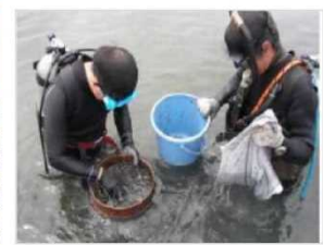
生物育成環境モニタリング [兵庫県：東播海岸]