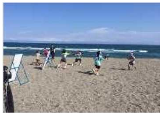
海岸PR活動（水鉄砲大会） [高知県：高知海岸]