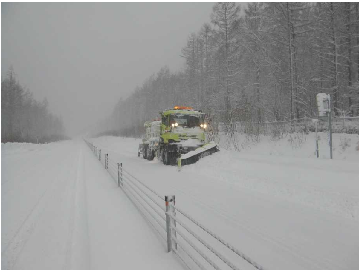
E61 十勝オホーツク自動車道 除雪作業状況