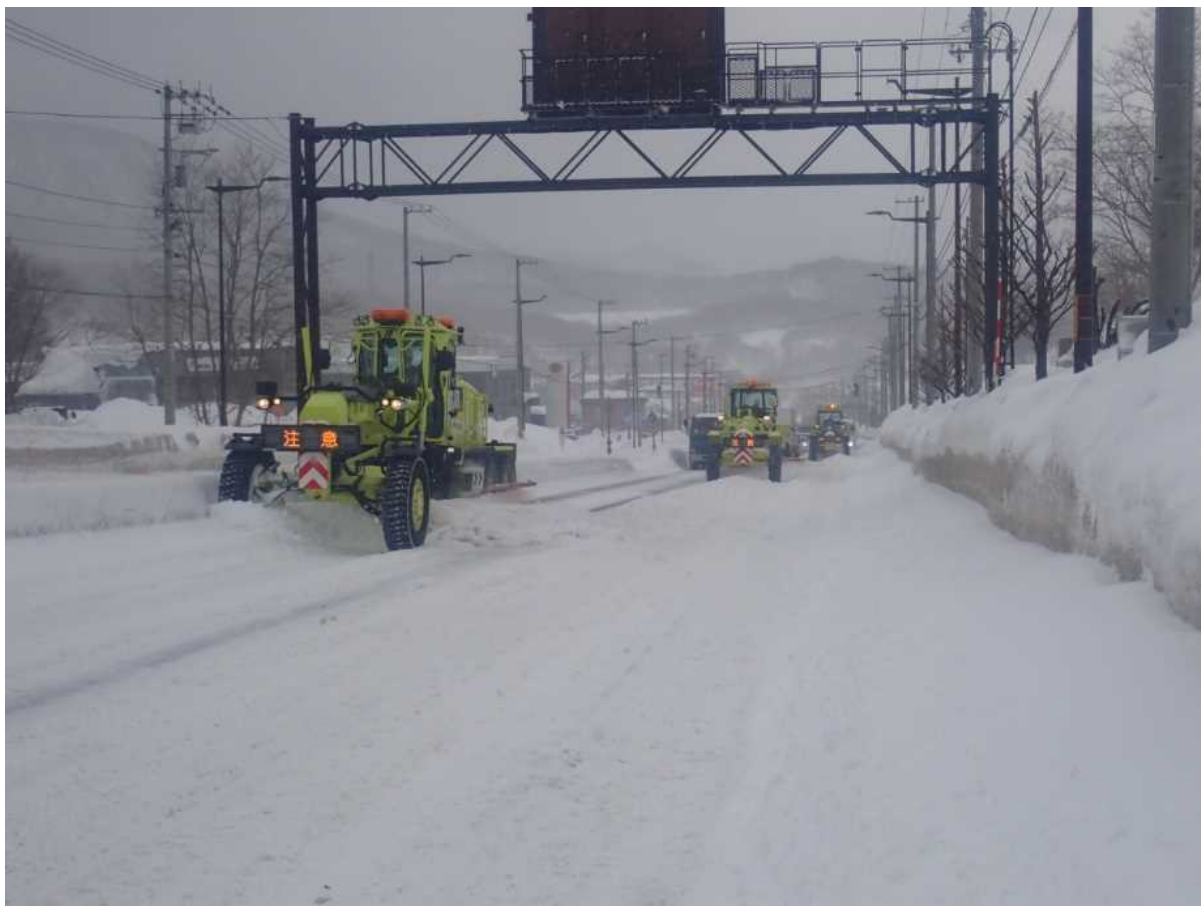
国道5号 小樽市 除雪作業状況