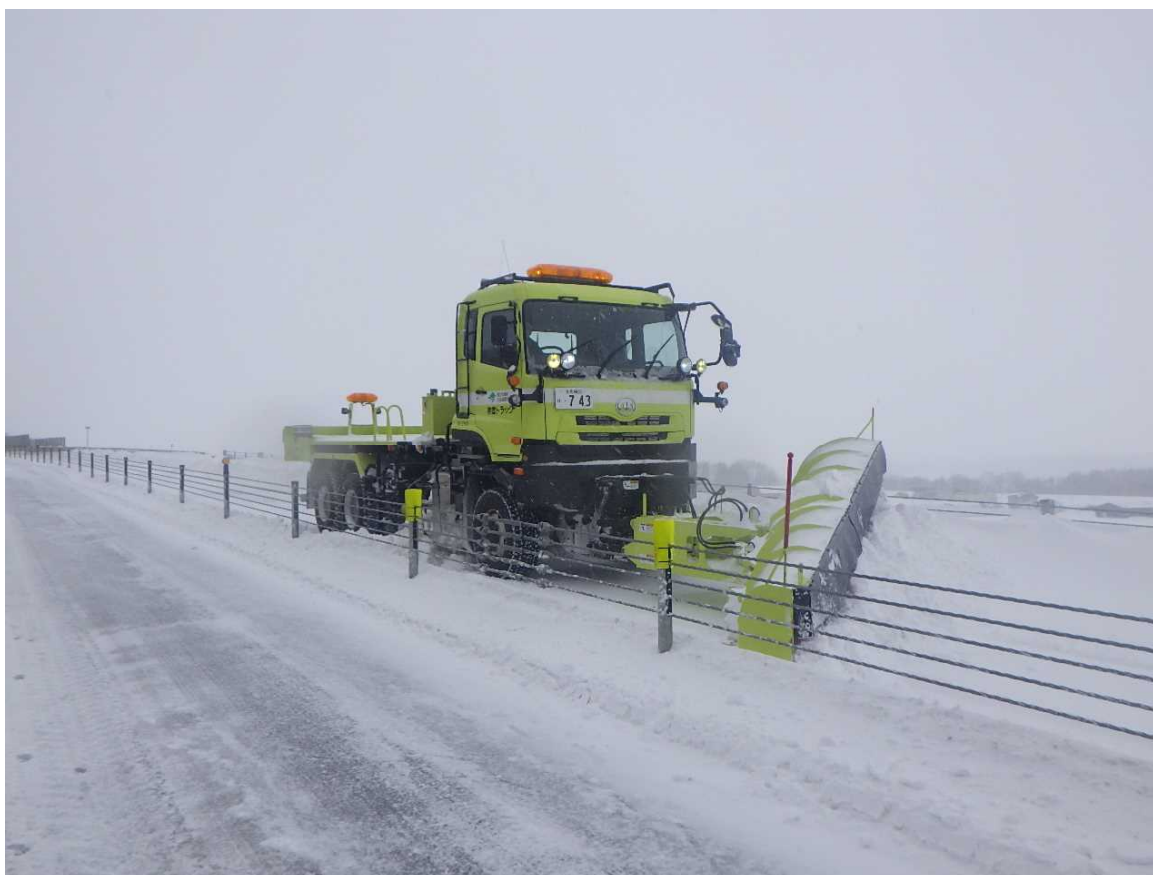
E61 十勝オホーツク自動車道 除雪作業状況