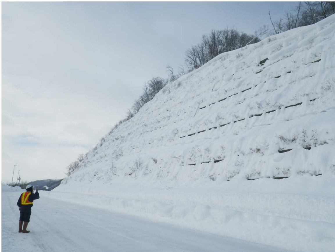
国道39号 石北峠 法面点検状況