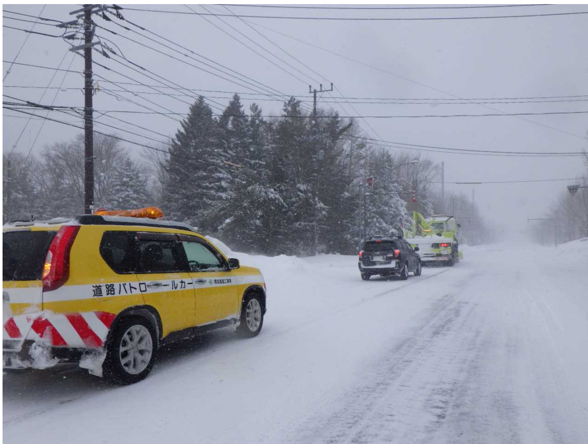
国道391号 弟子屈町 人工透析患者先導状況（2月21日）