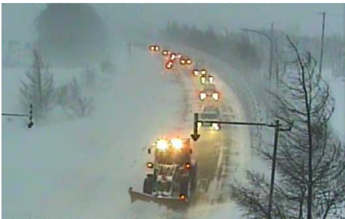
国道272号 標津町 北電作業車先導状況（2月21日）