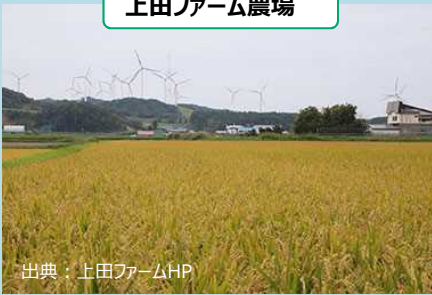
上田ファーム農場