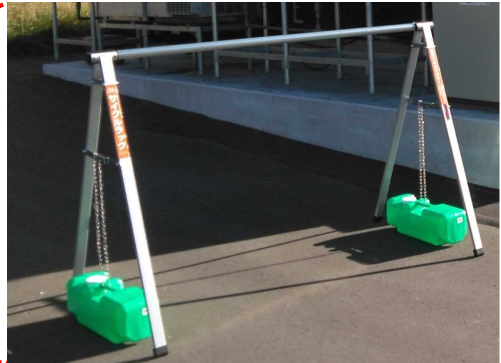
▲サイクルラック設置状況