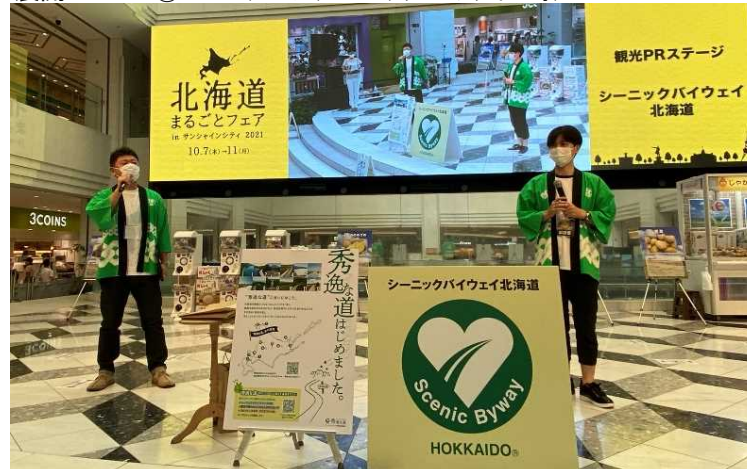
▲PRステージの様子(来場者とのコミュニケーション型クイズ等)