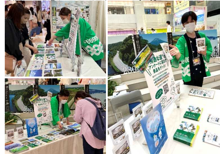
▲ポストカード、冊子「Scenic Byway」ほか