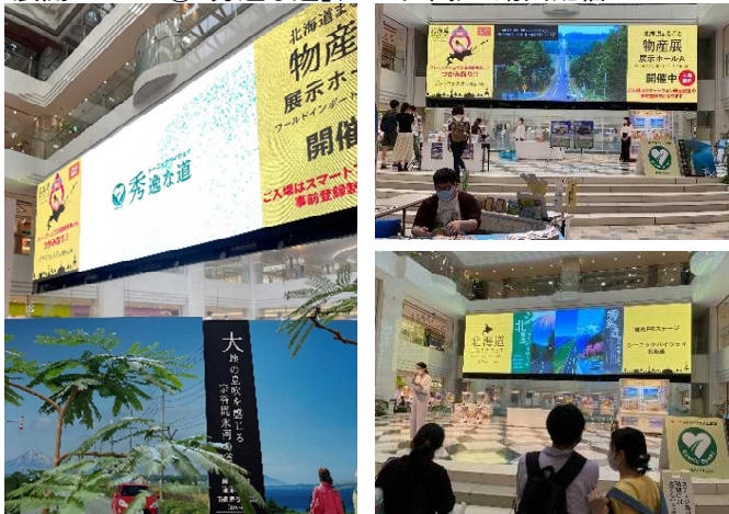
▲日本最大級628インチの大型ビジョンでの「秀逸な道」動画の配信