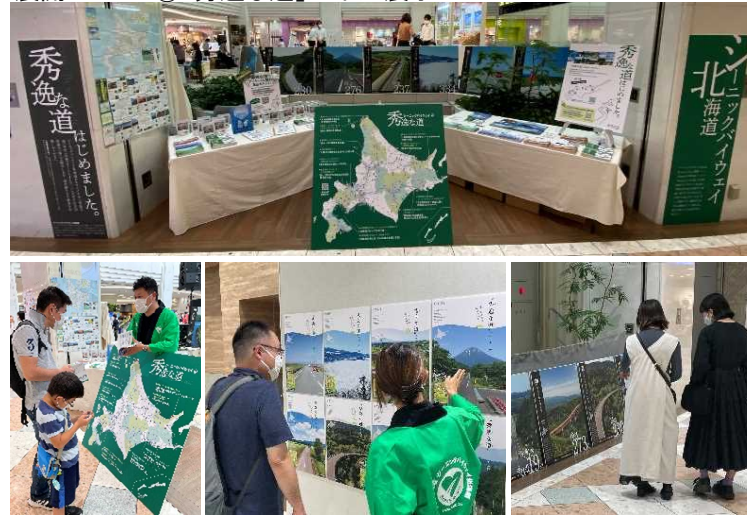
▲シーニックバイウェイ「秀逸な道」展ブースの様子