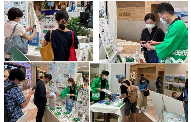
▲アンケート調査の実施(QRコードによる非接触回答スタイル)