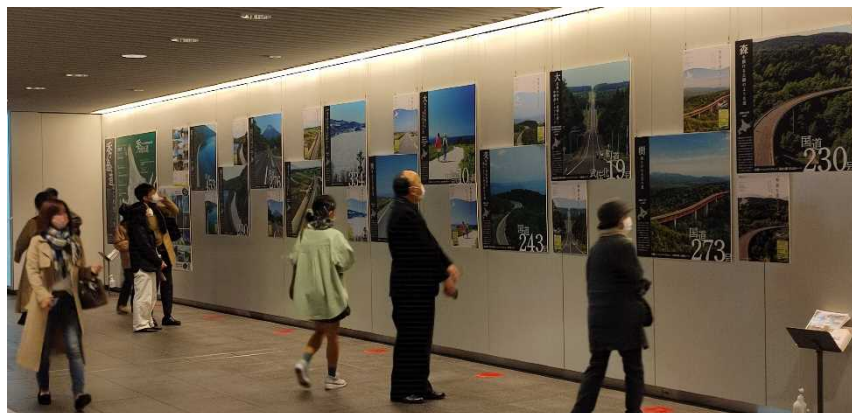
▲ポスター・パネル展示イメージ (令和3年度)