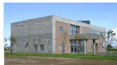
豊平川札幌地区 河川防災ステーション外観