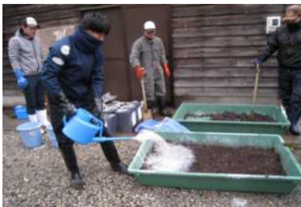
ウニ殻施肥材の作成

この取組は、持続可能な漁業としてSDGsに関する模範となる取組であり、先駆性や取組体制に関して高く評価され、優良賞に選定されました。