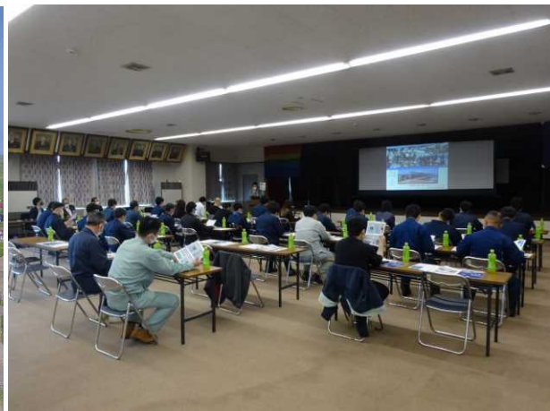
衛生管理講習会の様子