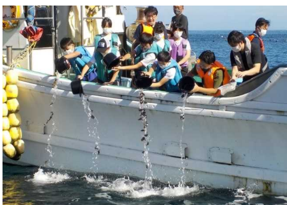
マツカワ放流事業

砂原漁協では令和4年度にふれあい体験室や見学スペースを備えた荷捌施設が完成し、新設された漁協施設の活用により、今後更に取組が強化されることが期待されるため、奨励賞に選定されました。