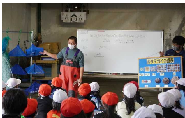
地元小学生に対する出前講座