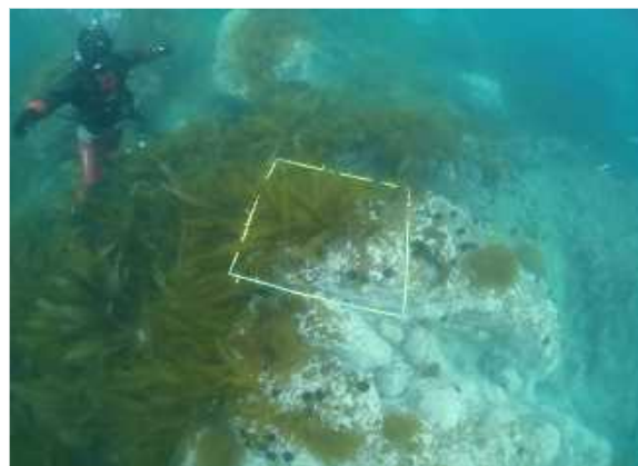
ウニ殻施肥材設置箇所における海草繁茂状況