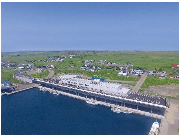
完成した高度品質・衛生管理型の 水産物荷捌施設

この取組は、ハード・ソフト対策が一体となった衛生管理に関する取組であり、先駆性や取組体制、情報発信に関して高く評価され、北海道のみならず、全国の漁村のモデルとなる取組として、最優良賞に選定されました。