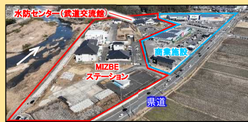
民間商業施設と隣接