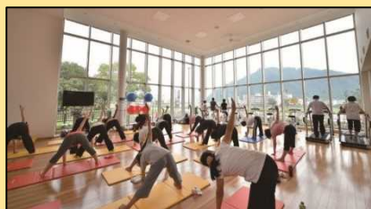
運動・教室スペース(エクササイズ)