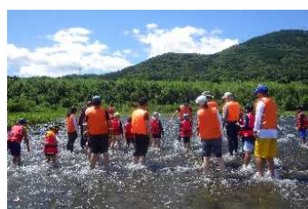
MIZBEステーションを拠点とした自然体験活動例