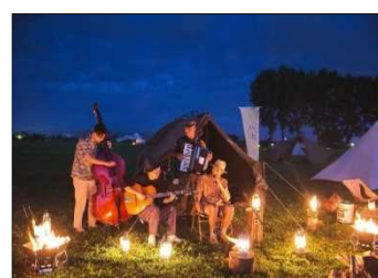
MIZBEステーションを拠点とした各種イベント実施例