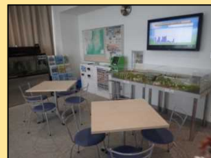
防災啓発コーナー