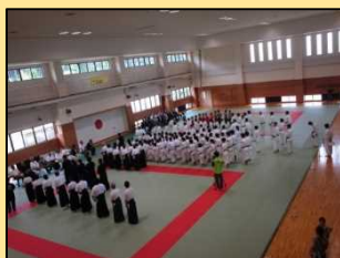
水防センター(武道交流館)