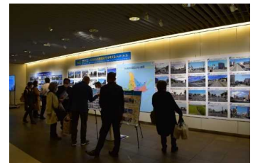
無電柱化パネル展