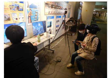
V R 体験