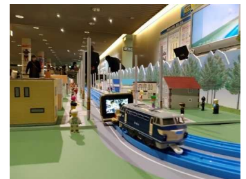
無電柱化ジオラマ展示