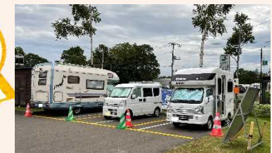
予約制駐車スペース

道の駅「摩周温泉」駐車場の 利用環境向上 釧路湿原・阿寒・摩周 シーニックバイウェイ