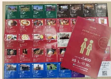
ふたりぼっちパスポート