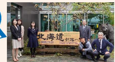
たんちょう釧路空港の新看板

地元高校と連携した 空港看板製作による地域愛の育成 釧路湿原・阿寒・摩周 シーニックバイウェイ