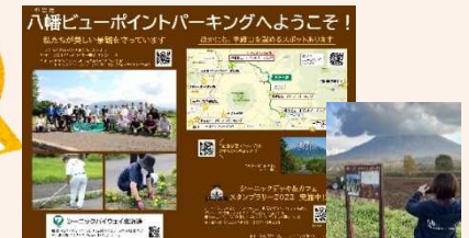
八幡ビューポイントパーキングの看板

～地域の“人”と“活動”に フォーカスして“想い”を伝える～ QRコードを活用した 地域情報の受発信プロジェクト 支笏洞爺ニセコルート