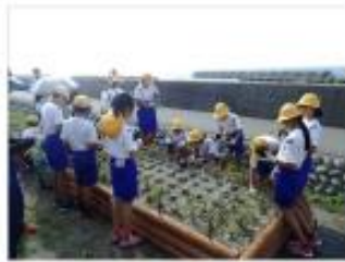
海浜植物の植栽・保護 [富山県：下新川海岸]