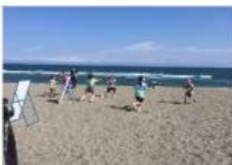
海岸PR活動（水鉄砲大会） [高知県：高知海岸]

これらの活動は海岸管理の充実にも寄与し、海岸管理の担い手として位置付け、海岸管理者が情報提供、技術的支援を行うことにより連携を強化