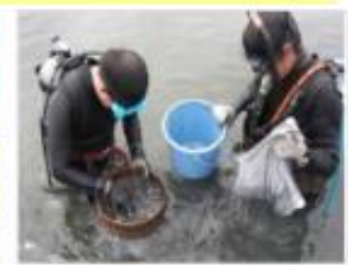
生物育成環境モニタリング [兵庫県：東播海岸]