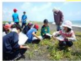
環境教育活動 [北海道：胆振海岸]