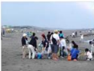
海岸清掃活動 [新潟県：新潟海岸]