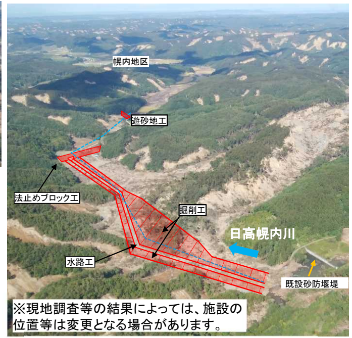
チケツペ川の山腹崩壊状況