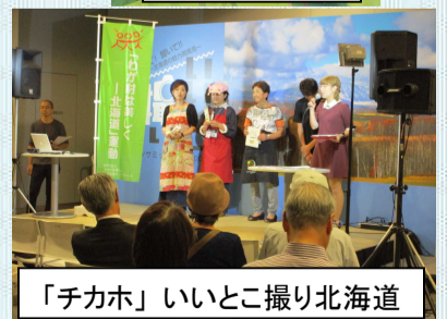
「チカホ」いいとこ撮り北海道