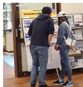
掲示板を見る外国人旅行者