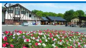
Michi-no-Eki (Roadside Rest Areas) Mashu Onsen