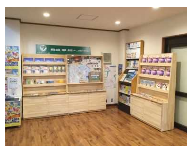
シーニックバイウェイとの連携