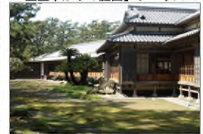
沼津御用邸記念公園(沼津市)