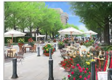
日本大通り(横浜市)