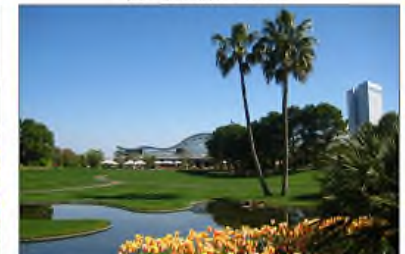
フローランテ宮崎(宮崎市)