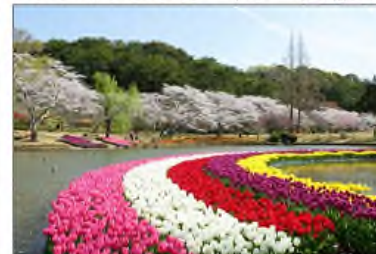
はままつフラワーパーク(浜松市)