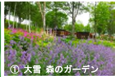
① 大雪 森のガーデン