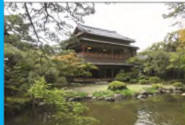
旧齋藤家別邸(新潟市)