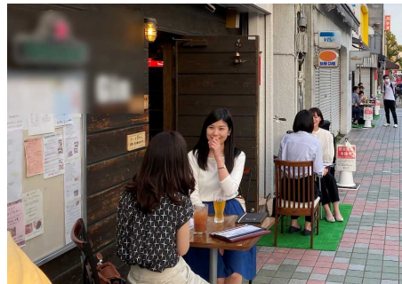
イメージ