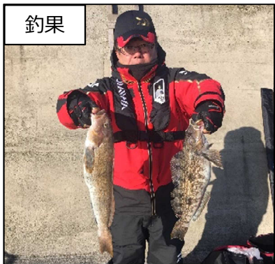
釣り調査の様子 (令和元年11月22日)