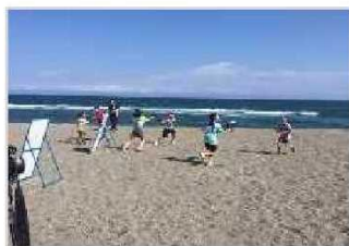
海岸PR活動（水鉄砲大会） [高知県：高知海岸]