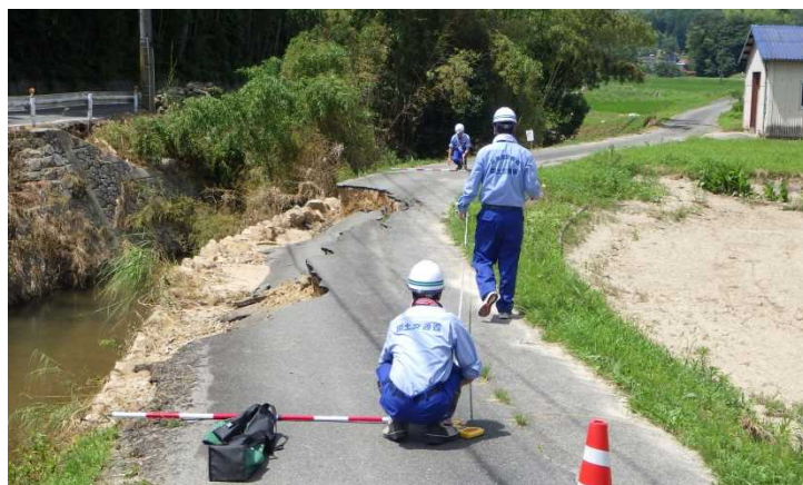
河川現地調査の様子(三原市御調川)