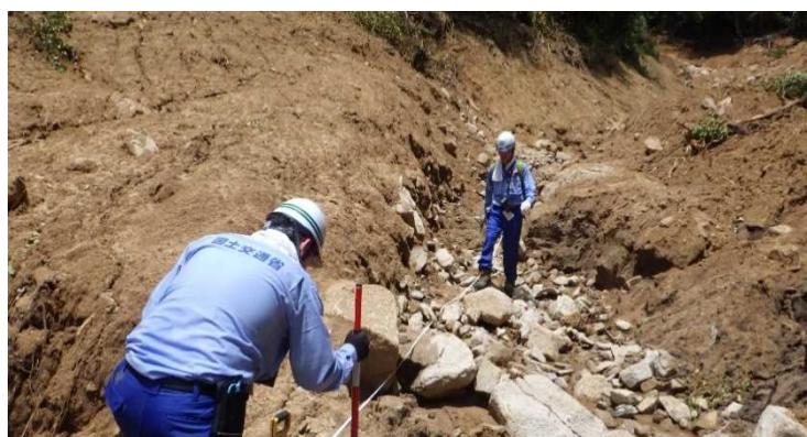
砂防現地調査の様子①(東広島市)