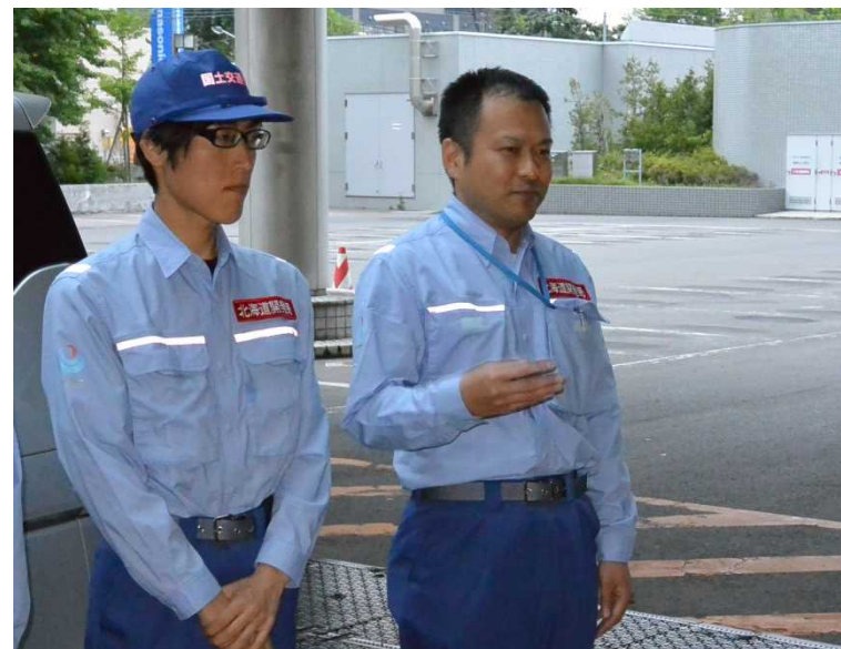
■ 岡部隊長から状況報告