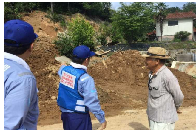
道路現地調査の様子(三原市大和地区)