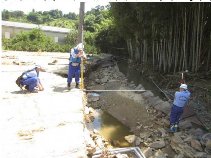
道路現地調査の様子