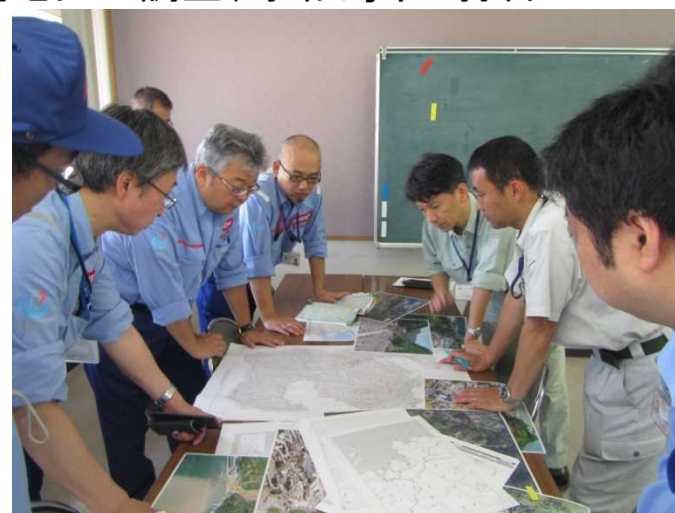
宇和島市との打合せの様子