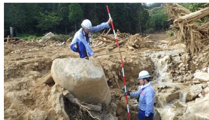
砂防現地調査の様子②(東広島市)