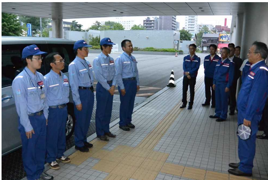
■ 帰還式の様子(7月13日(金)18:50)