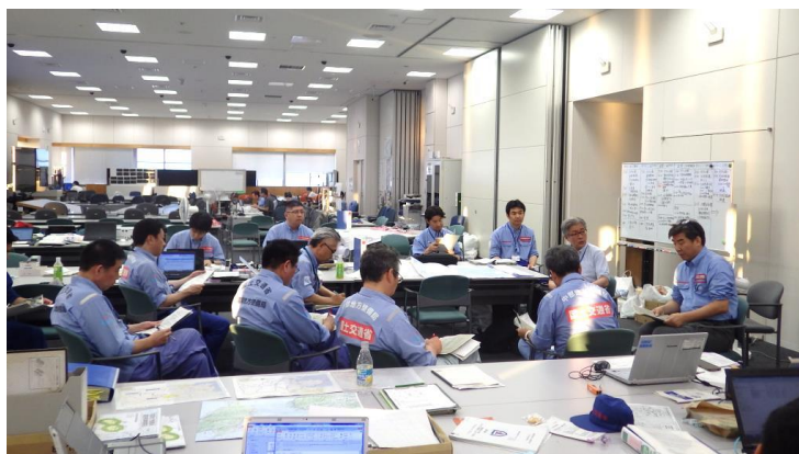
TEC地整合同会議の様子