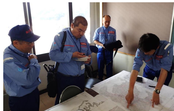
第2陣(調査班)への引継ぎの様子