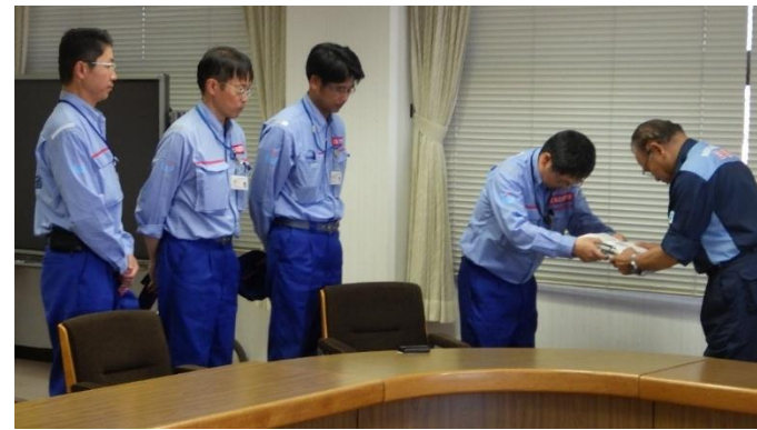
三原市長へ調査報告書を手交する道路班