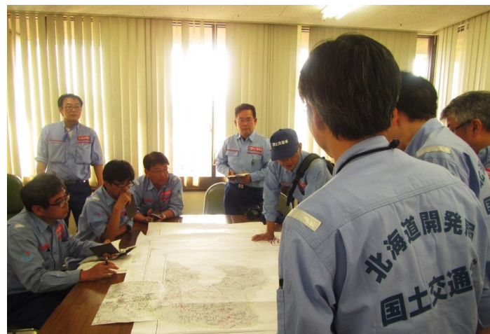
他地整TECとの打合せの様子