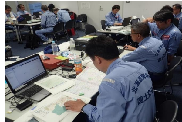
調査報告書を作成する砂防班