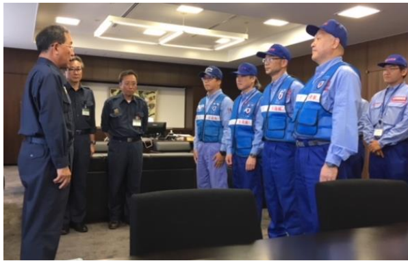
東広島市長へ調査報告書を手交する河川班