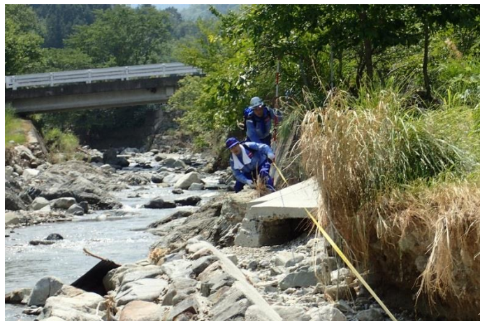
河川現地調査の様子(河津川)