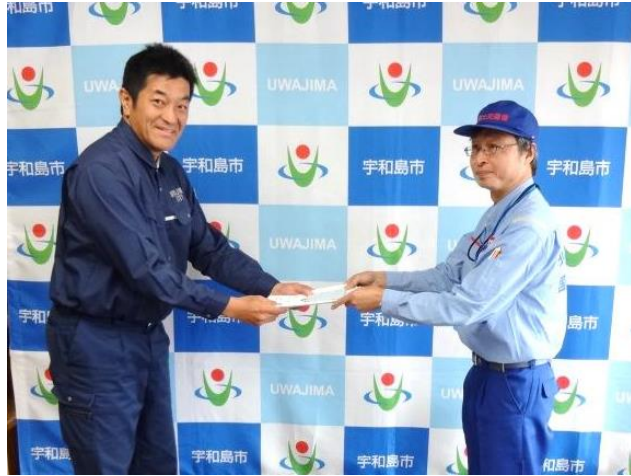
宇和島市長へ調査報告書を手交