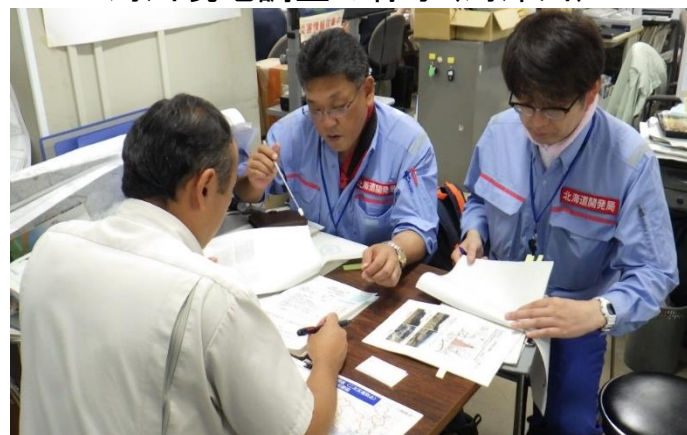
広島県担当者に調査報告書を説明する砂防班