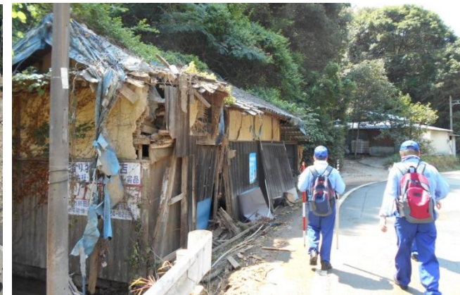
調査箇所周辺の被災した家屋