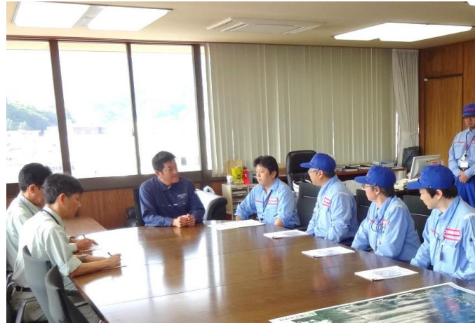
宇和島市長へ調査の報告