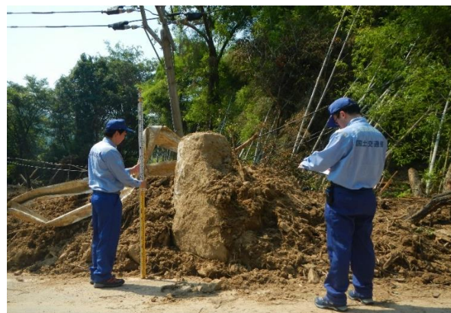
道路現地調査の様子(熊野町)