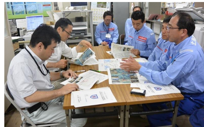
広島県へ調査内容を説明