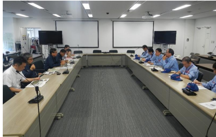
東広島市へ調査内容を説明