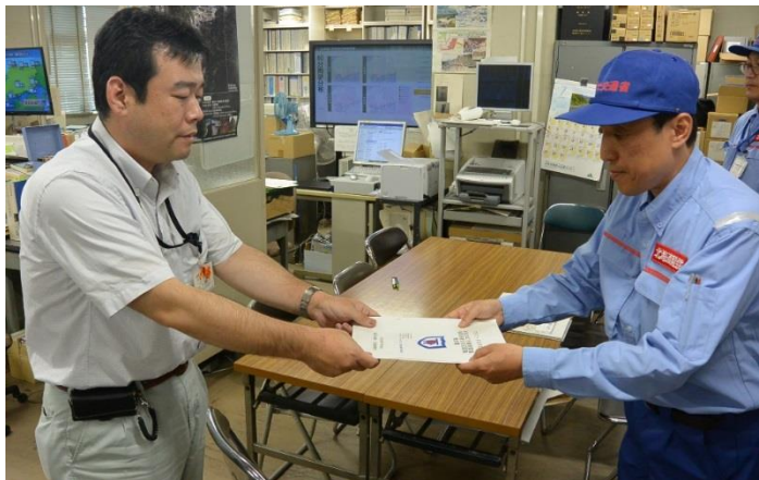
広島県へ調査報告書を手交