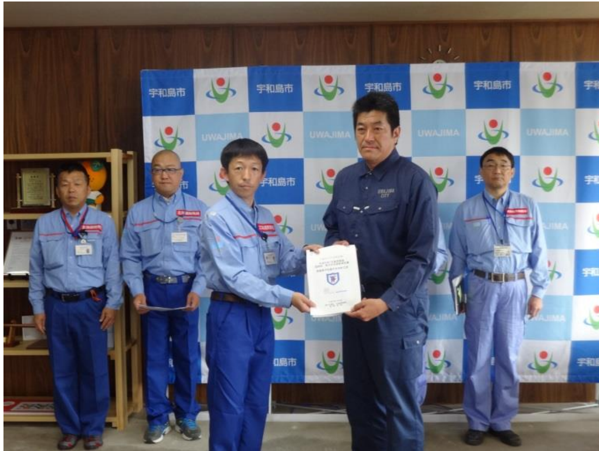
宇和島市長へ調査報告書を手交 (代表: 釧路開発建設部道路班長)