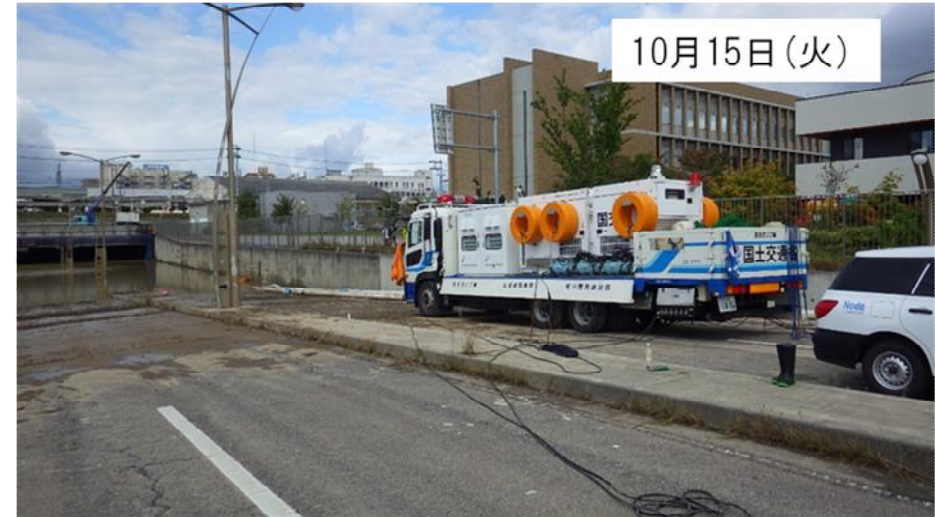
排水ポンプ車による排水作業継続中(福島県郡山市向川原町(向河原大町線アンダーパス) 応急対策班②)