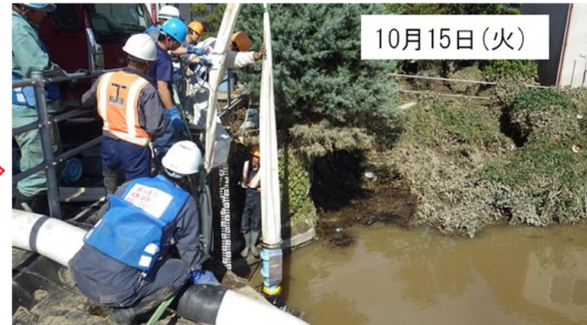
排水ポンプ車3台により排水作業完了(福島県郡山市田村町金屋上川原(古川第一池) 応急対策班①②)