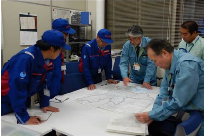
郡山市役所担当者との打合せ (郡山市役所) 河川③班