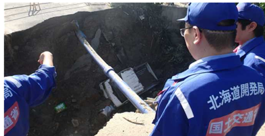
被災状況調査 (福島県伊達市梁川町五十沢) 道路②班