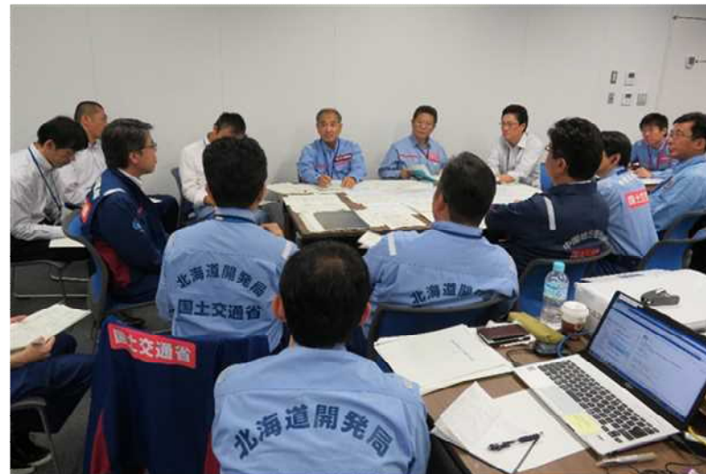
東北地方整備局との全体会議