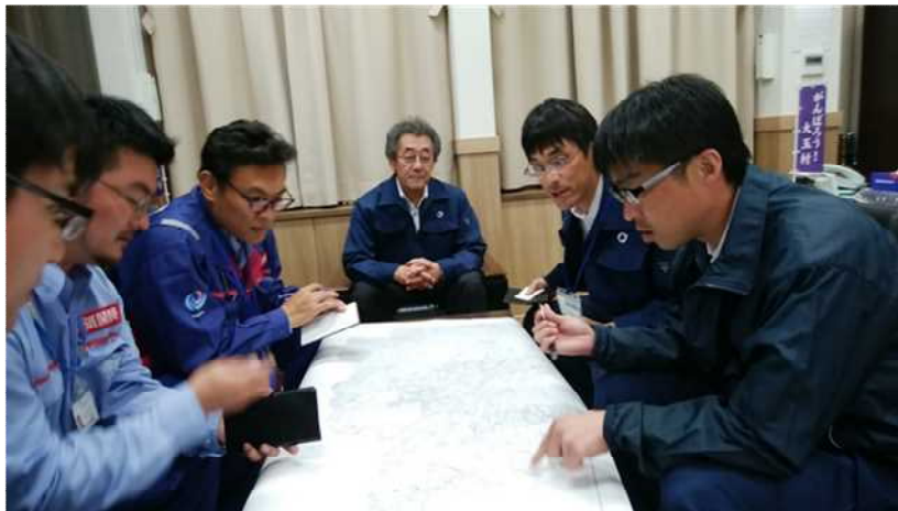
大玉村担当者との打合せ (大玉村役場) 道路②班