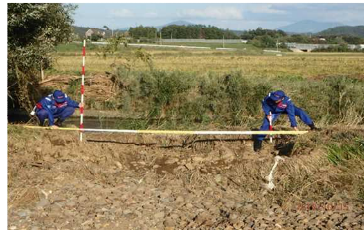
被災状況調査 (本宮市(阿武隈川水系安達太良川)) 河川①班