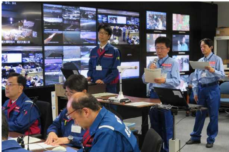
先遣班隊長から当局の支援状況報告