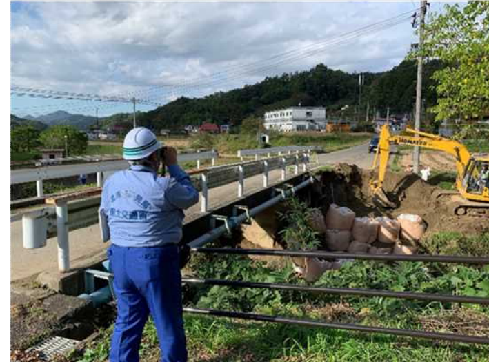
被災状況調査 (福島県伊達郡川俣町小綱木 高根川・高根橋) 砂防①班