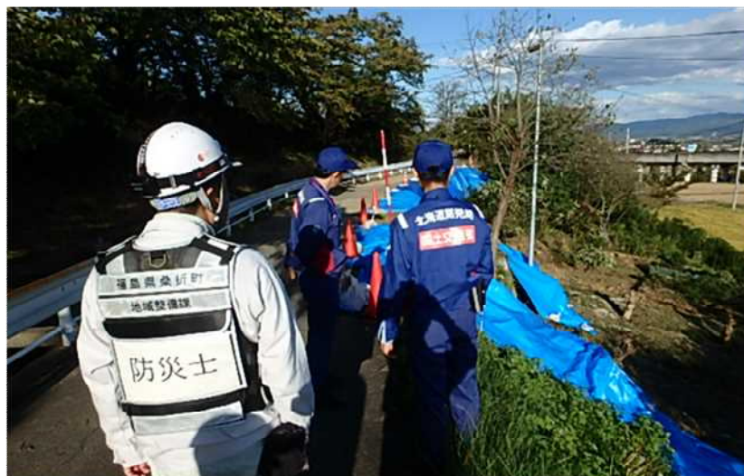
被災状況調査(道路被災箇所) (福島県伊達郡桑折町成田地区) 河川②班