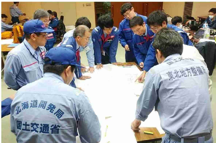
丸森町役場担当者との打合せ (宮城県伊具郡丸森町役場)