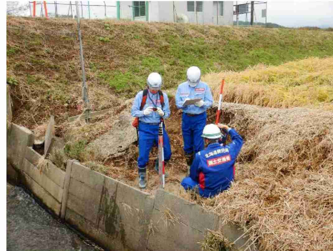
被災状況調査(河川被害箇所) (福島県須賀川市 古戸川)