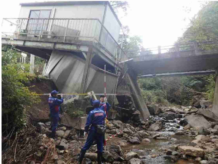
被災状況調査 (福島県伊達市 梅ノ木沢川)