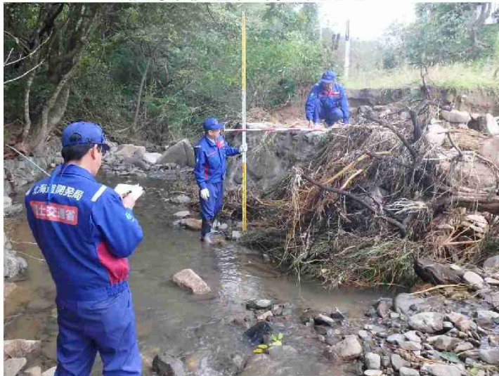
被災状況調査 (福島県伊達市 梅ノ木沢川)