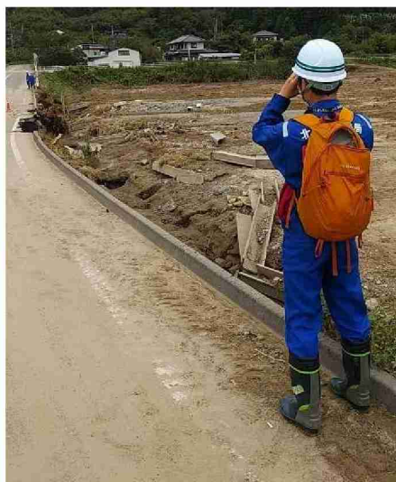
被災状況調査(道路被災箇所) (宮城県伊具郡丸森町 町道6102東向地区)