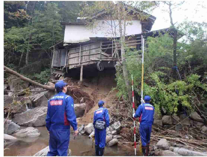
被災状況調査 (福島県伊達市 梅ノ木沢川)