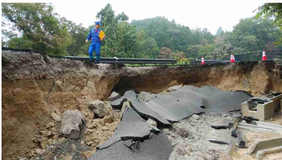
被災状況調査状 (福島県二本松市太田地区)