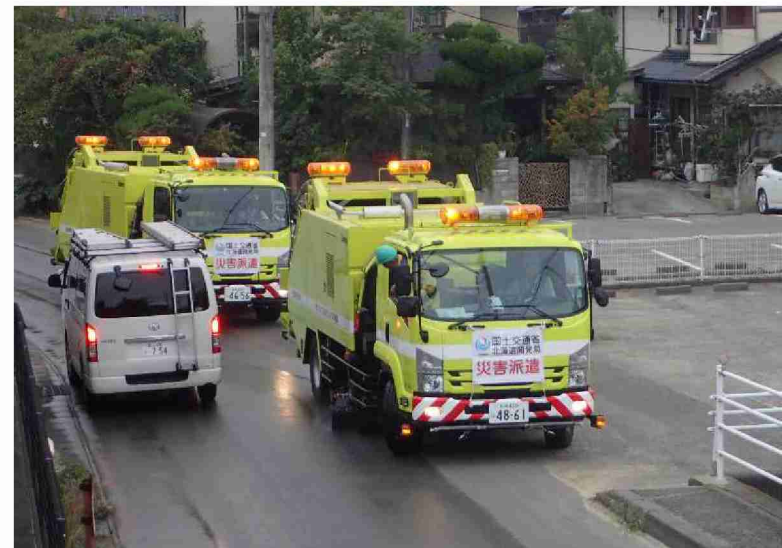
路面清掃車による路面清掃作業 (福島県郡山市)