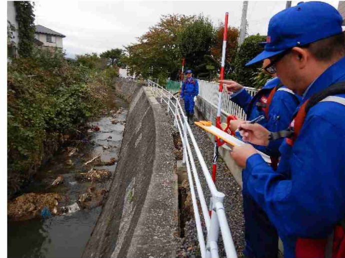
被災状況(河川被災箇所) (福島県郡山市大槻町字川向地先)