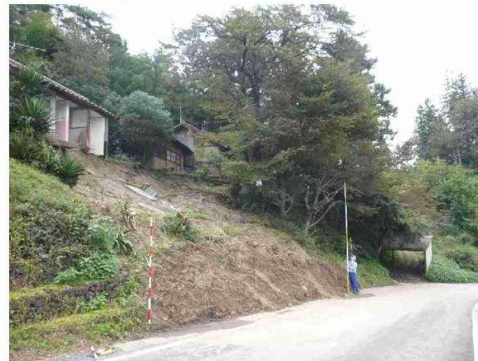
被災状況調査(道路被災箇所) (福島県伊達郡川俣町 遠西・田代線)