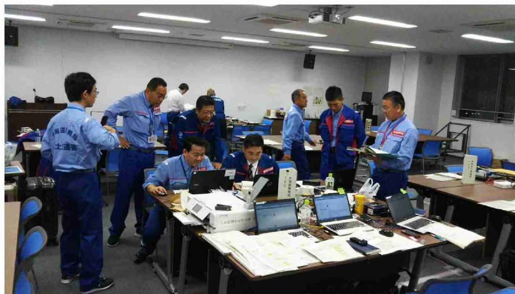
総括班による各班からの情報収集及び調整等作業 (東北地方整備局)