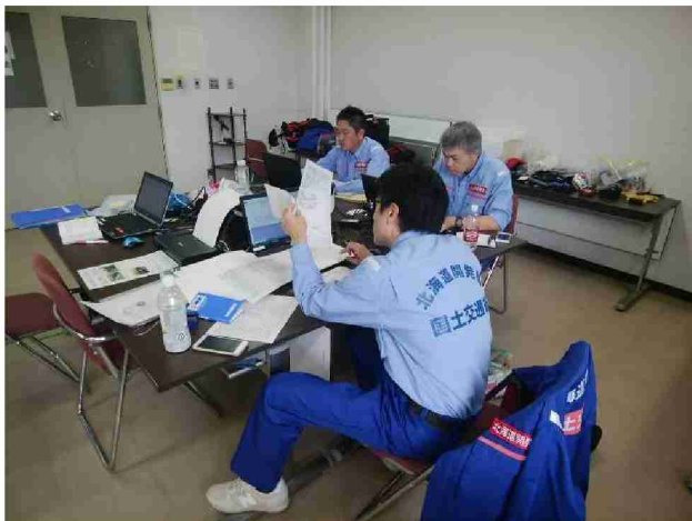
被害状況調査結果取りまとめ (郡山国道事務所)