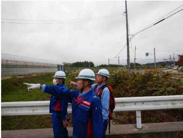
被災状況調査(河川被害箇所) (福島県須賀川市 羽黒川上流部)