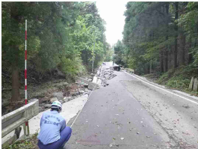
被災状況調査(道路被災箇所) (福島県伊達郡川俣町 遠西・田代線)