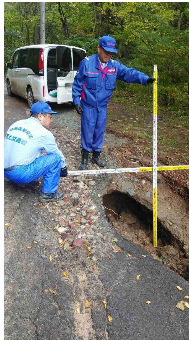
被災状況調査 (宮城県伊具郡丸森町筆甫地区)