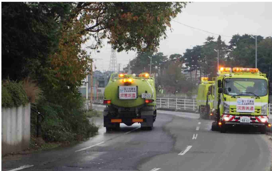
路面清掃車による路面清掃作業 (福島県郡山市)