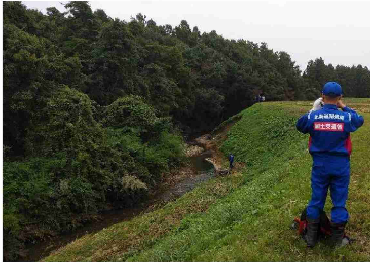
被災状況(河川被災箇所) (福島県郡山市三穂田町富岡川底原地先)