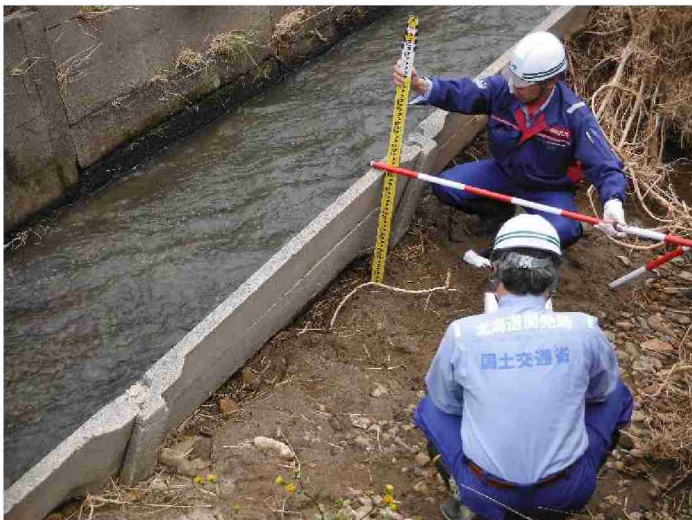
被災状況調査(河川被害箇所) (福島県須賀川市 古戸川)