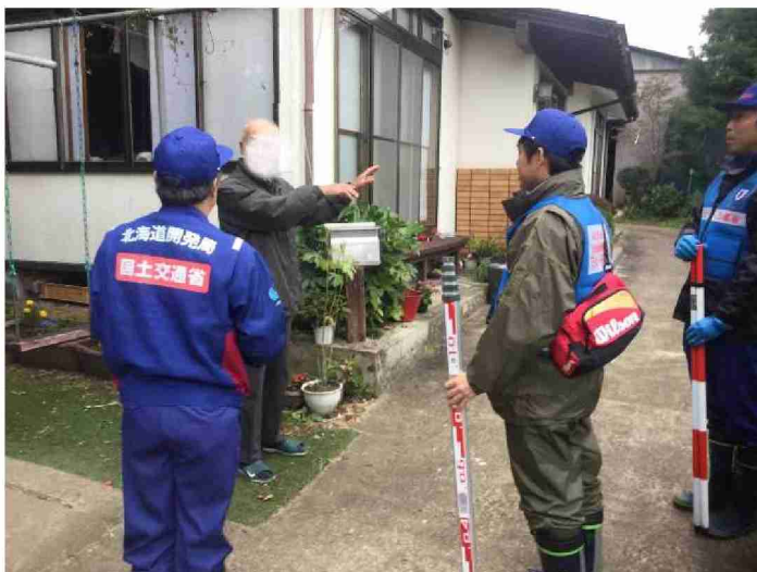
被災状況調査 (宮城県柴田郡村田町)