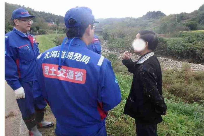
被災状況調査 (福島県伊達市 梅ノ木沢川)