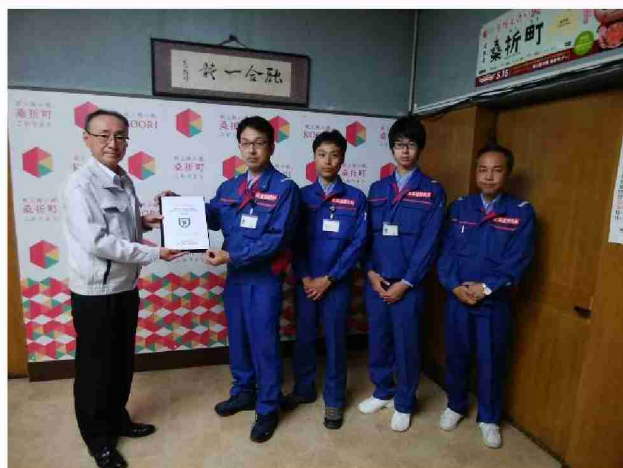
桑折町へ被害状況調査報告書を提出 (福島県伊達郡桑折町)