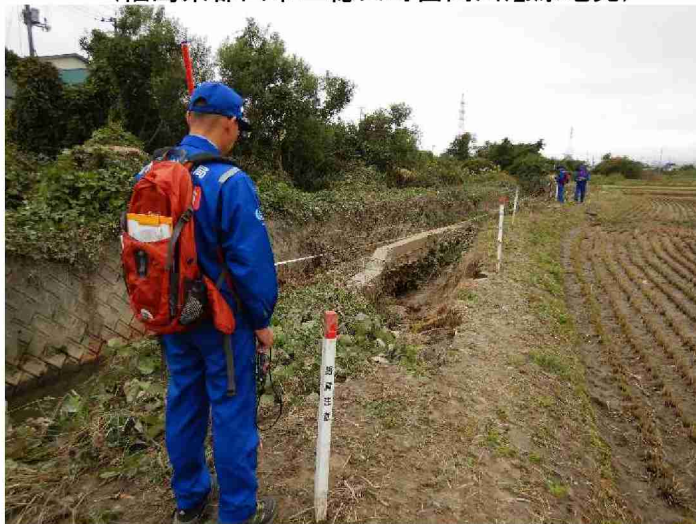
被災状況(河川被災箇所) (福島県郡山市富久山町福原字白石田地先)