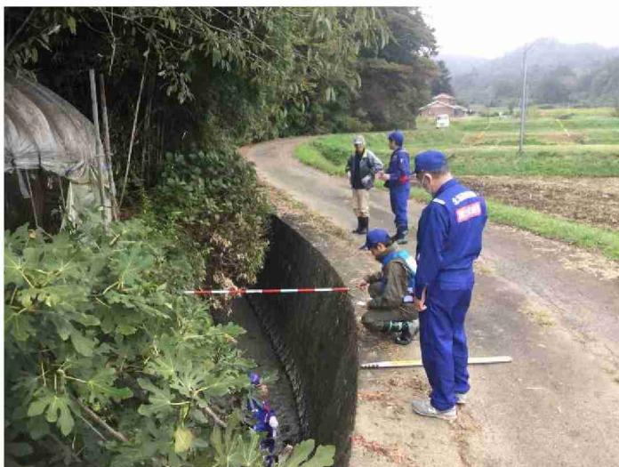
被災状況調査 (宮城県柴田郡村田町)