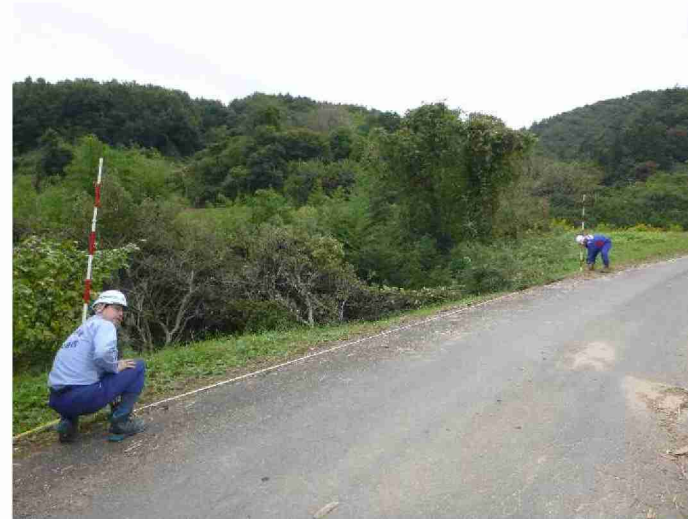
被災状況調査(道路被災箇所) (福島県伊達郡川俣町 杉坂大木田線)