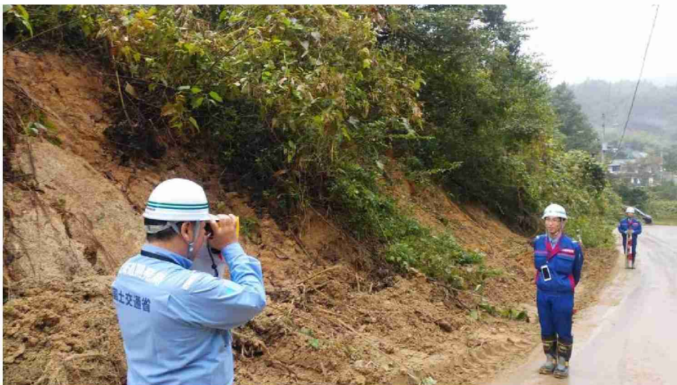
被災状況調査(宮城県角田市)