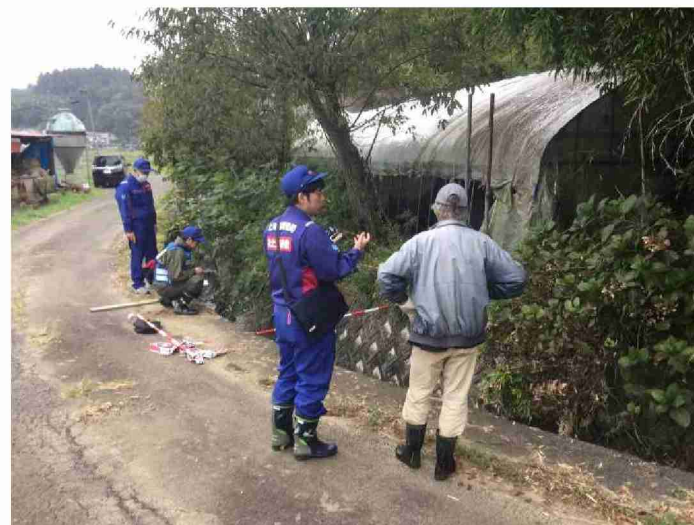
被災状況調査 (宮城県柴田郡村田町)