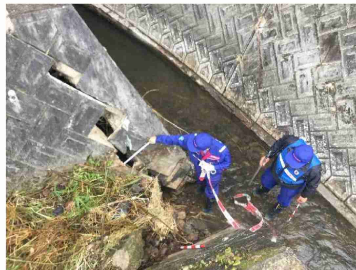
被災状況調査 (宮城県柴田郡村田町)