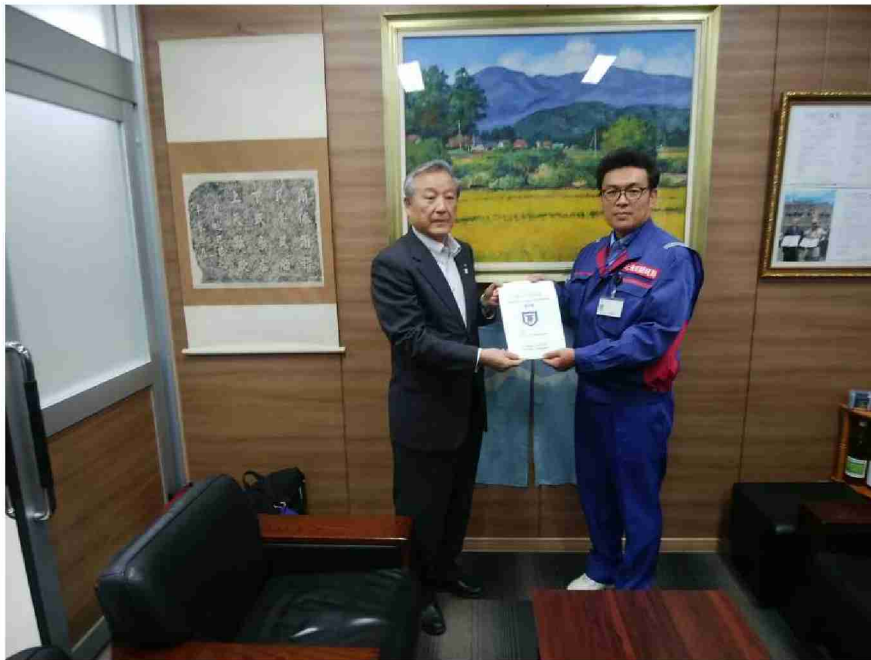
大玉村へ被害状況調査報告書を提出 (福島県安達郡大玉村)