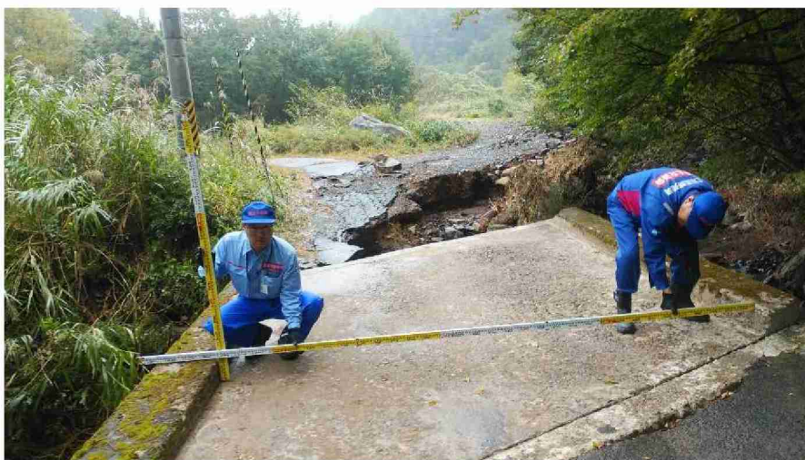
被災状況調査 (宮城県伊具郡丸森町筆甫地区)