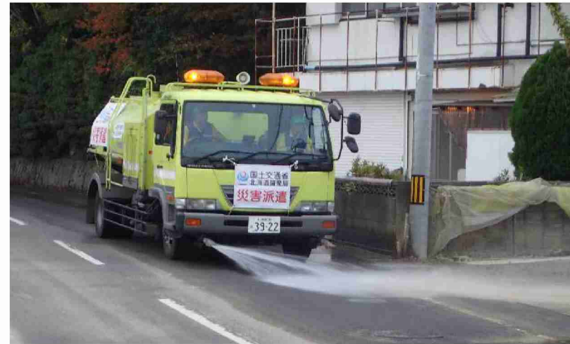
路面清掃車による路面清掃作業 (福島県郡山市)