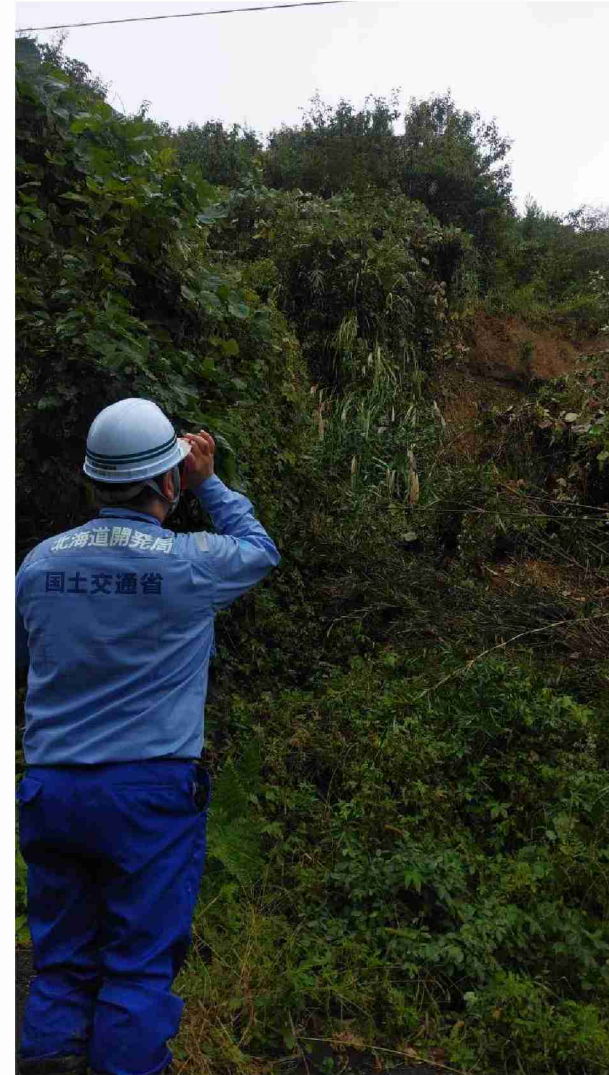
被災状況調査(宮城県角田市)