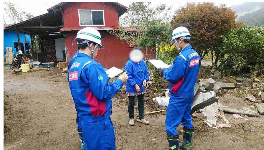
住民への聞き取り (宮城県伊具郡丸森町 大内東福田地区)