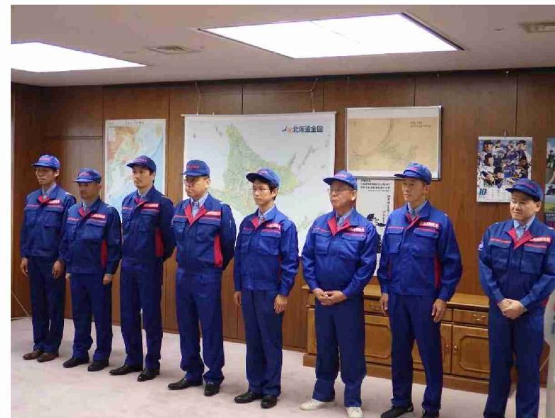
10月17日第二陣出発式(10月13日からの先遣班に変わり総括班、10月14日からの応急対策班1班の第二陣)