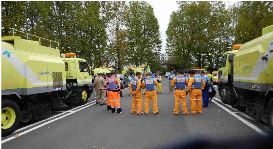
路面清掃車による路面清掃作業打合せ (福島県郡山市)