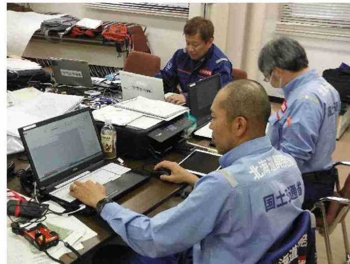
被害状況調査結果取りまとめ (郡山国道事務所)