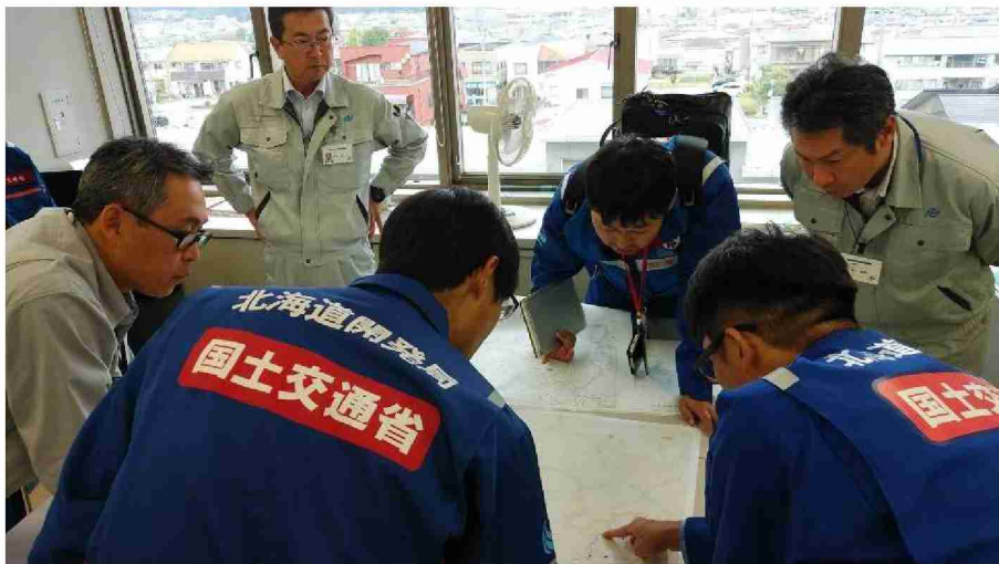
二本松市役所担当者との打合せ