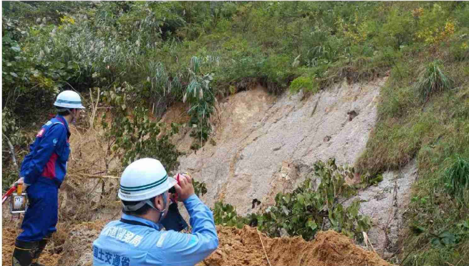
被災状況調査(宮城県角田市)