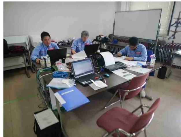
被害状況調査結果取りまとめ (郡山国道事務所)