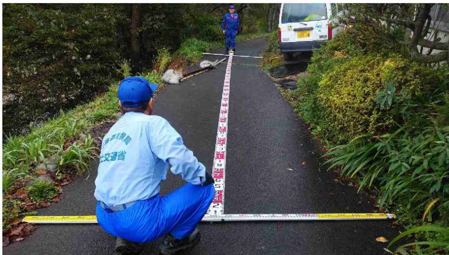
被災状況調査 (宮城県伊具郡丸森町筆甫地区)