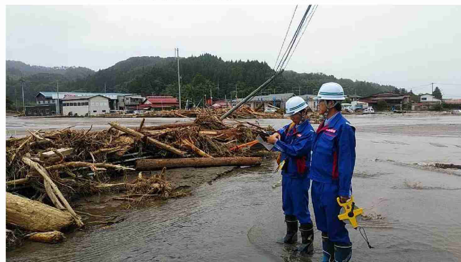
被災状況調査(道路被災箇所) (宮城県伊具郡丸森町 町道6393五福谷地区)