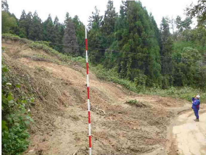
被災状況調査(道路被災箇所) (福島県伊達郡川俣町 杉坂大木田線)