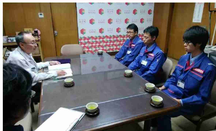
桑折町へ被害状況調査報告書を提出 (福島県伊達郡桑折町)