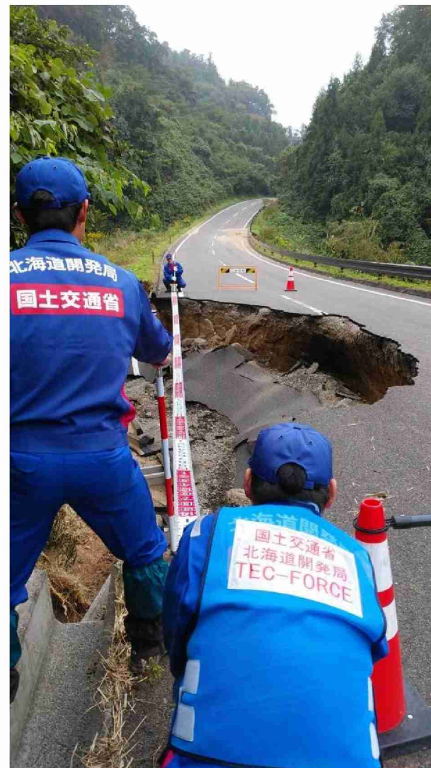
被災状況調査 (福島県二本松市太田地区)