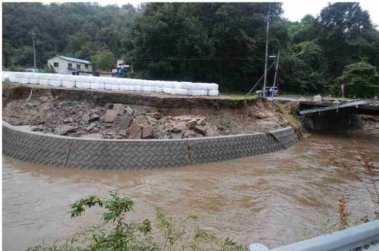
被災状況調査(道路2班) (福島県二本松市初森地区)