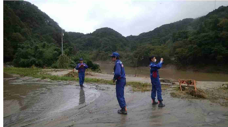
丸森町道路災害箇所 (宮城県伊具郡丸森町)