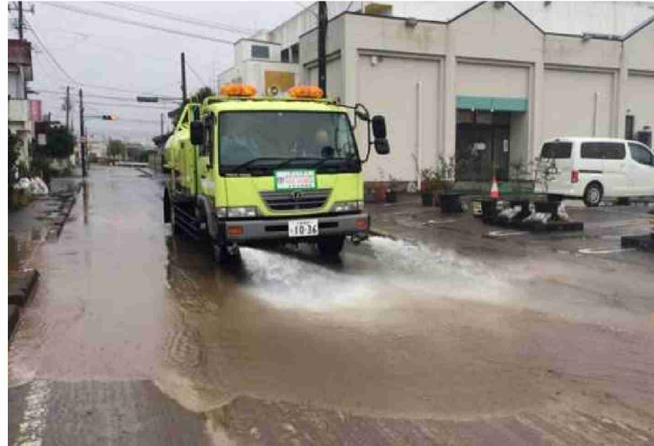
路面清掃作業 (福島県相馬市)