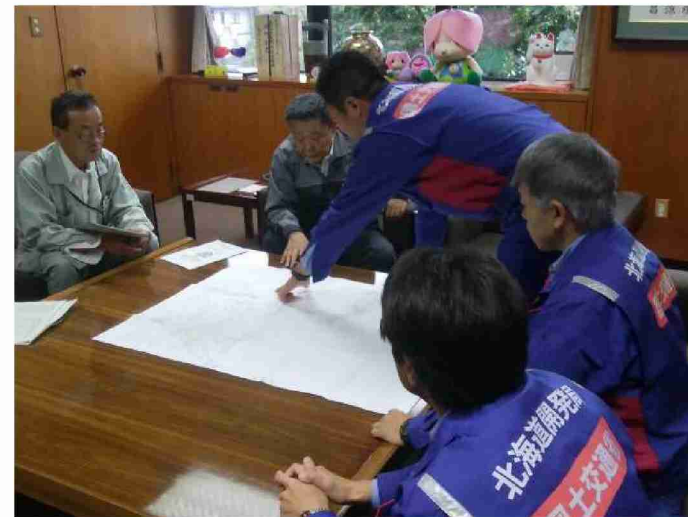
本宮市長打合せ (福島県本宮市)