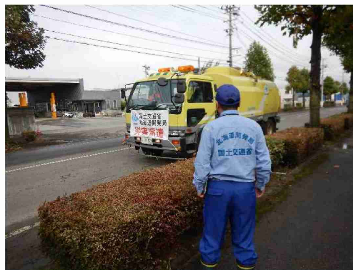
路面清掃作業 (福島県郡山市)