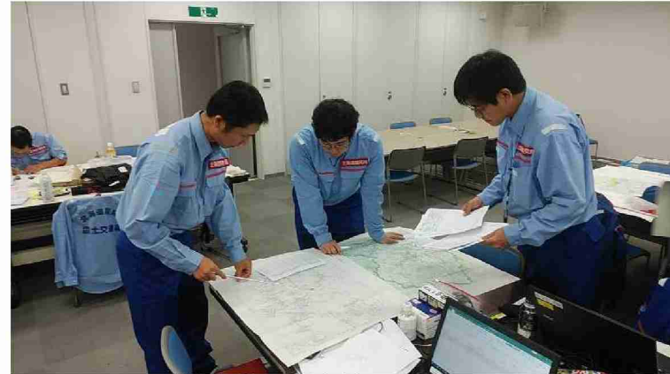
被害状況調査結果取りまとめ (仙台河川国道事務所)