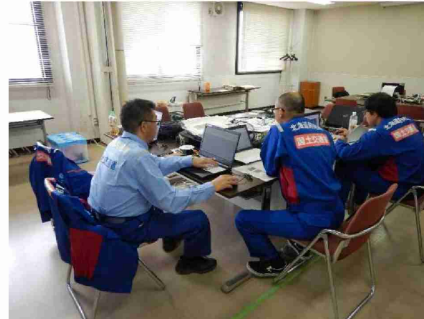
郡山市役所担当者との打合 (福島県郡山市)