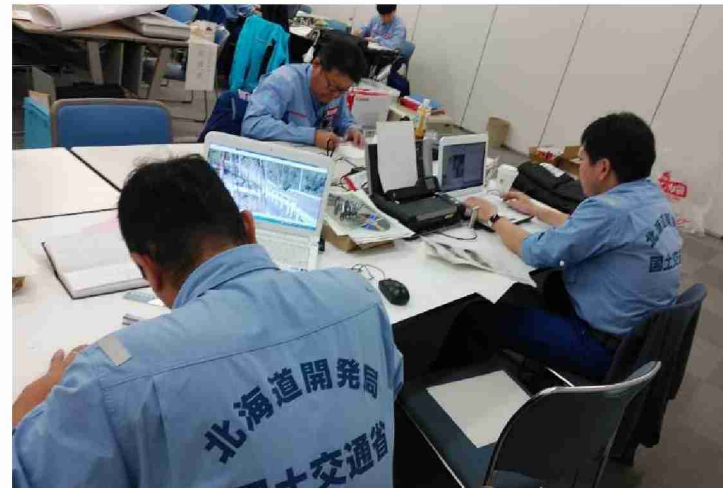
被害状況調査結果取りまとめ(道路1, 3～6) (仙台河川国道事務所、福島河川国道事務所)