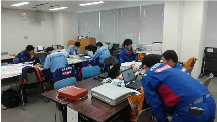
被害状況調査結果取りまとめ (仙台河川国道事務所)