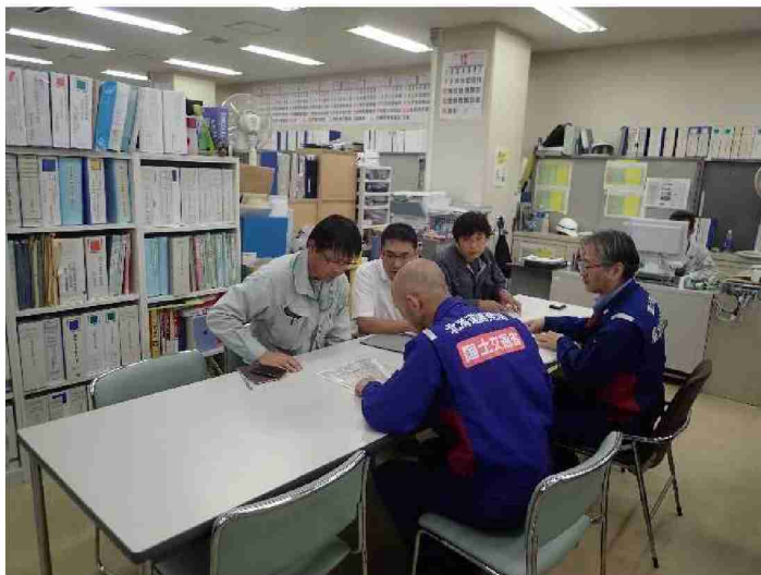
郡山市役所担当者との路面清掃作業打合せ (福島県郡山市)