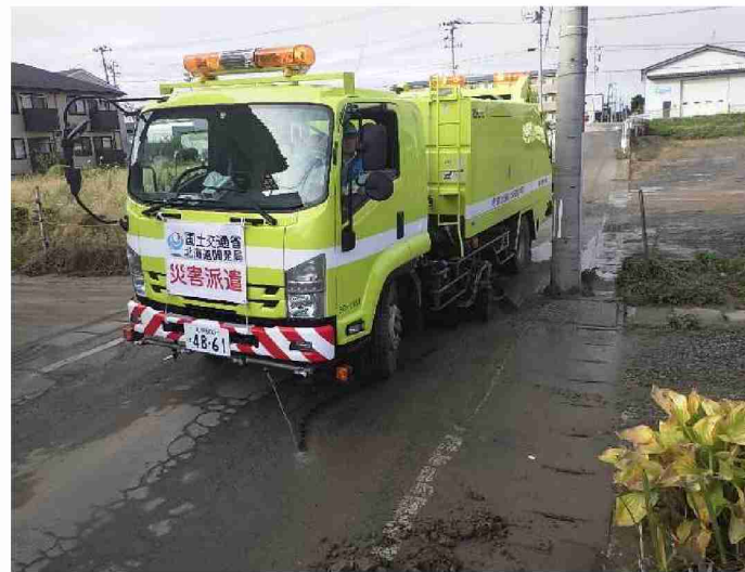
路面清掃作業 (福島県郡山市)