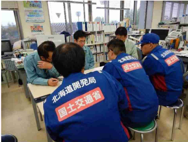
郡山市役所担当者との打合 (福島県郡山市)