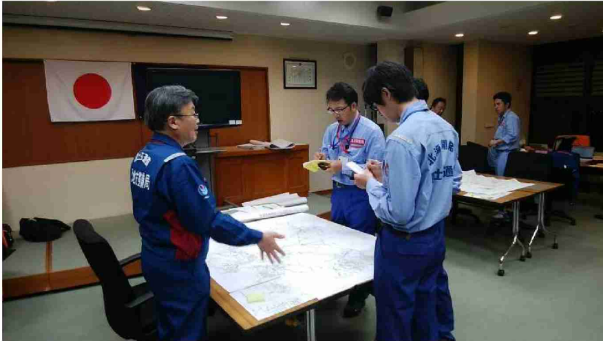
丸森町現地司令部との打合せ (宮城県伊具郡丸森町)