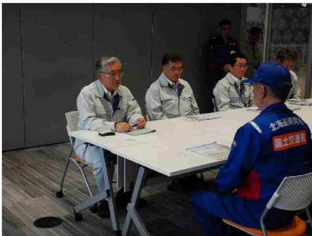
須賀川市へ被害状況調査報告書提出 (福島県須賀川市)