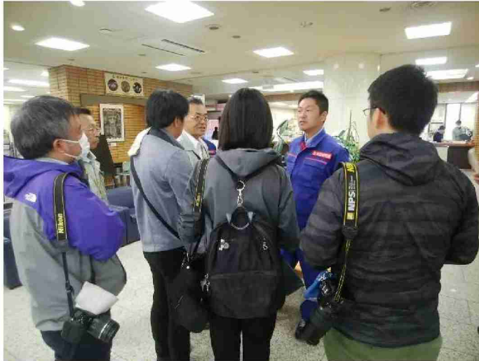
報道機関対応 (福島県本宮市)