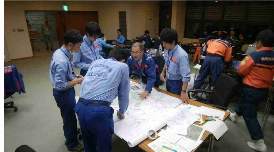
丸森町役場担当者との打合せ (宮城県伊具郡丸森町)