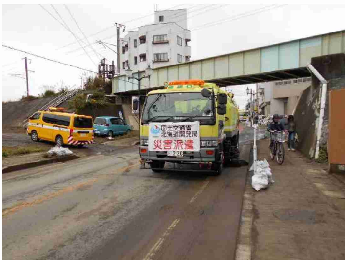
路面清掃作業 (福島県郡山市)