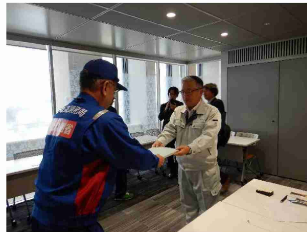
須賀川市へ被害状況調査報告書提出 (福島県須賀川市)