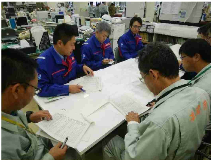
本宮市役所担当者との打合せ (福島県本宮市)