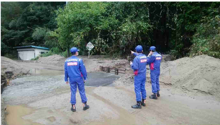
丸森町道路災害箇所 (宮城県伊具郡丸森町)