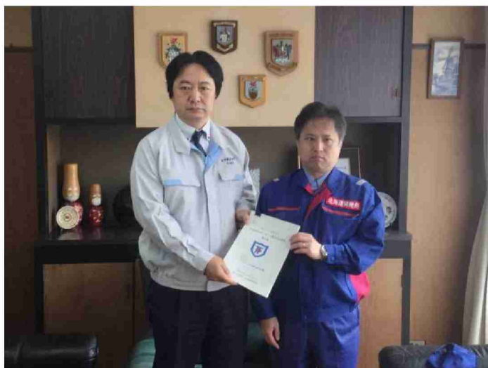
村田町へ被害状況調査報告書提出 (宮城県村田町)