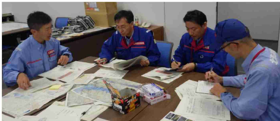
第2陣への引継ぎ (東北地方整備局)