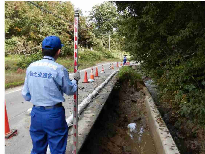
被災状況調査 (福島県二本松市初森地区)