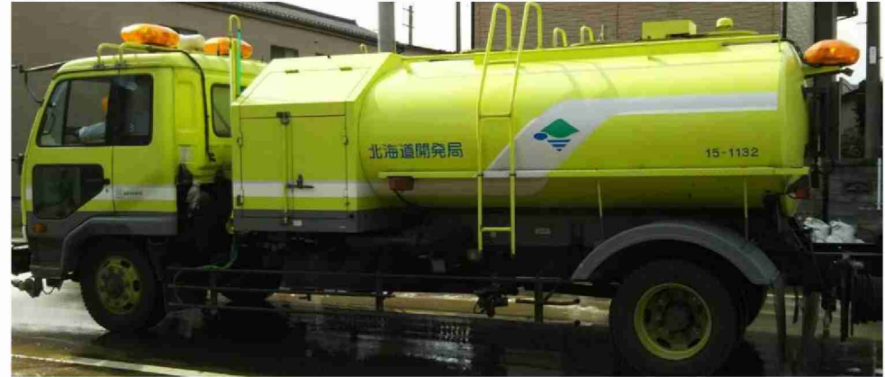
路面清掃車等による路面清掃作業 現地打合せ(福島県相馬市)