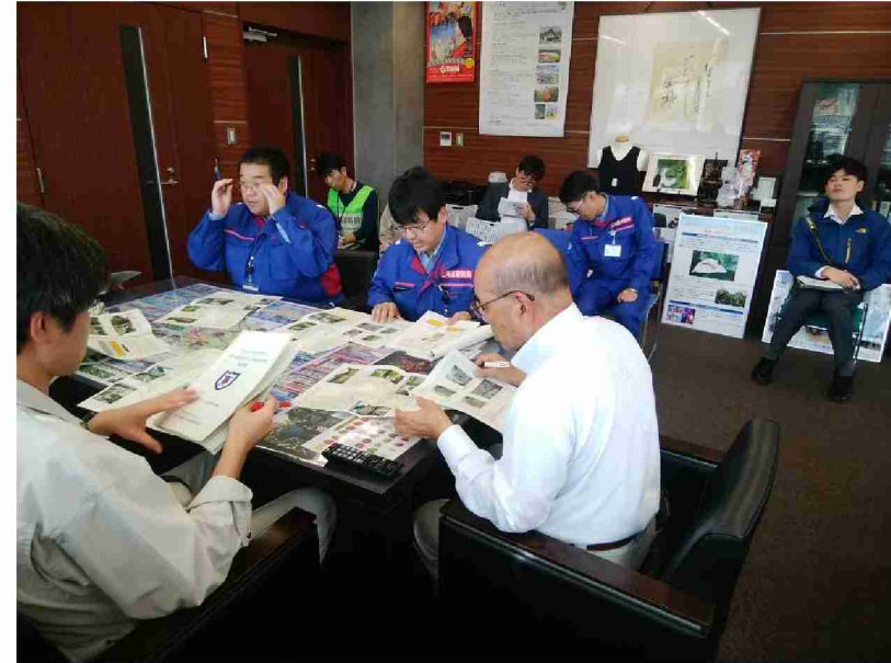
川俣町へ被害状況調査報告書提出 (福島県伊達郡川俣町)