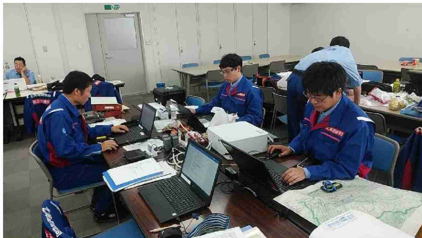
被害状況調査結果取りまとめ (仙台河川国道事務所)