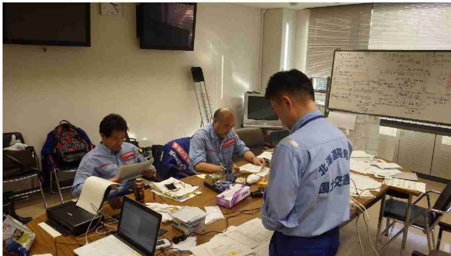
排水ポンプ車による排水作業状況取りまとめ (福島県郡山市)