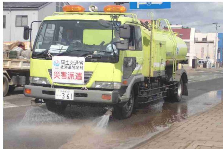
路面清掃車等による路面清掃作業 (福島県本宮市)