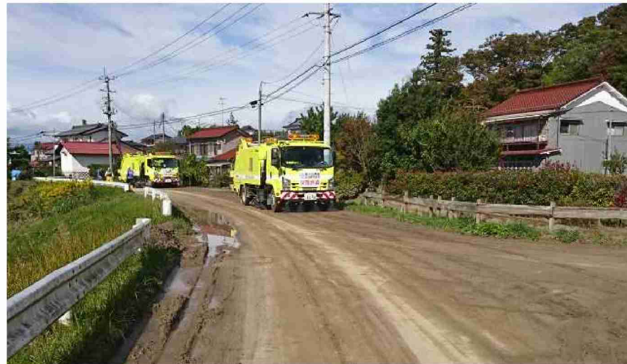
路面清掃車等による路面清掃作業 現地打合せ(福島県郡山市)