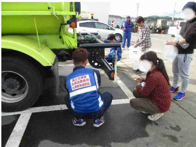
散水車(給水装置付)による給水支援 (宮城県丸森町 館矢間小学校)