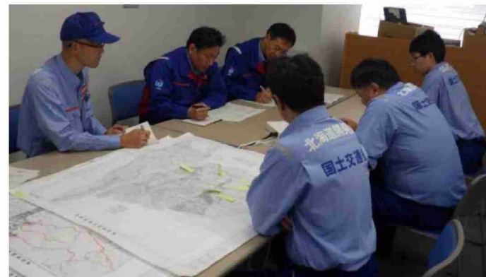
第2陣への引継ぎ (仙台河川国道事務所)