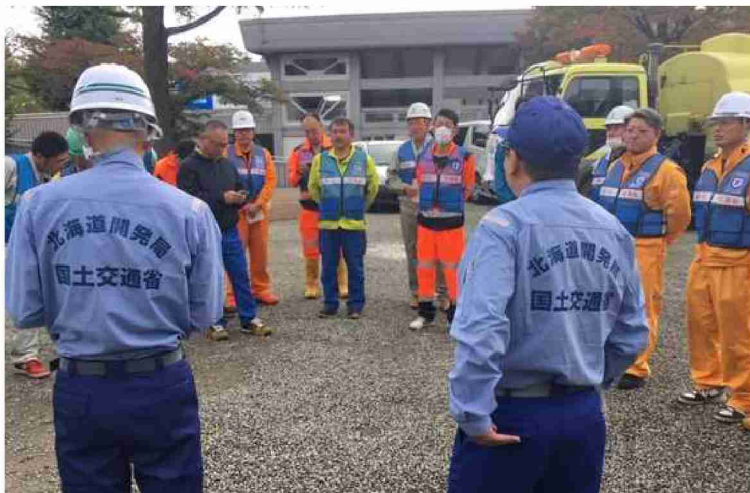
路面清掃車等による路面清掃作業 現地打合せ(福島県郡山市)