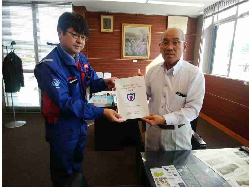
川俣町へ被害状況調査報告書提出 (福島県伊達郡川俣町)