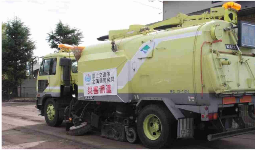
路面清掃車等による路面清掃作業 現地打合せ(福島県相馬市)