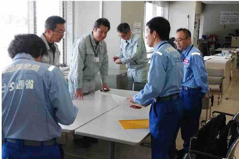
二本松市役所担当者との打合せ (福島県二本松市役所)