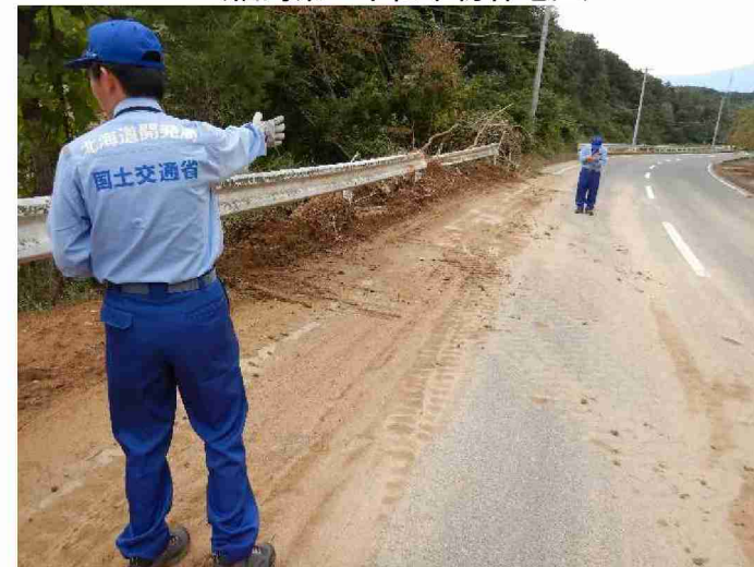
被災状況調査 (福島県二本松市初森地区)