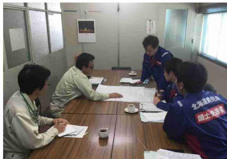
村田町へ被害状況調査報告書提出 (宮城県村田町)