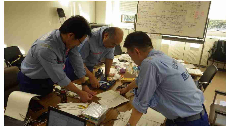
排水ポンプ車による排水作業打合せ (福島県郡山市)