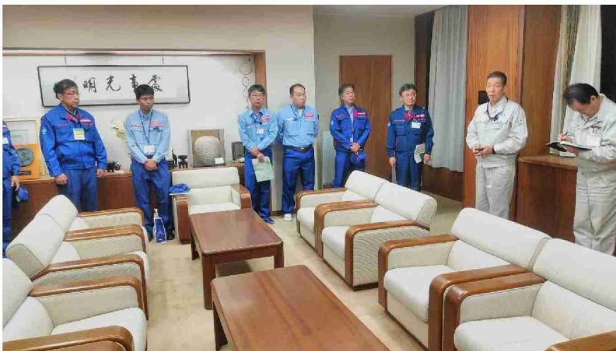
丸森町役場職員との打合せ (福島県丸森町役場)