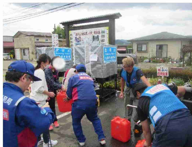
散水車(給水装置付)による給水支援 (宮城県丸森町 小斎まちづくりセンター)