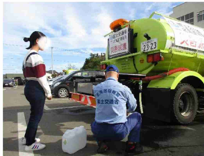
散水車(給水装置付)による給水支援 (宮城県丸森町 館矢間小学校)