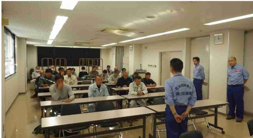
排水ポンプ車による排水作業打合せ (福島県郡山市)