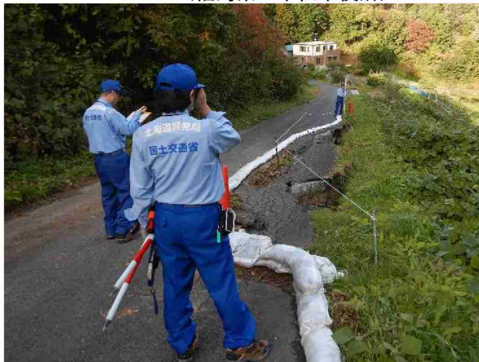
被災状況調査 (福島県二本松市初森地区)