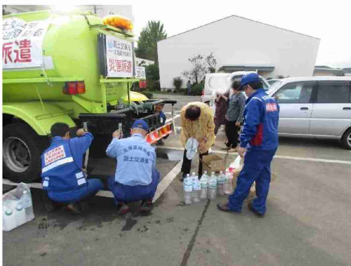
散水車(給水装置付)による給水支援 (宮城県丸森町 館矢間小学校)