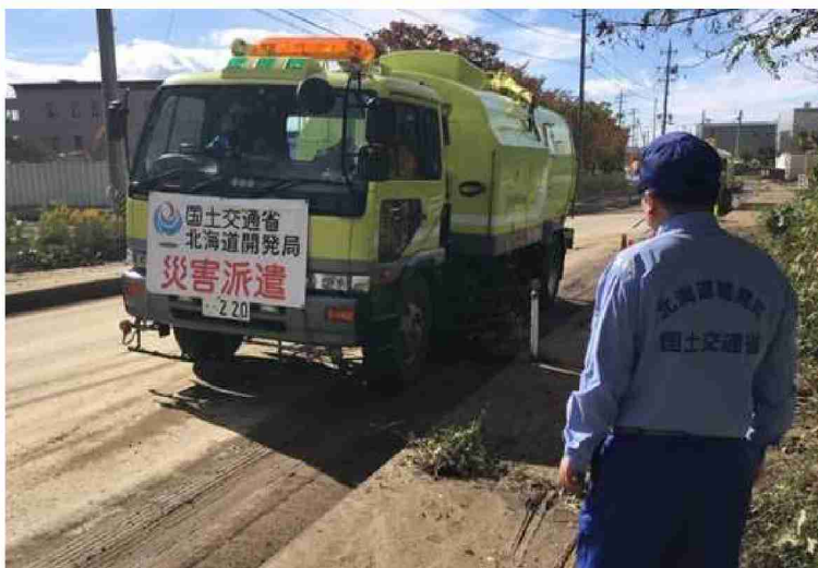
路面清掃車等による路面清掃作業 現地打合せ(福島県郡山市)