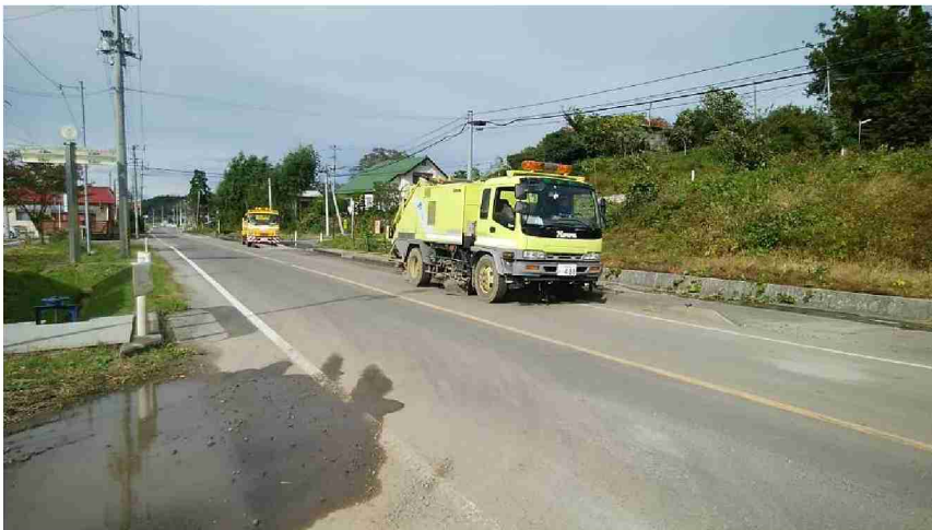
路面清掃車等による路面清掃作業 (宮城県丸森町)