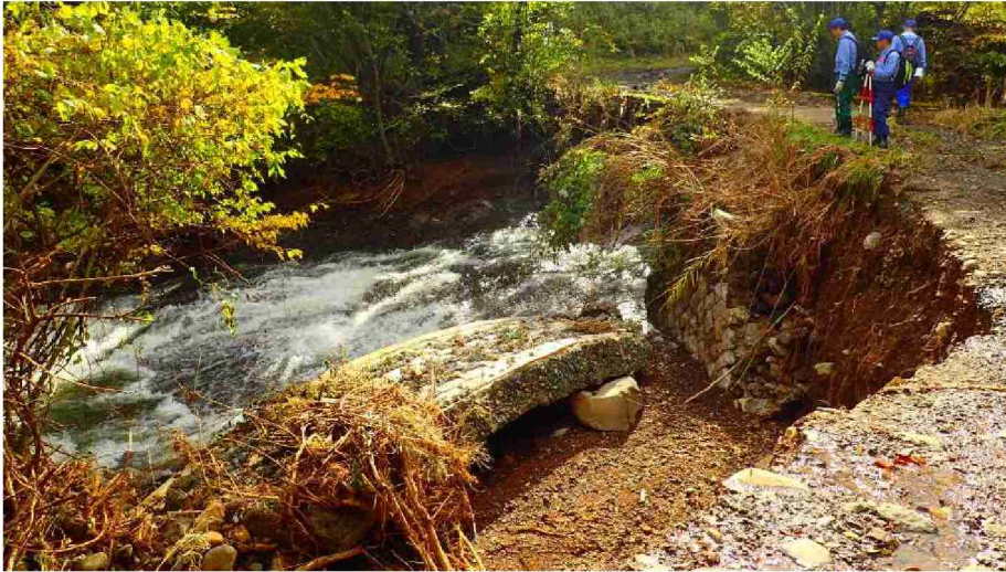
被災状況調査 (宮城県丸森町)