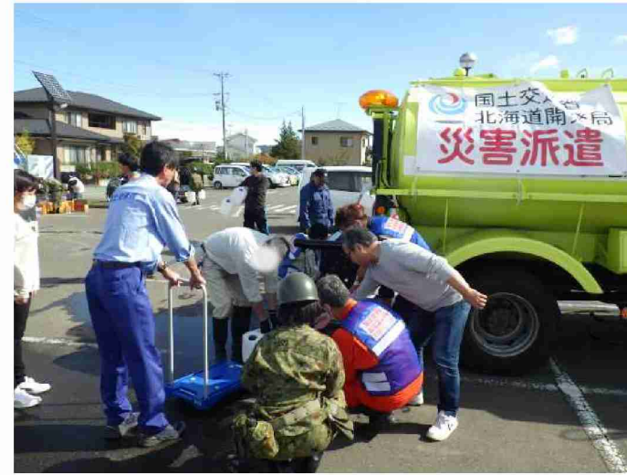
散水車(給水装置付)による給水支援 (宮城県丸森町館矢間まちづくりセンター)