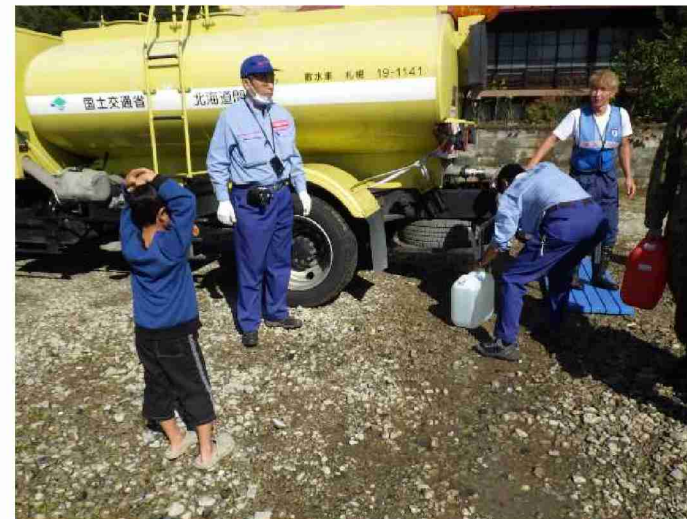
散水車(給水装置付)による給水支援 (宮城県丸森町観光案内所)