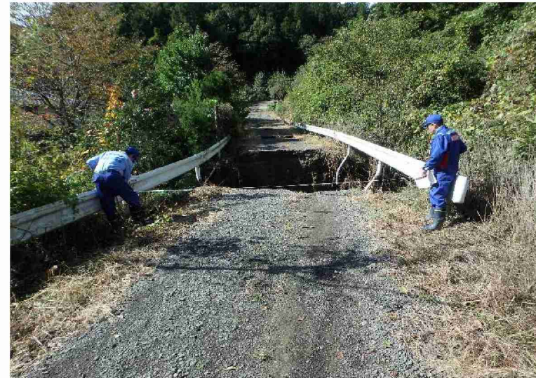
被災状況調査(河川被災箇所) (福島県伊達市)