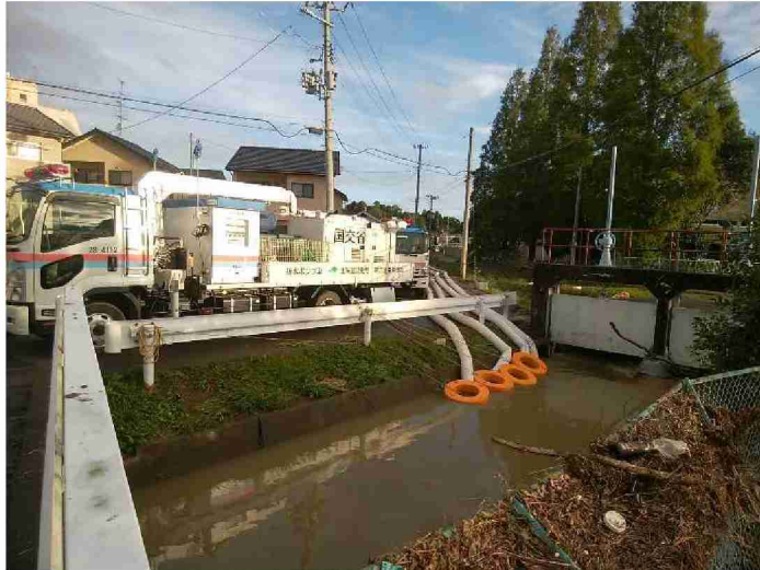
排水ポンプ車による排水作業 (福島県相馬市小泉排水機場)