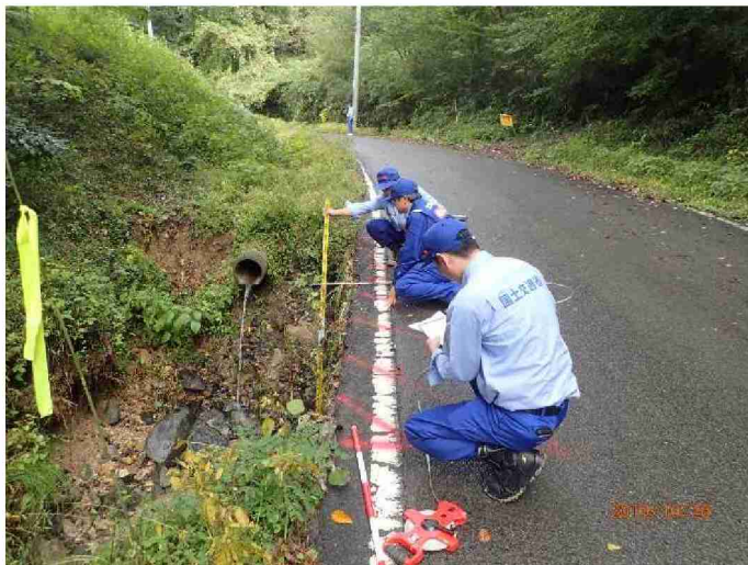
被災状況調査 (宮城県角田市)