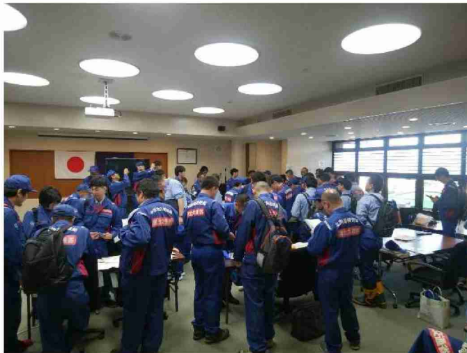
被災状況調査全体打合せ (宮城県丸森町役場)