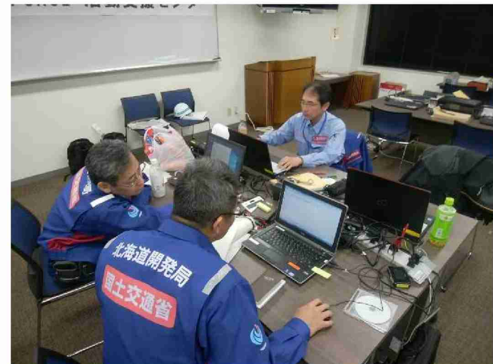
被害状況調査結果取りまとめ (東北地域づくり協会)