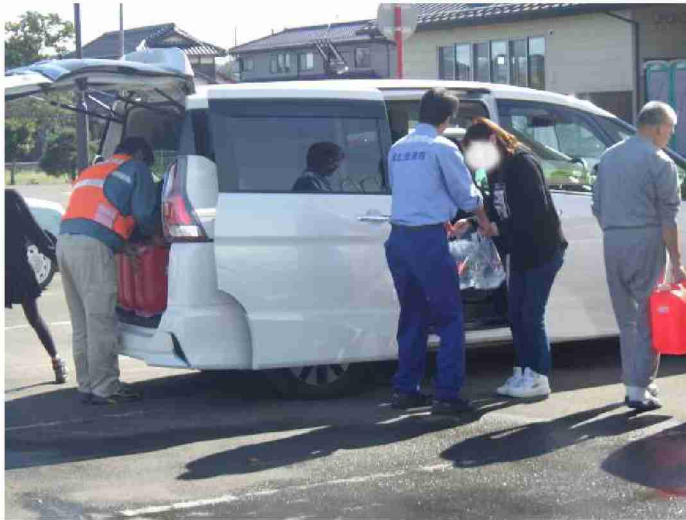
散水車(給水装置付)による給水支援 (宮城県丸森町館矢間まちづくりセンター)