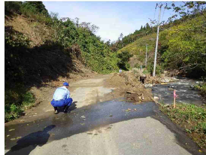
被災状況調査 (宮城県丸森町)