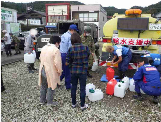
散水車(給水装置付)による給水支援 (宮城県丸森町観光案内所)