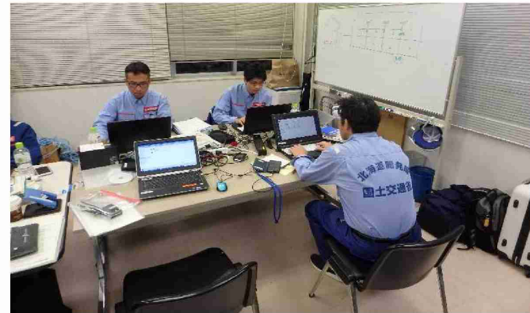
被害状況調査結果取りまとめ (福島河川国道事務所)