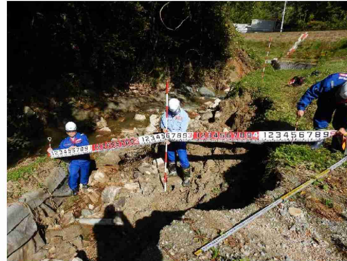
被災状況調査(河川被災箇所) (福島県郡山市・蛇石川)