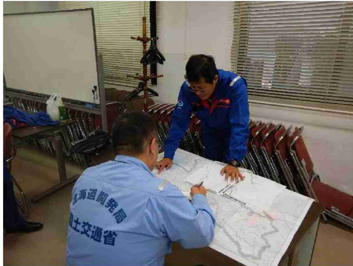
近畿地整との被災状況調査打合せ (郡山河川国道事務所)