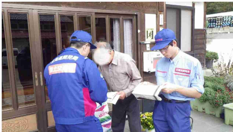
住民への聞き取り (福島県伊達市)