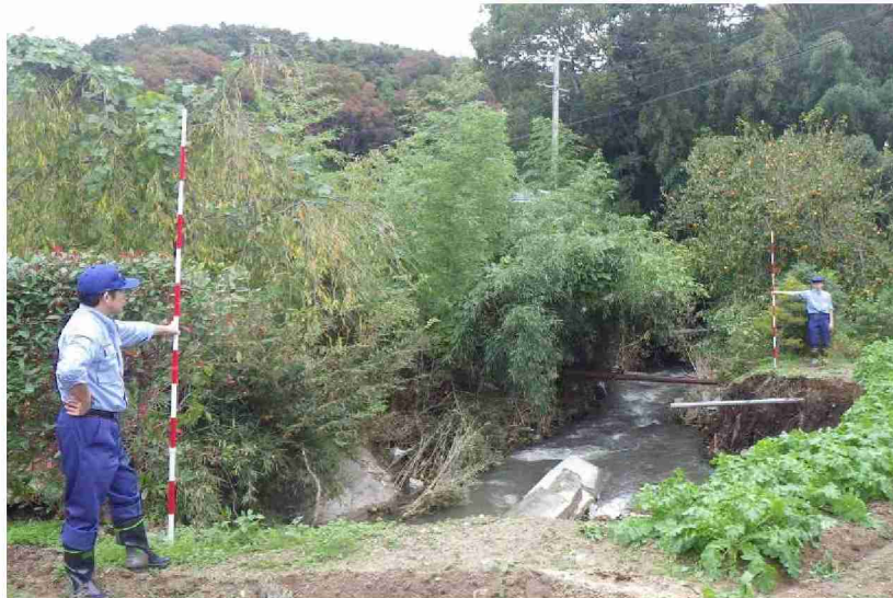
被災状況調査(河川被災箇所) (福島県伊達市)