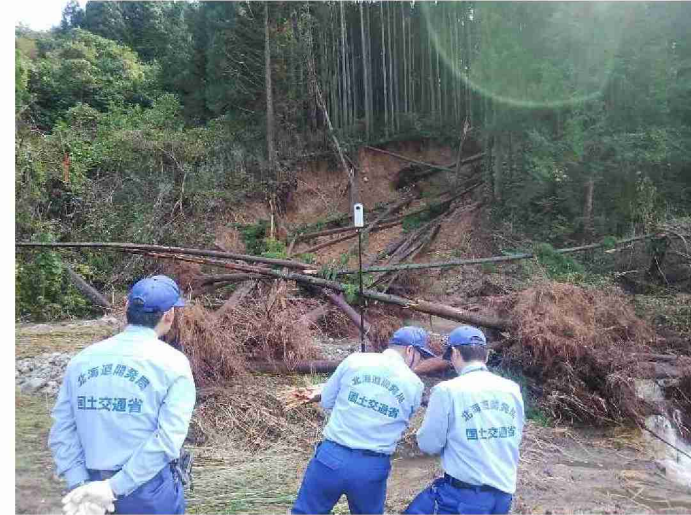
360°カメラによる被災状況撮影 (宮城県丸森町)