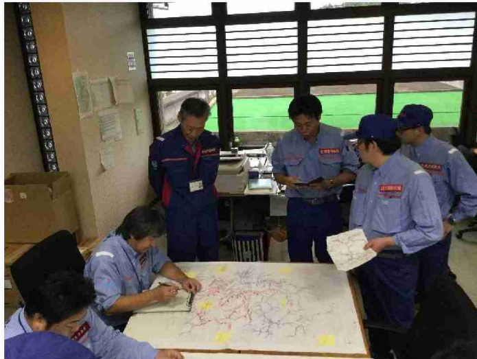
他地整被災状況調査班との打合せ (宮城県丸森町)