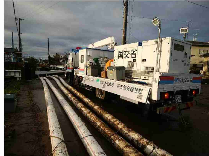
排水ポンプ車による排水作業 (福島県相馬市小泉排水機場)