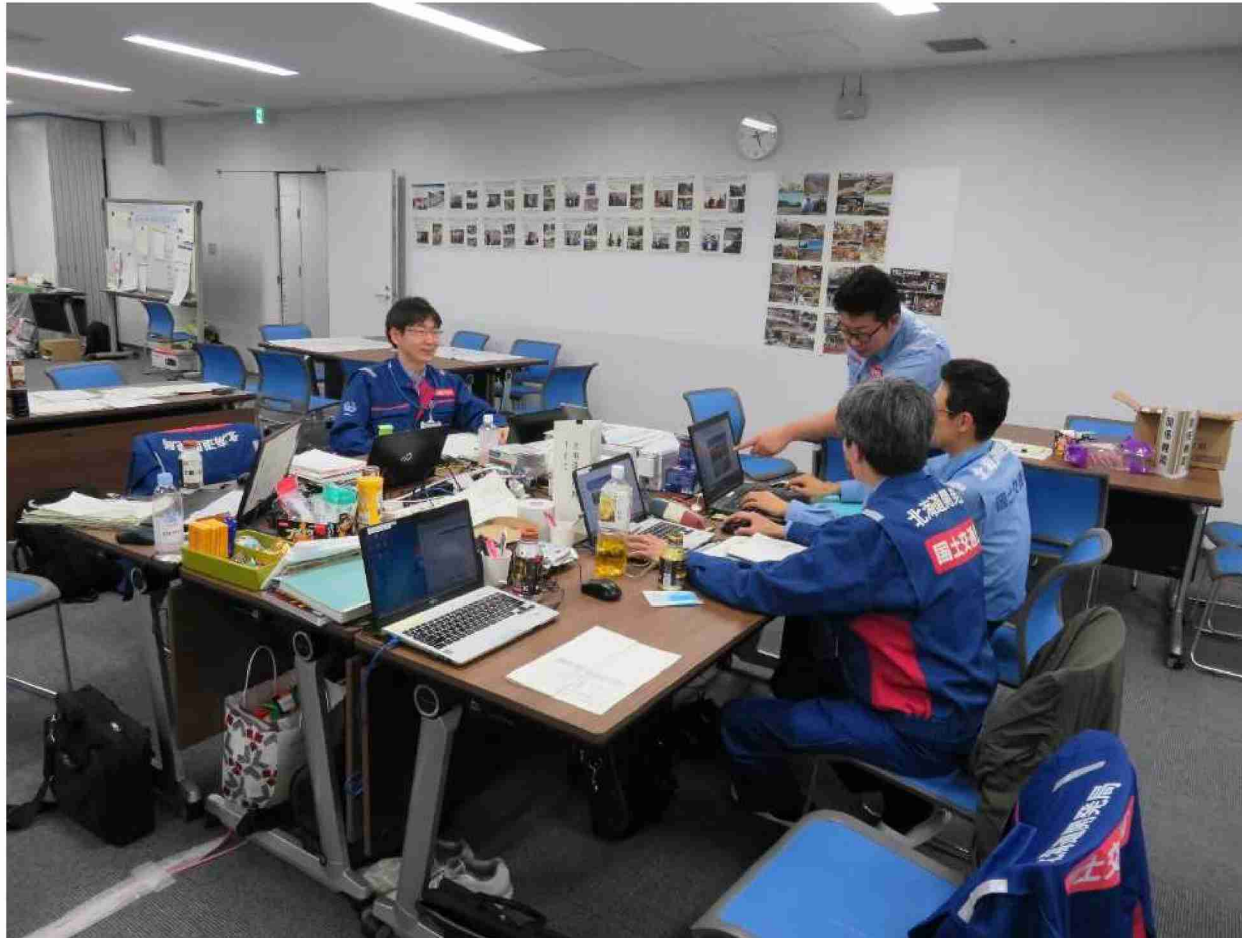
情報収集及び調整等作業 (東北地方整備局)