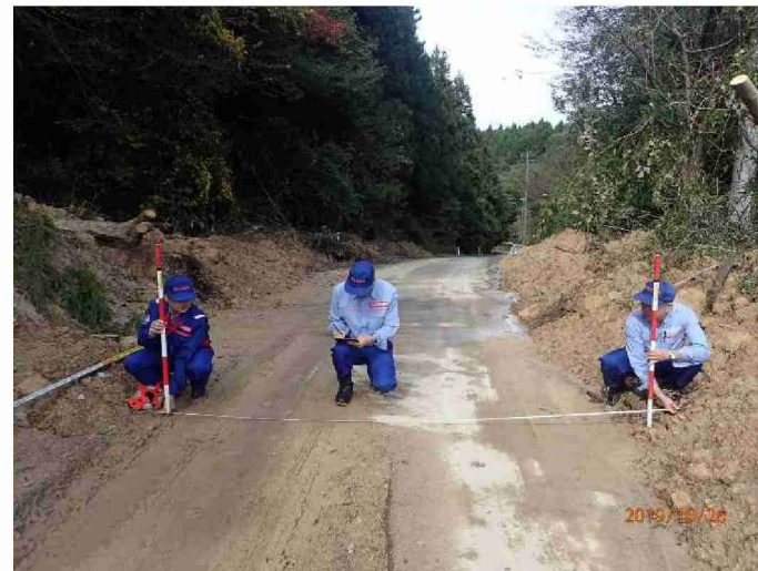
被災状況調査 (宮城県角田市)