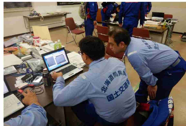
被害状況調査結果取りまとめ (郡山河川国道事務所)