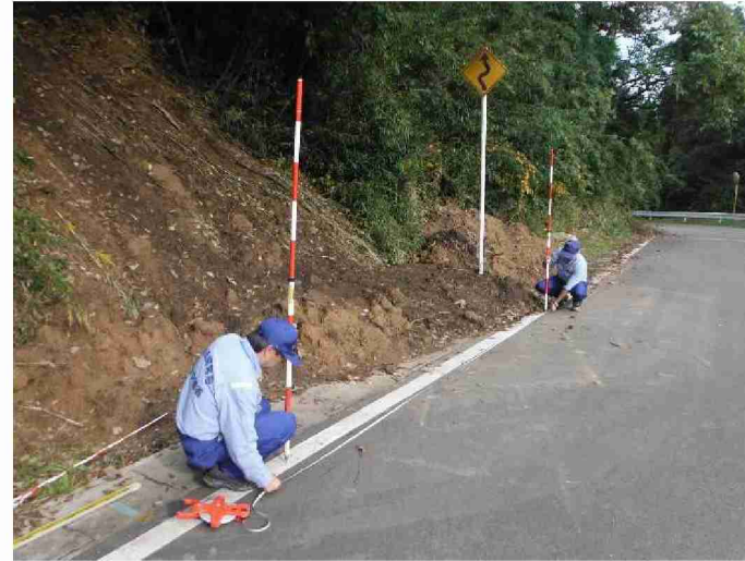
被災状況調査 (宮城県角田市)