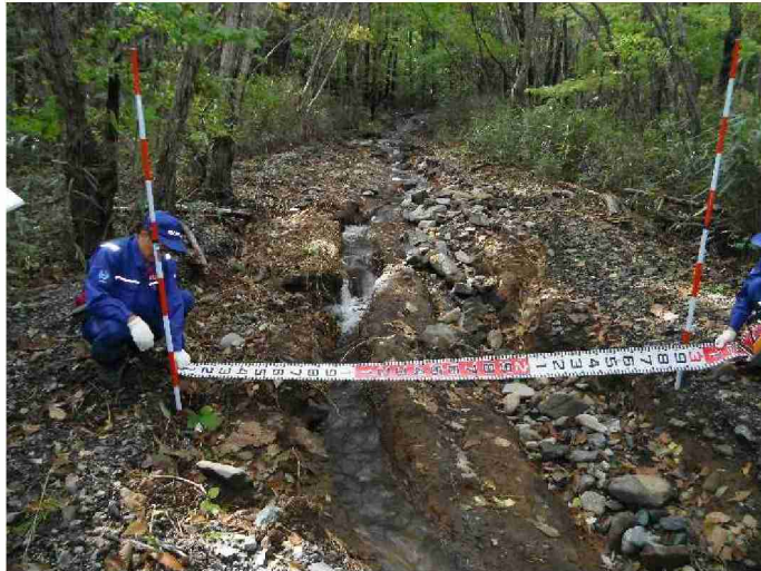
被災状況調査 (福島県相馬市)