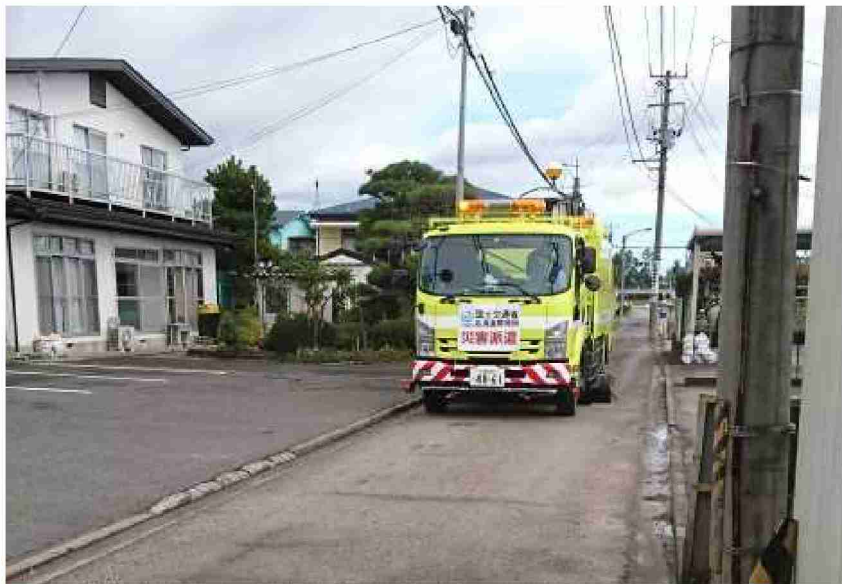
路面清掃車等による路面清掃作業 (福島県郡山市)