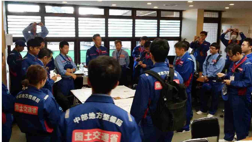
被災状況調査班全体打合せ (宮城県丸森町)