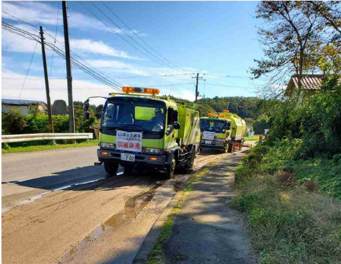
路面清掃車等による路面清掃作業 (宮城県角田市)