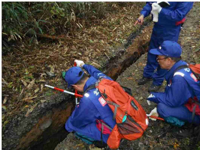
被災状況調査 (福島県相馬市)