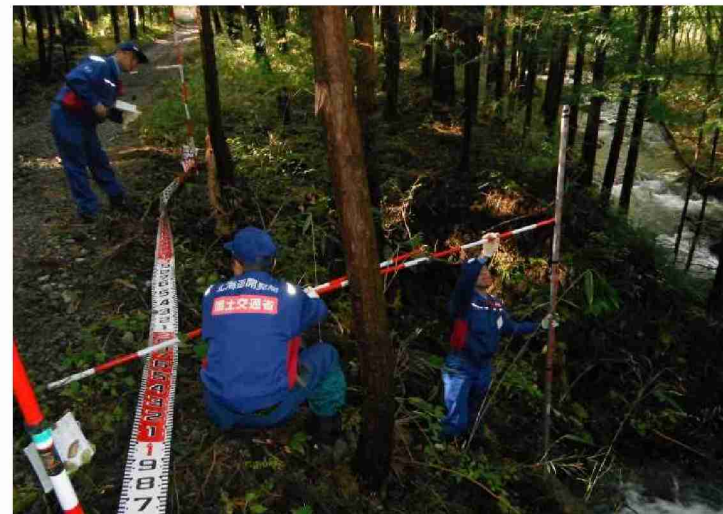
被災状況調査 (福島県相馬市)