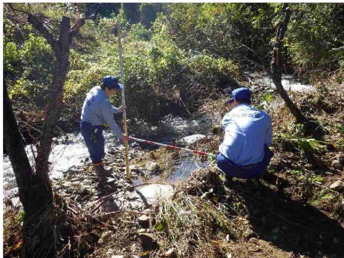
被災状況調査 (宮城県丸森町)