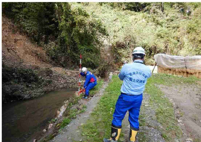
被災状況調査(河川被災箇所) (福島県郡山市・蛇石川)