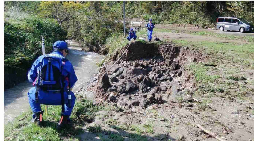
被災状況調査 (宮城県丸森町)