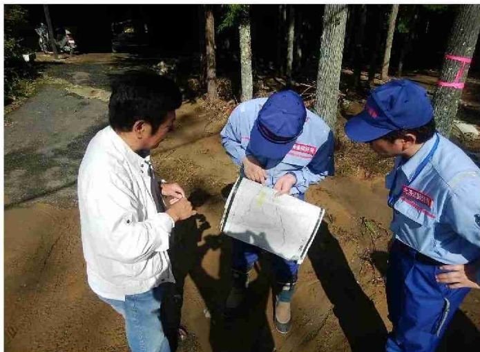
住民への聞き取り (宮城県丸森町)