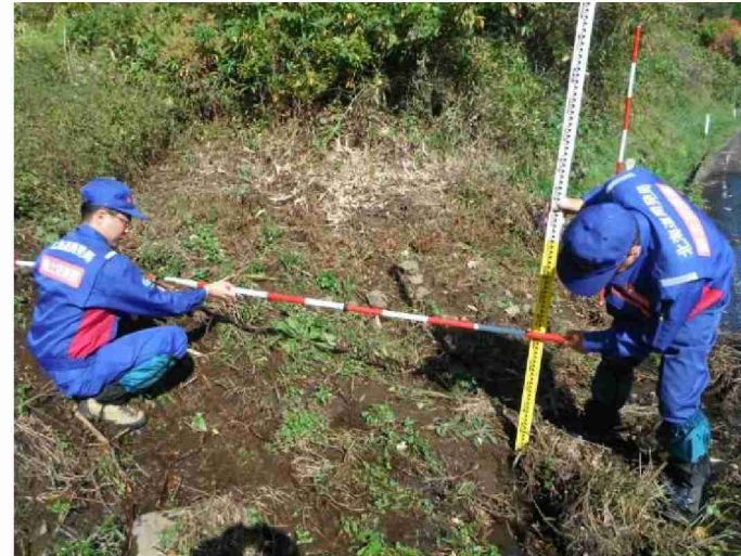
被災状況調査 (福島県相馬市)