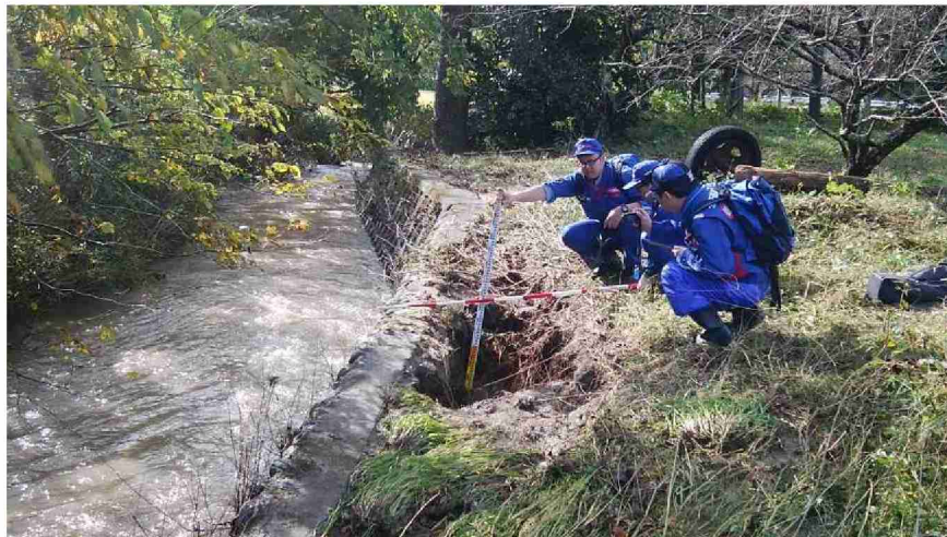
被災状況調査 (宮城県丸森町)