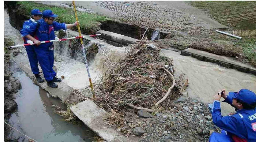
被災状況調査 (宮城県丸森町)