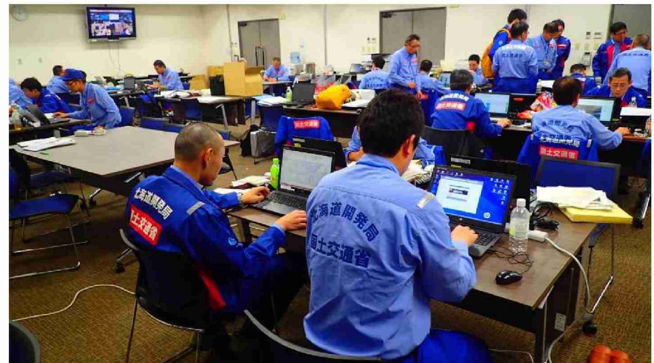
被害状況調査報告書作成作業 (東北地域づくり協会)