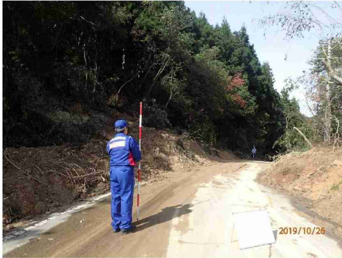
被災状況調査 (宮城県角田市)