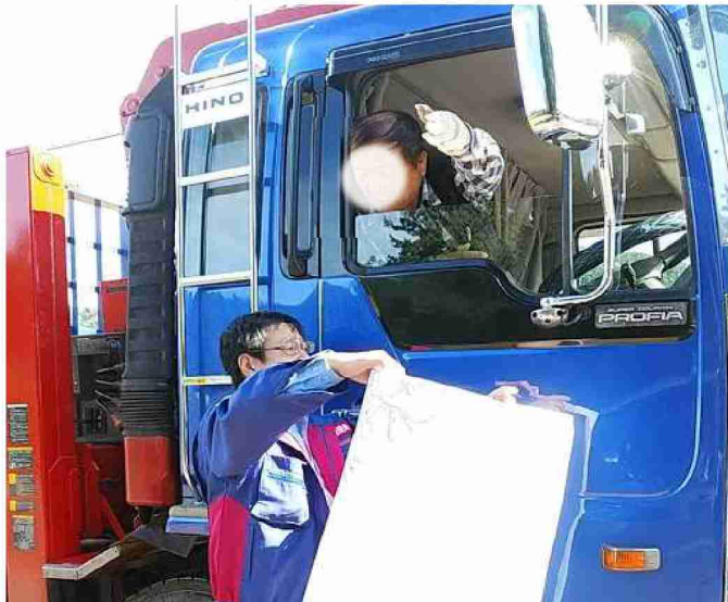
住民への聞き取り (宮城県丸森町)