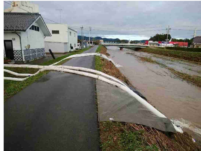
排水ポンプ車による排水作業 (福島県相馬市小泉排水機場)