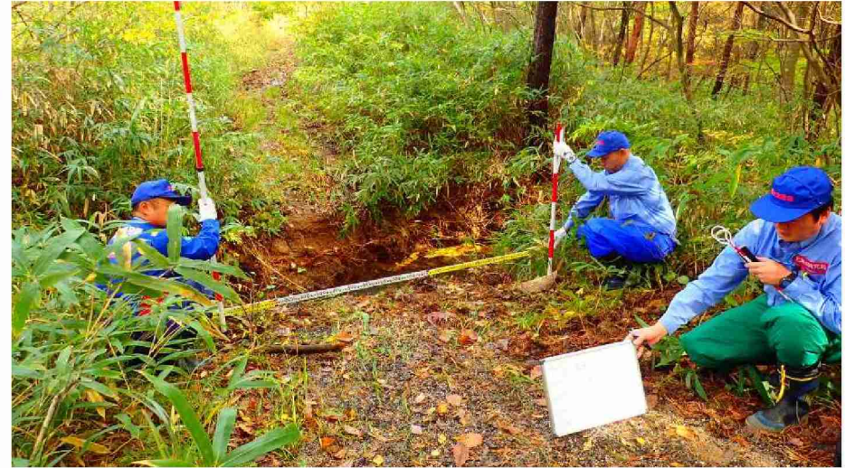
被災状況調査 (宮城県丸森町)