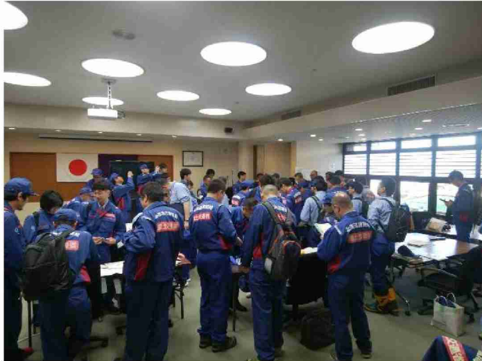
被災状況調査全体打合せ (宮城県丸森町役場)