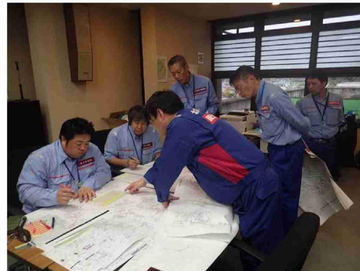
東北地整に被害状況調査結果報告 (宮城県丸森町役場)