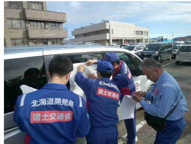
被災状況調査打合せ (宮城県丸森町)