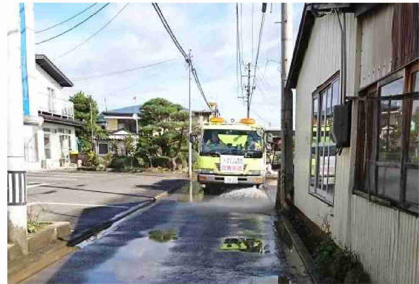
路面清掃車等による路面清掃作業 (福島県郡山市)