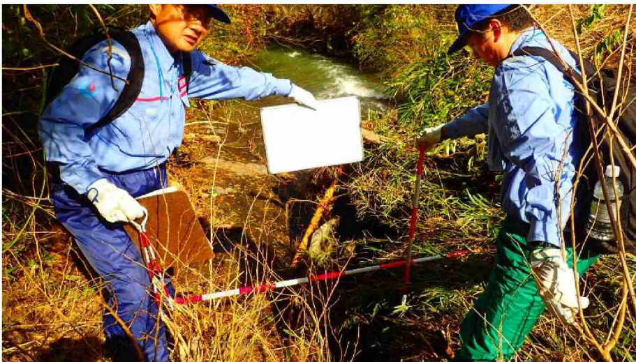
被災状況調査 (宮城県丸森町)