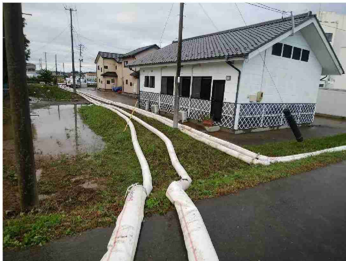
排水ポンプ車による排水作業 (福島県相馬市小泉排水機場)