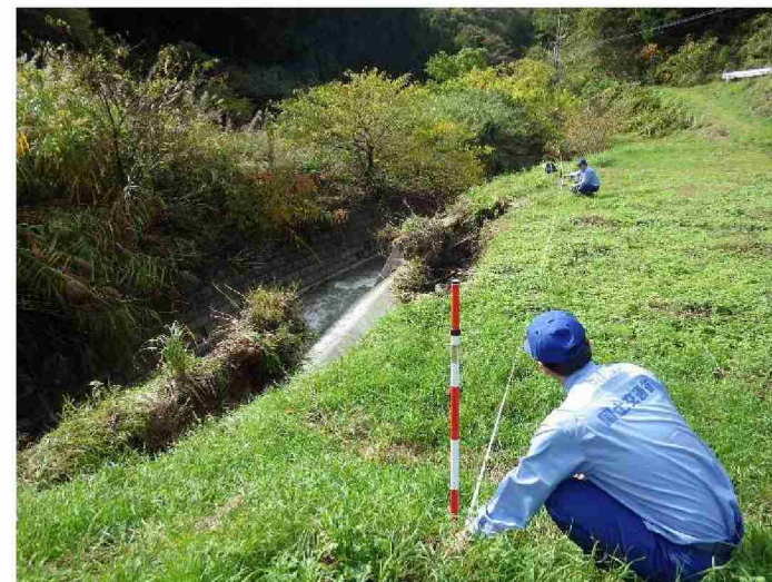
被災状況調査 (宮城県丸森町)