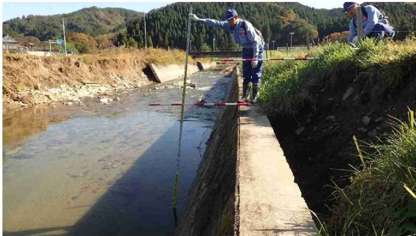
被災状況調査 (宮城県丸森町)