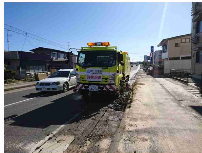
路面清掃車等による路面清掃 (福島県郡山市)