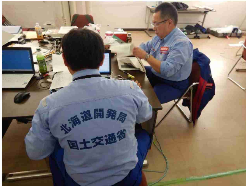
被害状況調査報告書作成作業 (郡山河川国道事務所)