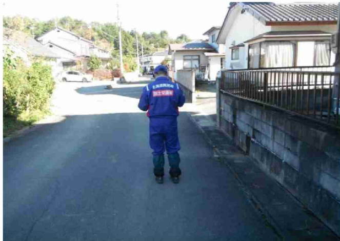
被災状況調査 (福島県相馬市)