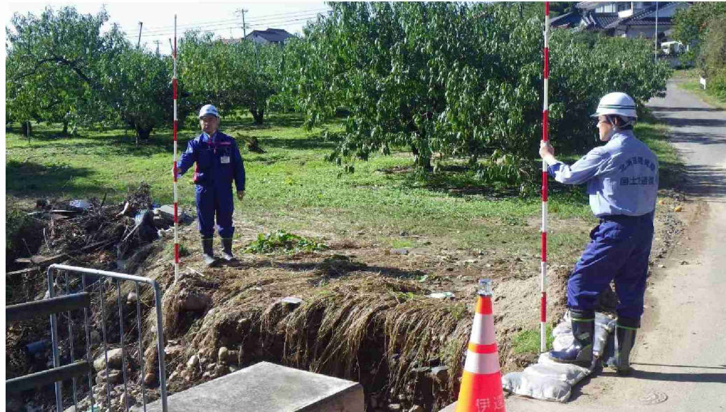
被災状況調査(河川被災箇所) (福島県伊達市)