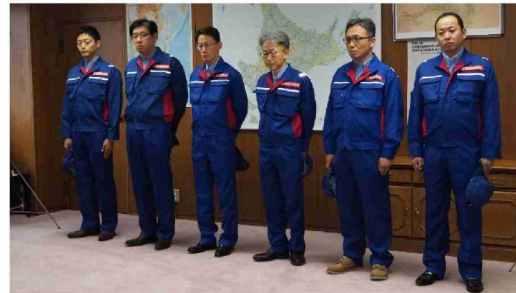
総括班、応急対策班(1班)第4陣出発式