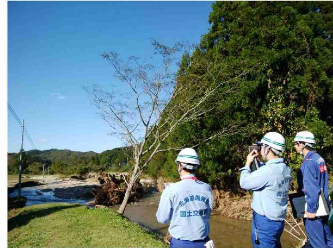
被災状況調査(河川被災箇所・再調査) (宮城県丸森町)