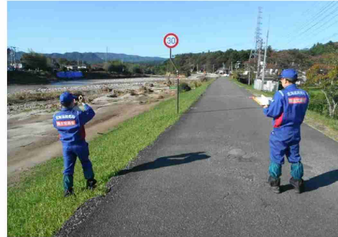
被災状況調査 (福島県相馬市)