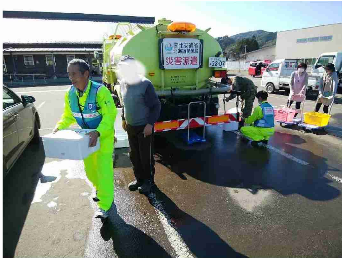
散水車(給水装置付)による給水支援 (宮城県丸森町館矢間まちづくりセンター)