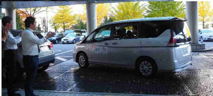
総括班第4陣が出発