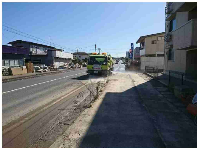
路面清掃車等による路面清掃 (福島県郡山市)