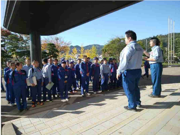
被災調査班全体打合せ(道路1、2、4、6班を含む) (宮城県丸森町)