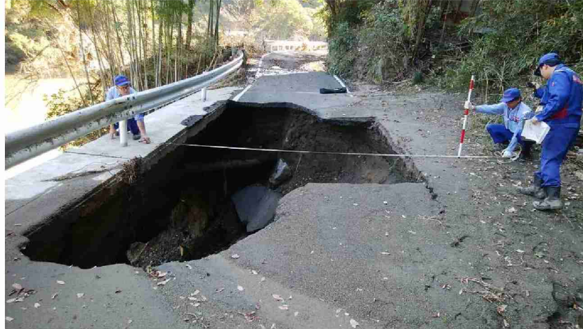
被災状況調査 (宮城県丸森町)