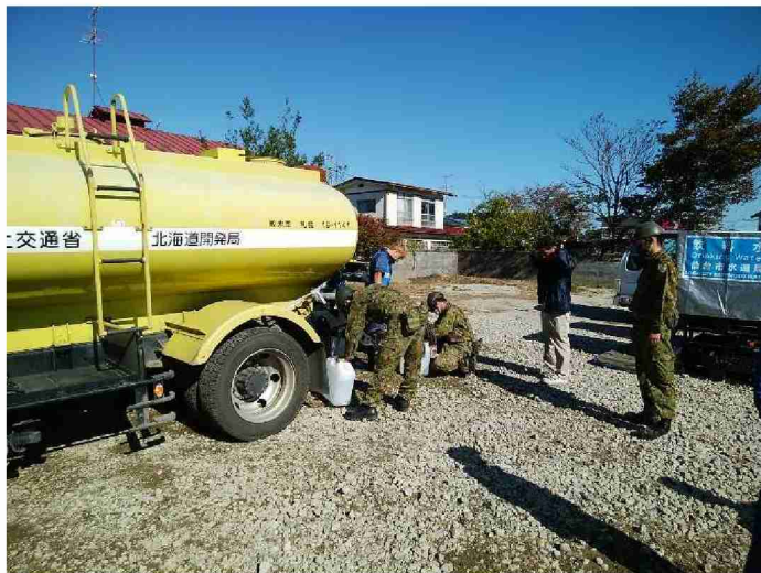
散水車(給水装置付)による給水支援 (宮城県丸森町観光案内所)