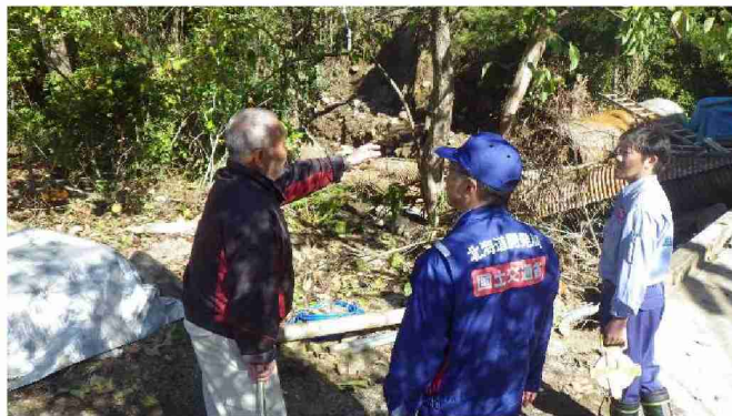
住民への聞き取り (福島県伊達市)