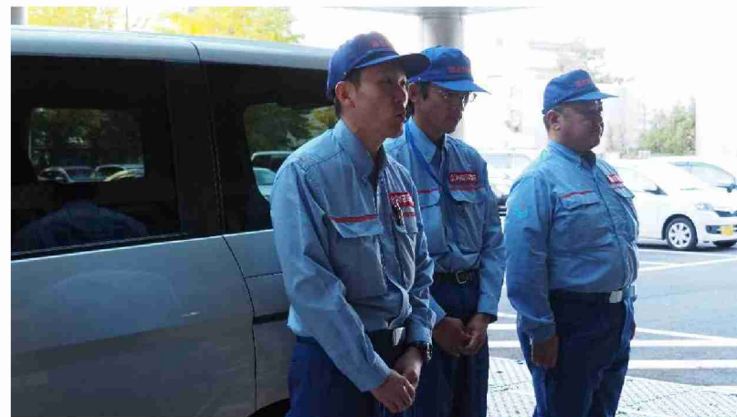
応急対策班(1班)が帰陣