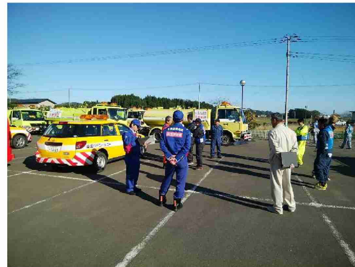
給水支援に関する打合せ (宮城県丸森町館矢間まちづくりセンター)