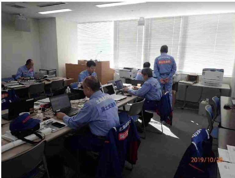
被害状況調査報告書作成作業 (仙台河川国道事務所)