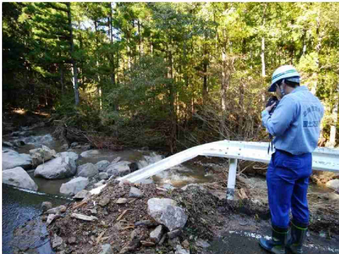
被災状況調査(河川被災箇所) (宮城県丸森町)