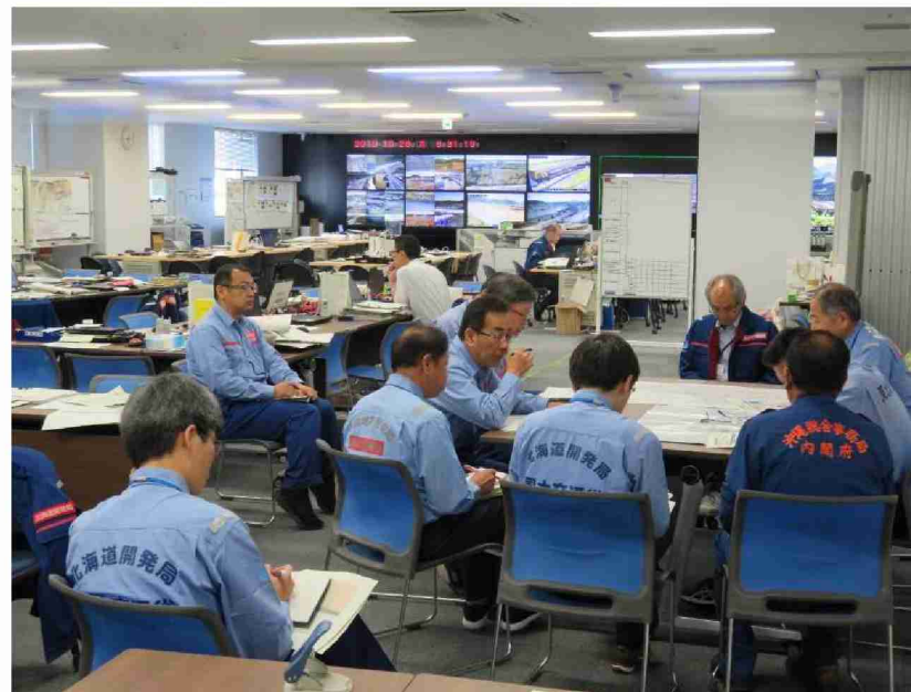
全地整隊長会議(総括班第3陣) (東北地方整備局)