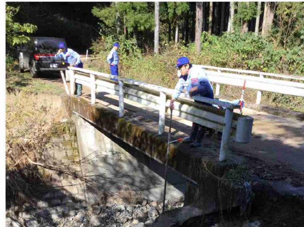
被災状況調査 (宮城県丸森町)