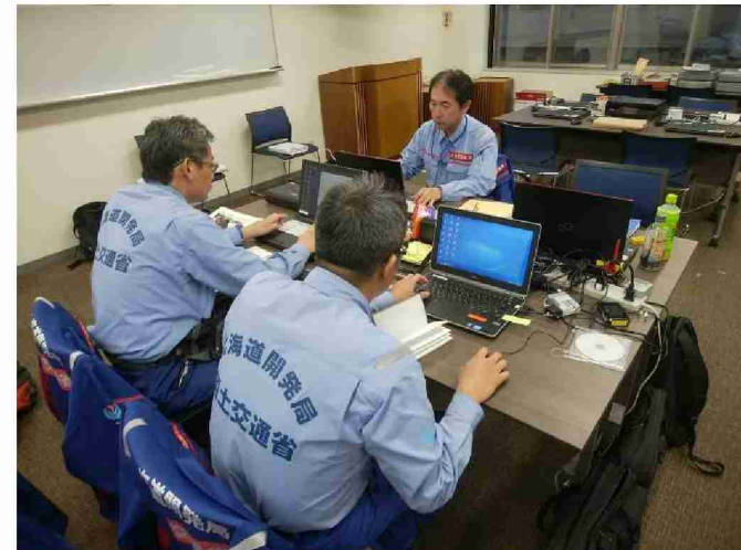
被害状況調査結果取りまとめ (東北地域づくり協会)