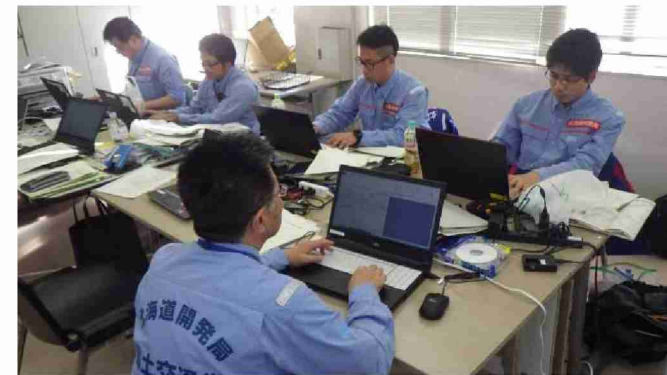
被害状況調査結果取りまとめ (福島河川国道事務所)