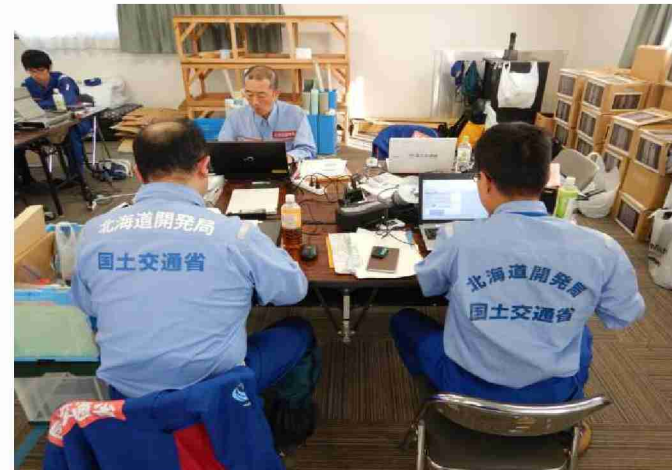
被害状況調査報告書作成作業 (相馬市役所)