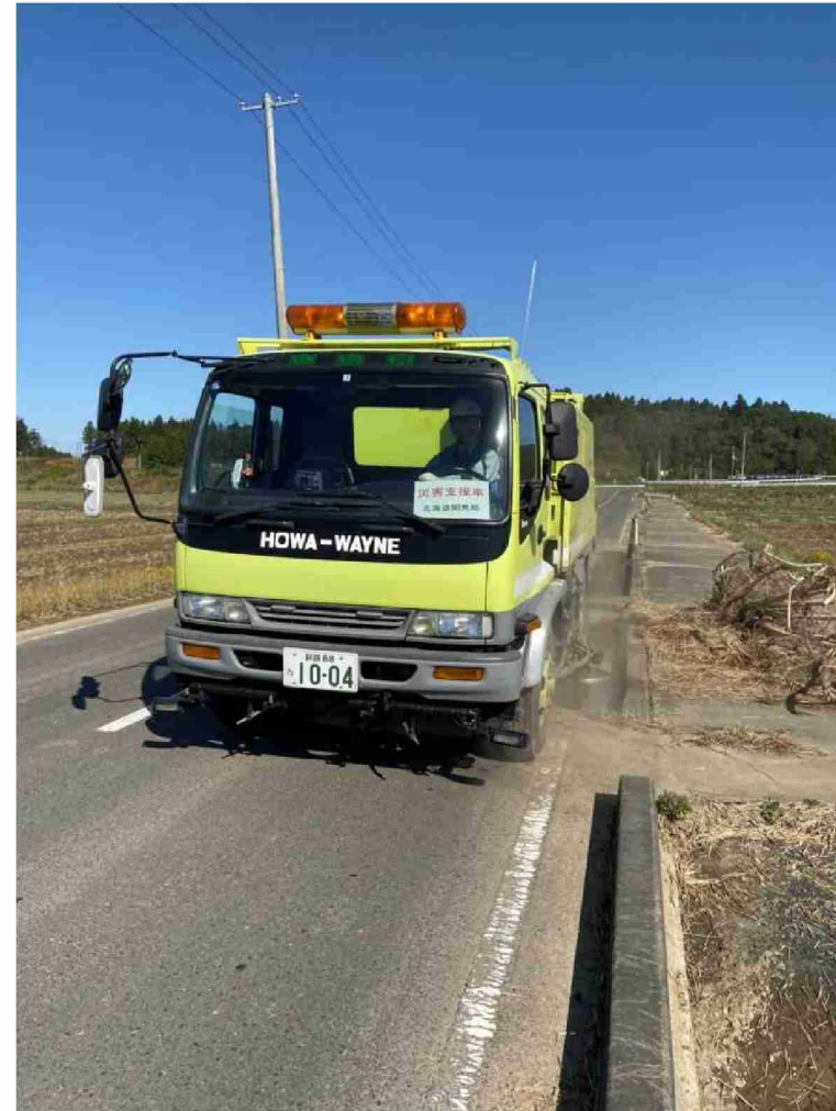
路面清掃車等による路面清掃 (宮城県角田市)