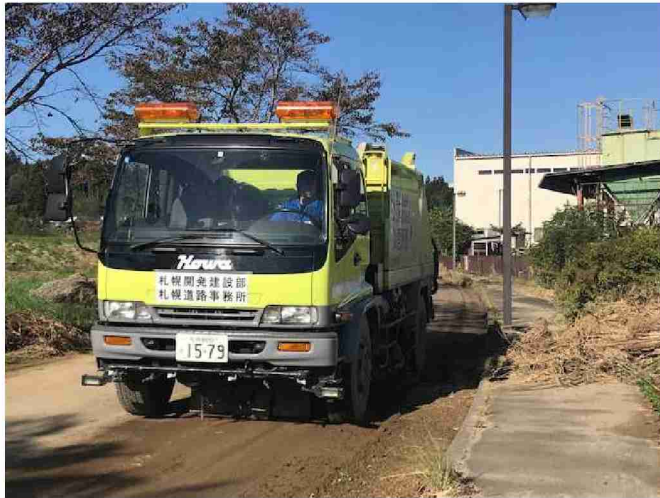
路面清掃車等による路面清掃 (宮城県丸森町)