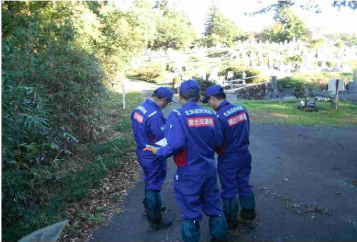
被災状況調査 (福島県相馬市)