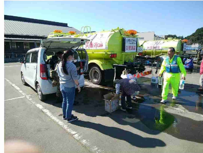
散水車(給水装置付)による給水支援 (宮城県丸森町館矢間まちづくりセンター)