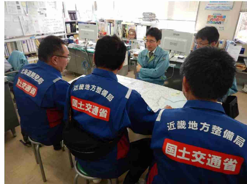
被害状況調査報告書に関する打合せ (郡山市役所)