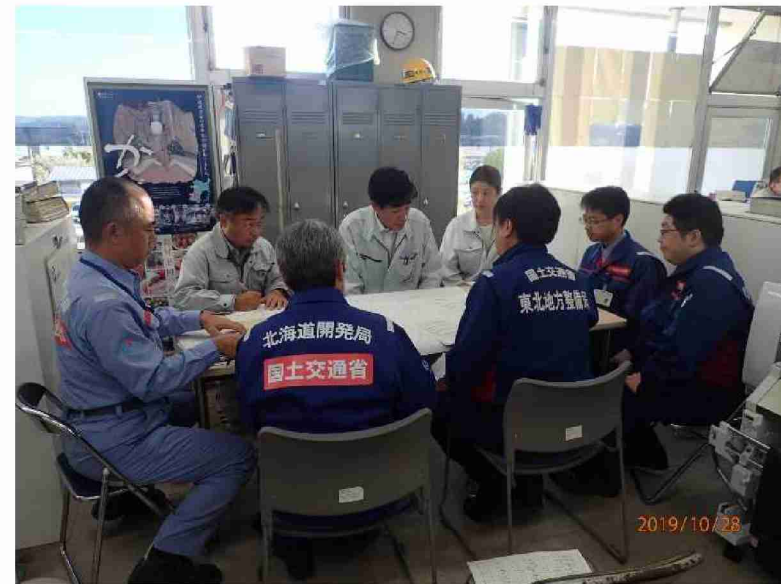
被害状況調査報告書に関する打合せ (角田市役所)