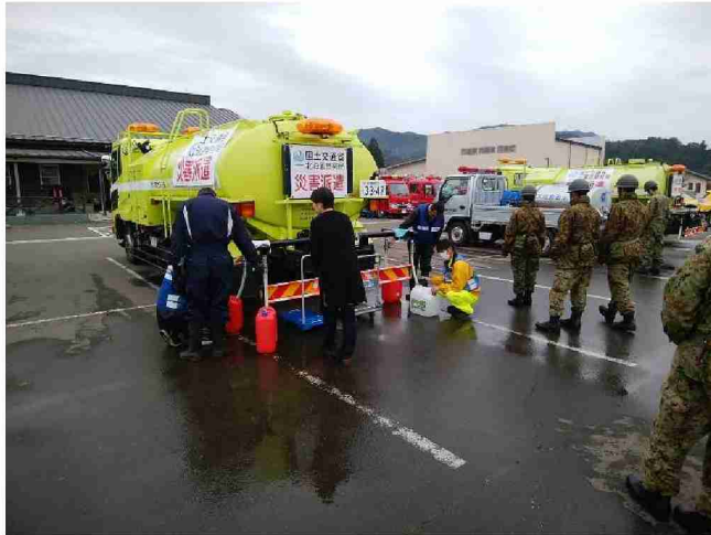
散水車(給水装置付)による給水支援 (宮城県丸森町館矢間まちづくりセンター)