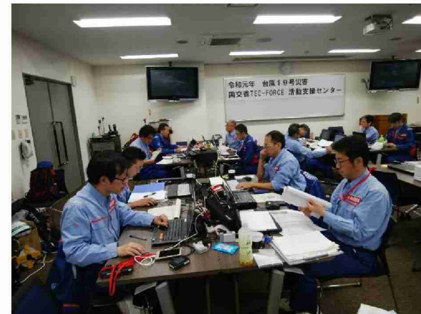
被害状況調査結果取りまとめ (東北地域づくり協会)