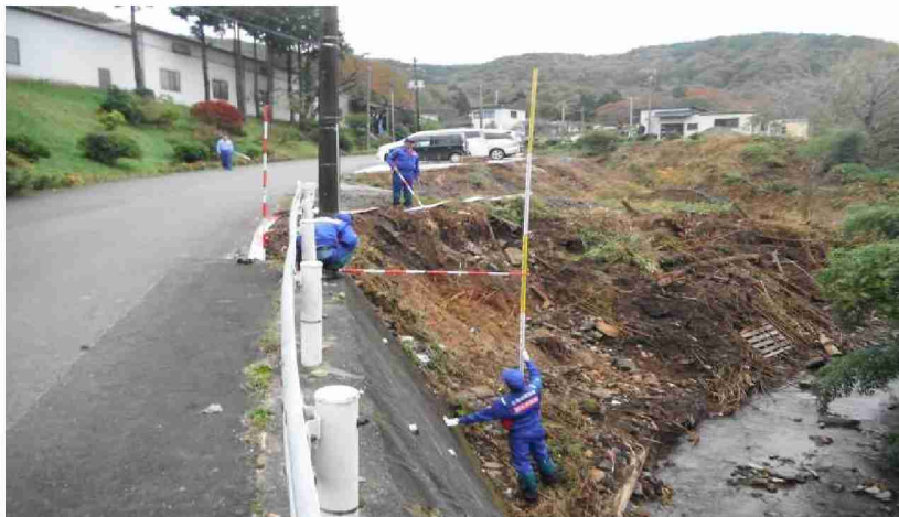
被災状況調査 (宮城県丸森町)