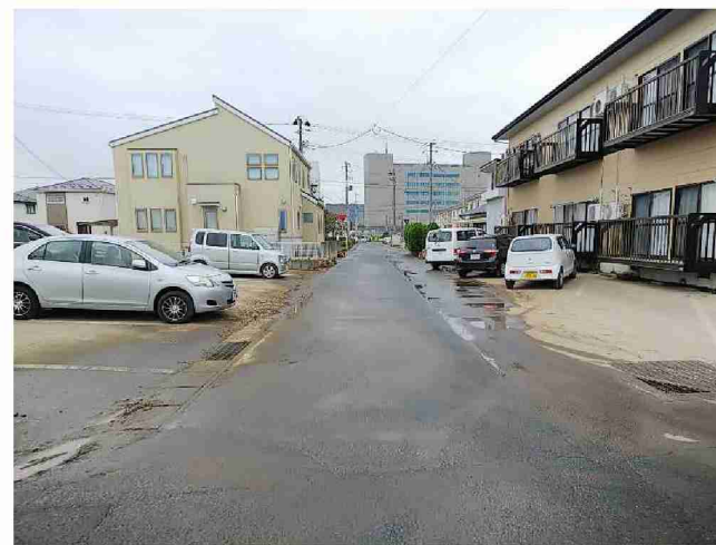
側溝清掃車による側溝清掃作業 (福島県相馬市)