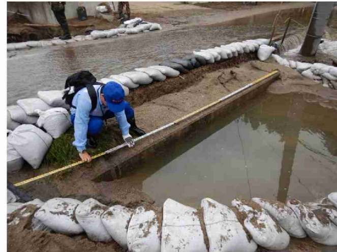
被災状況調査 (宮城県丸森町)