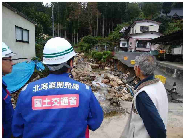
住民への聞き取り(鬼形川被災箇所) (宮城県丸森町)