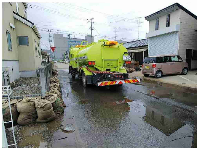
路面清掃車等による路面清掃 (福島県相馬市)