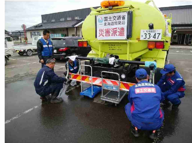
散水車(給水装置付)による給水支援 (宮城県丸森町館矢間まちづくりセンター)