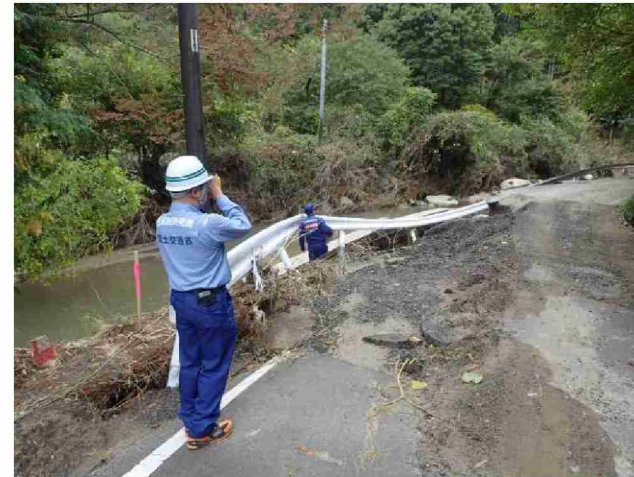
被災状況調査 (宮城県丸森町)