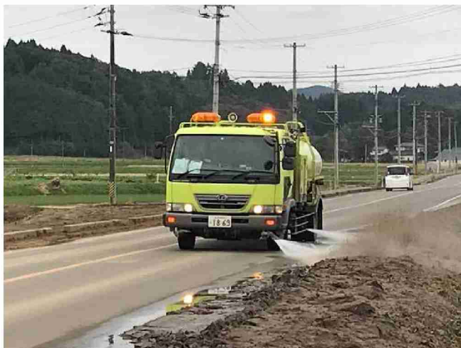
路面清掃車等による路面清掃 (宮城県丸森町)