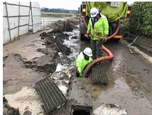
側溝清掃車による側溝清掃作業 (宮城県丸森町)