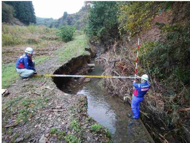
被災状況調査(熊ノ入川) (宮城県丸森町)