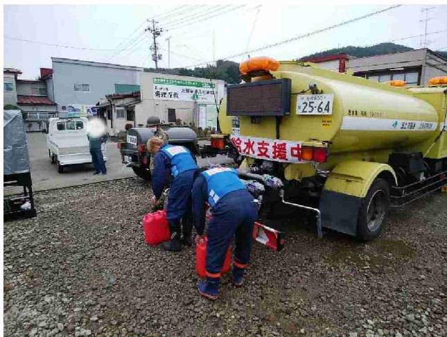
散水車(給水装置付)による給水支援 (宮城県丸森町観光案内所)