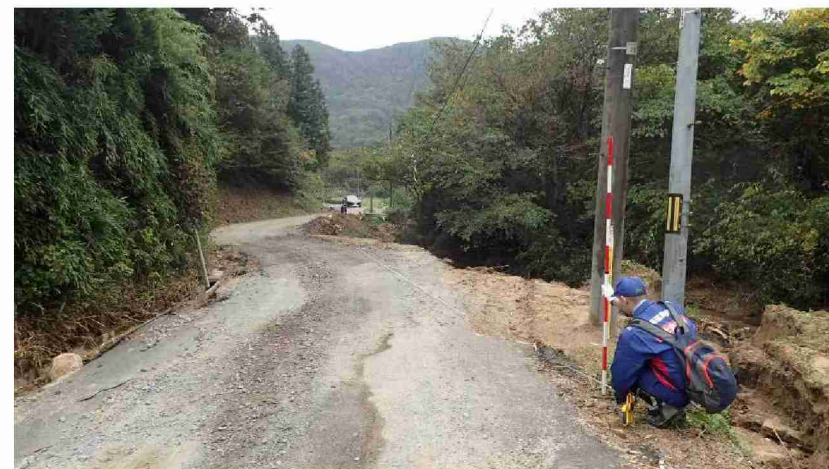
被災状況調査 (宮城県丸森町)