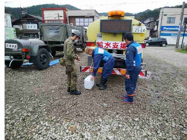
散水車(給水装置付)による給水支援 (宮城県丸森町館矢間まちづくりセンター)