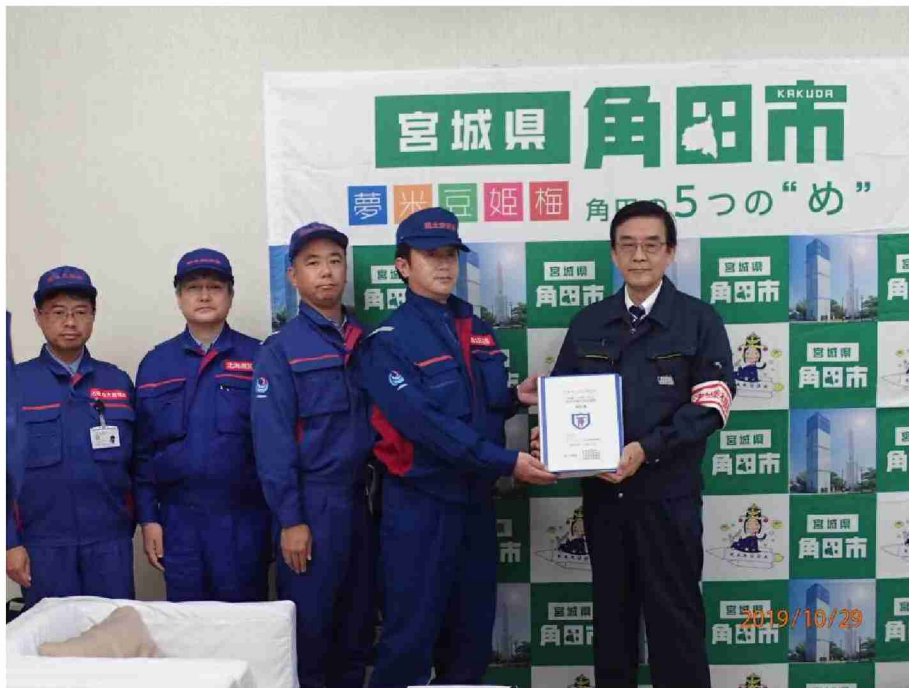
角田市へ被害状況調査報告書提出 (宮城県角田市)