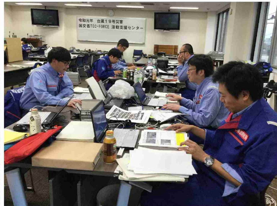
被害状況調査報告書作成作業 (東北地域づくり協会)