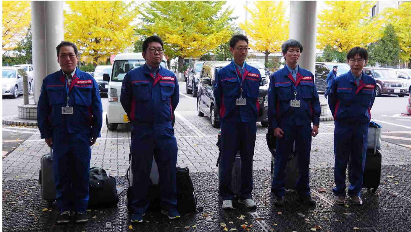
総括班第3陣が帰陣