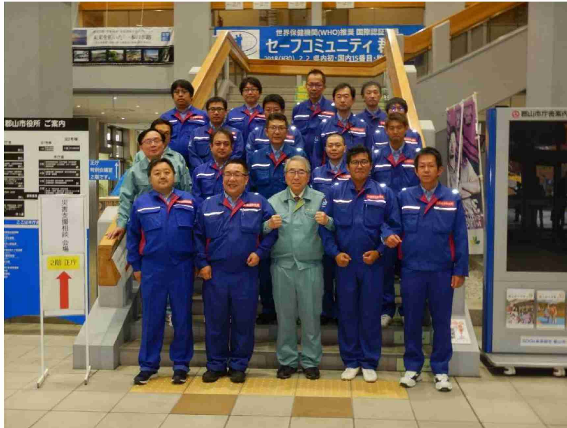
郡山市へ被害状況調査報告書提出 (福島県郡山市) 北海道開発局・近畿地方整備局合同