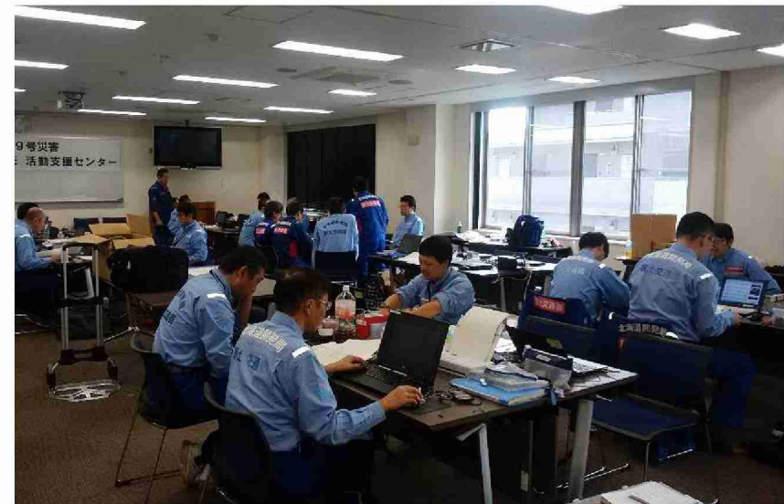
被害状況調査報告書作成作業 (東北地域づくり協会)