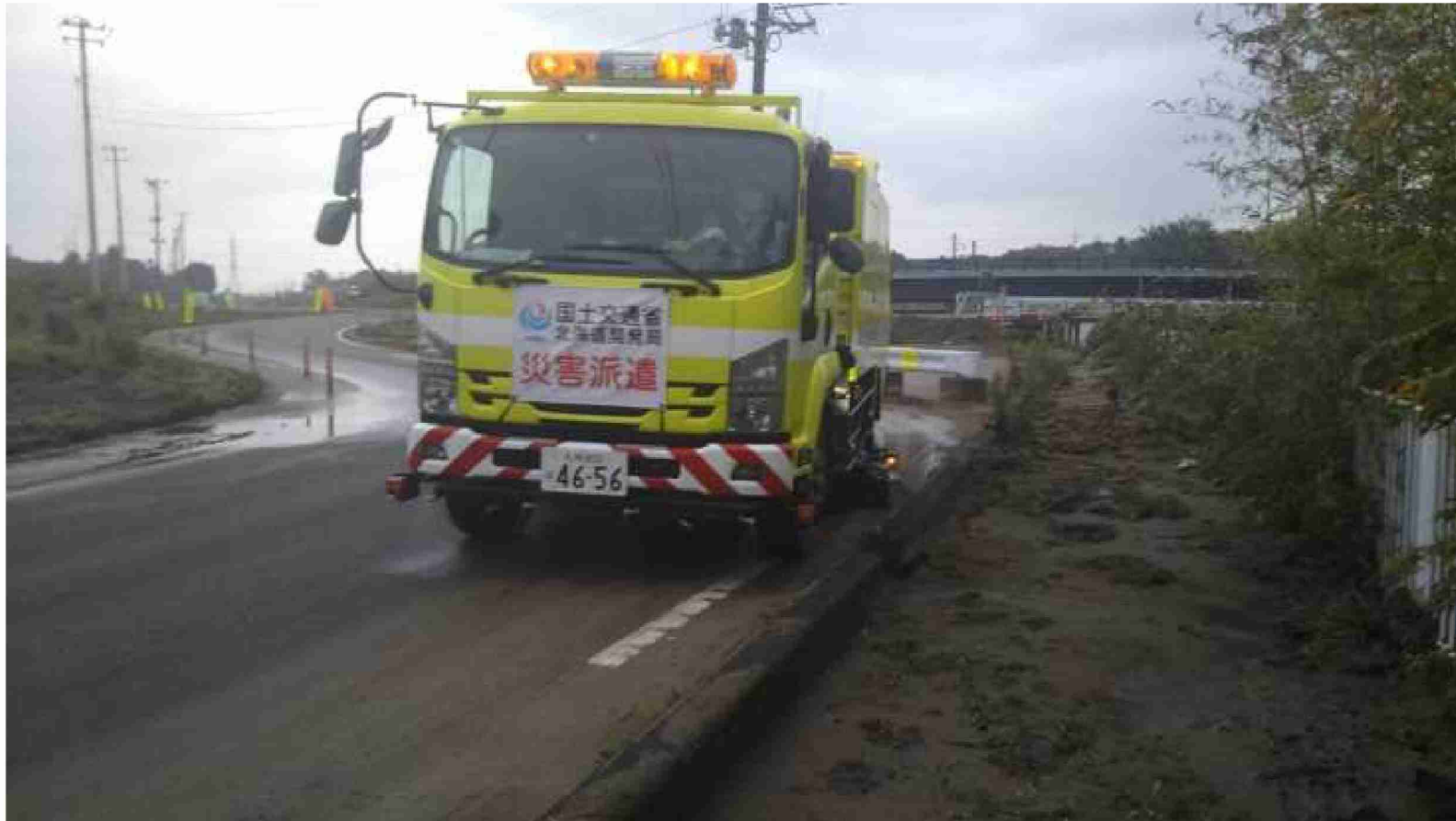
路面清掃車による路面清掃作業 (福島県須賀川市)