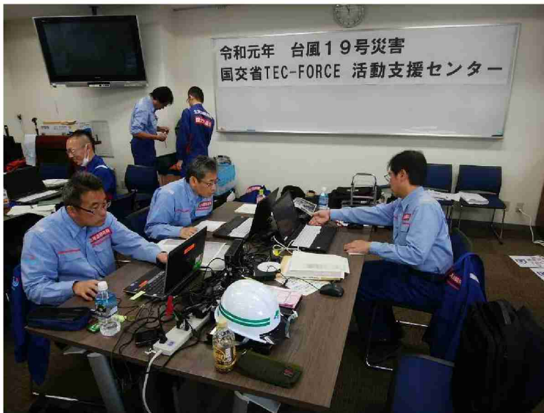
被害状況調査報告書作成作業 (東北地域づくり協会)