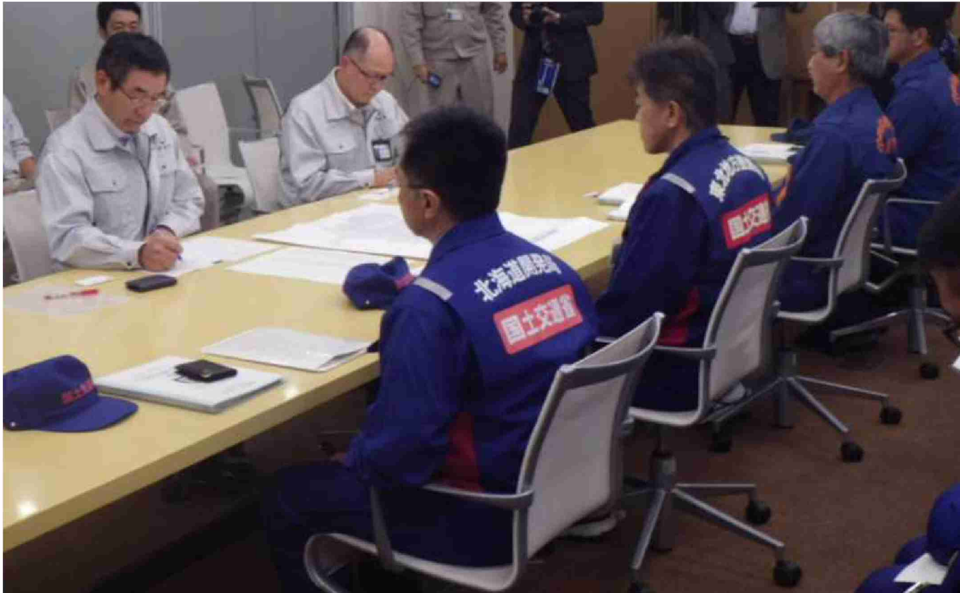
伊達市へ被害状況調査報告書提出 (福島県伊達市)