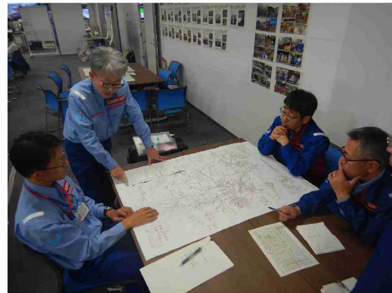
総括班との打合せ (東北地整本部)