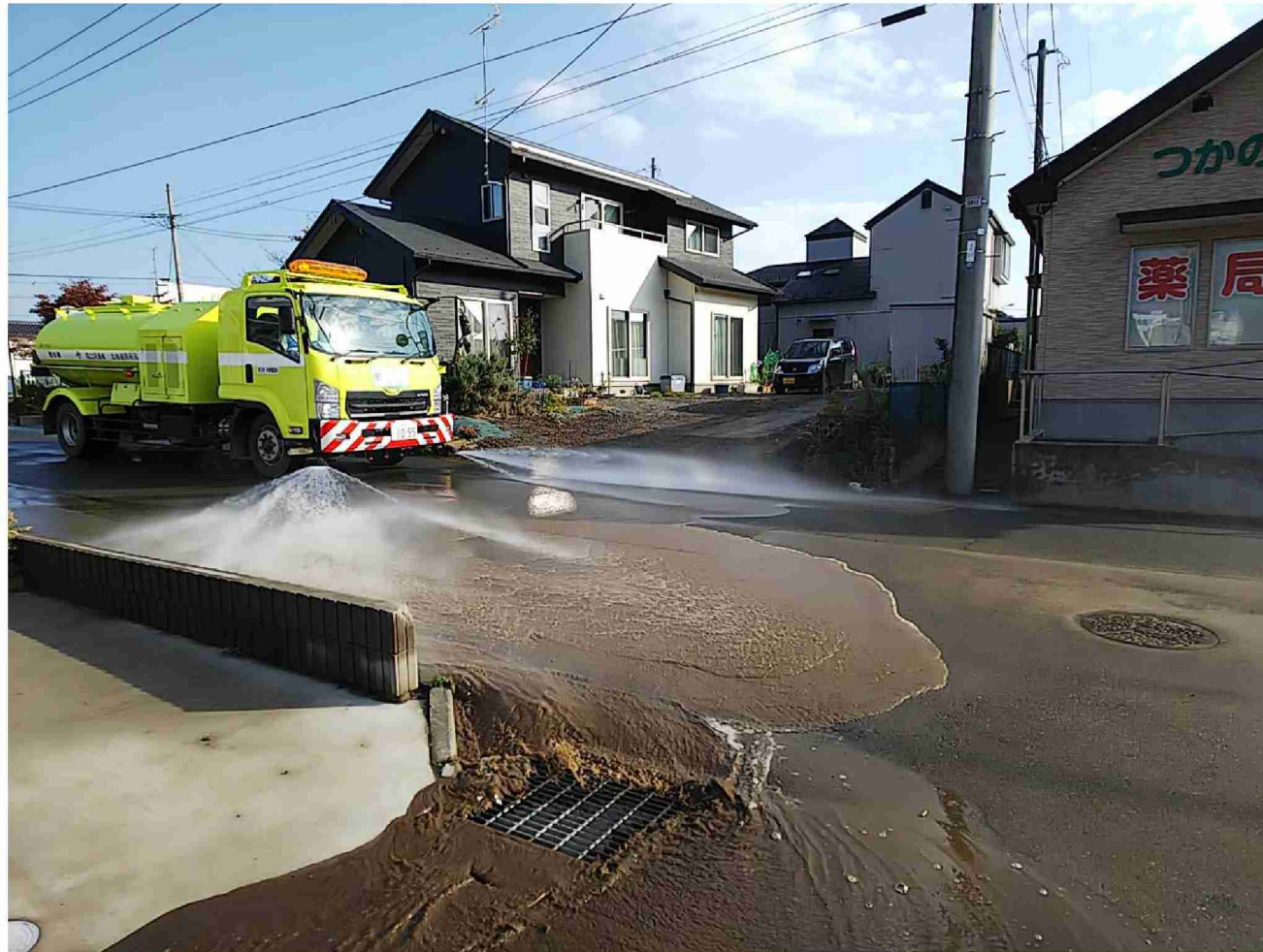
散水車による路面清掃作業 (福島県相馬市)