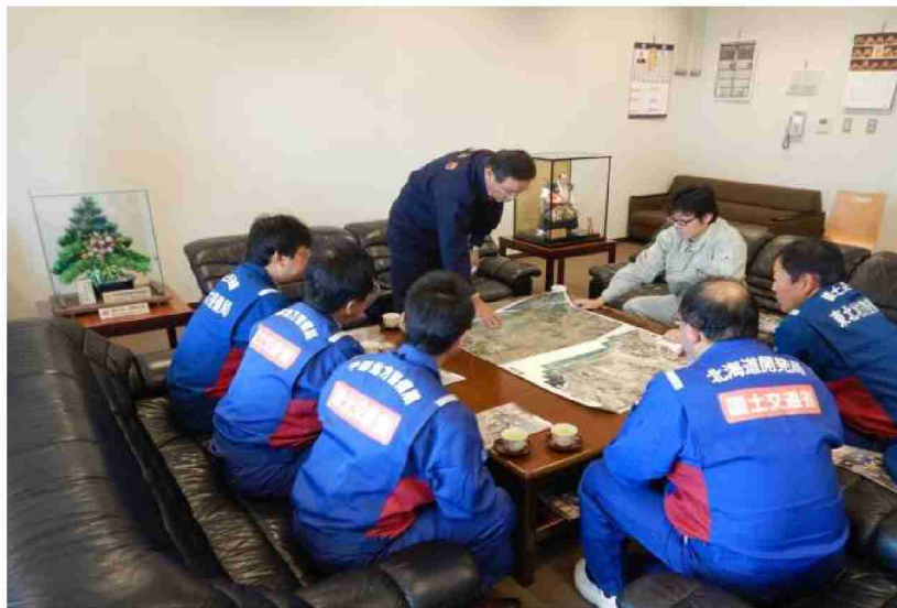
被災状況調査打合せ(相馬市副市長)