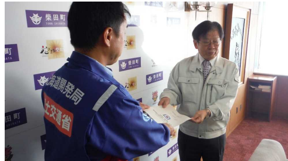
柴田町へ被害状況調査報告書提出 (宮城県柴田町)