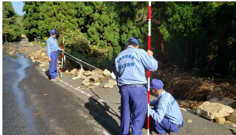
被災状況調査 (宮城県丸森町)