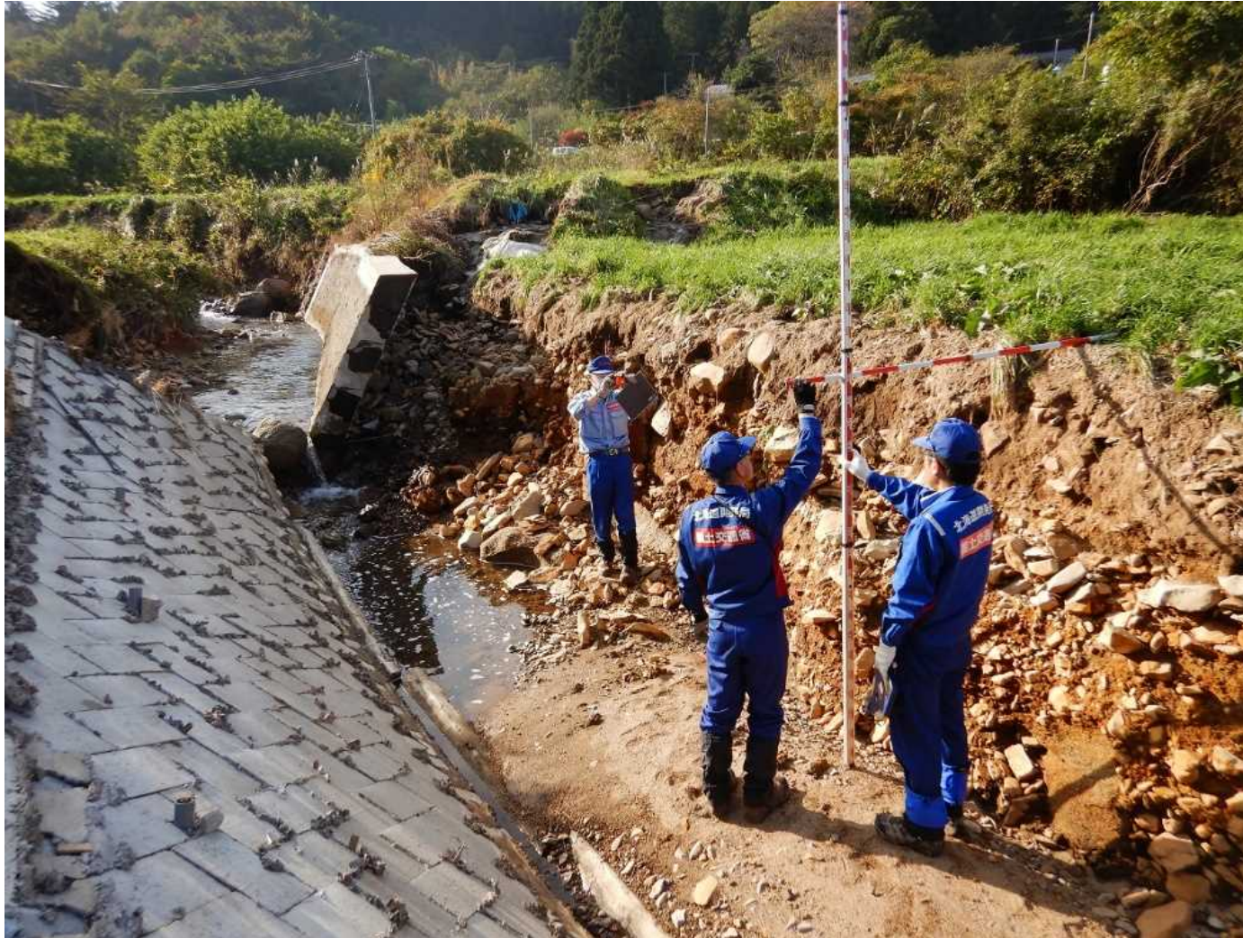
被災状況調査 (宮城県丸森町)