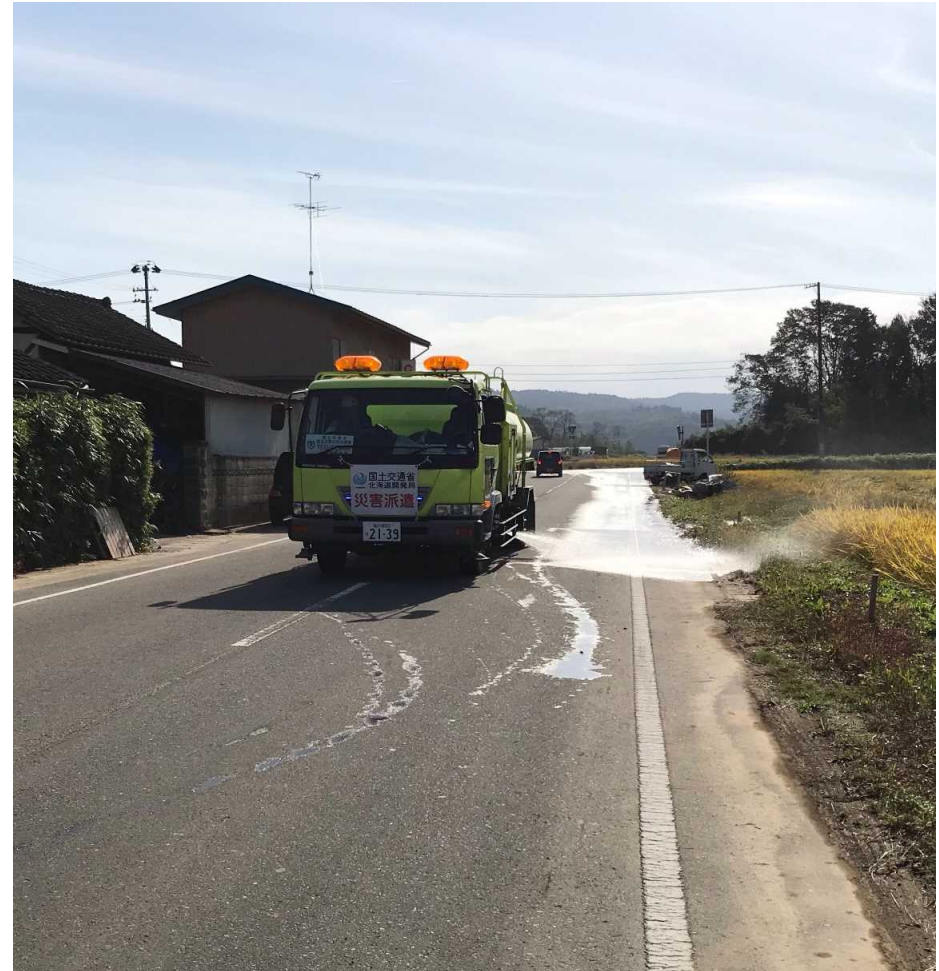
路面清掃車等による路面清掃 (福島県須賀川市)