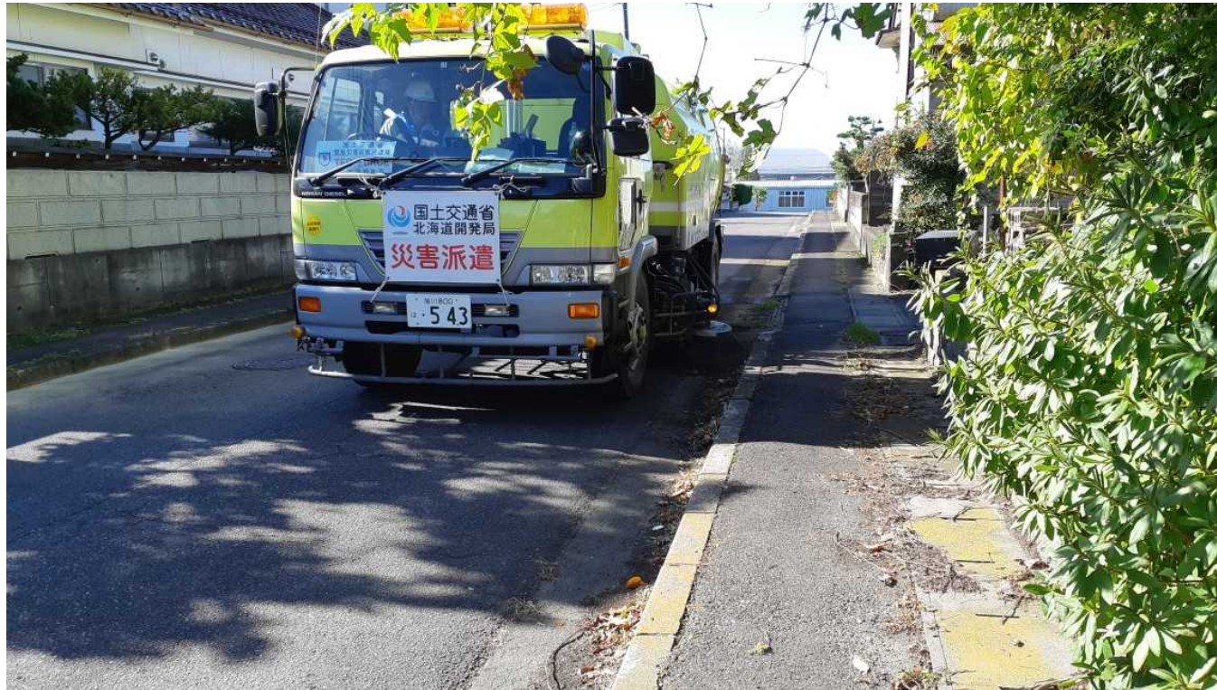
路面清掃車による路面清掃作業 (福島県須賀川市)