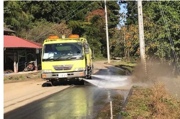
路面清掃車等による路面清掃作業 (宮城県丸森町)