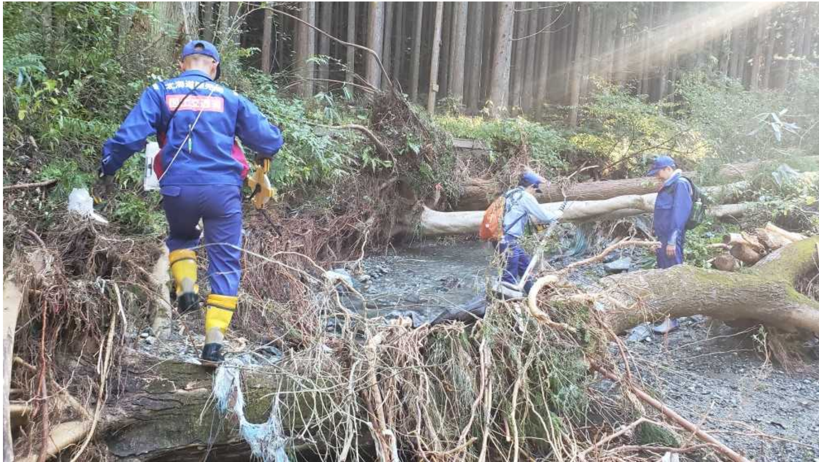
被災状況調査 (福島県相馬市)