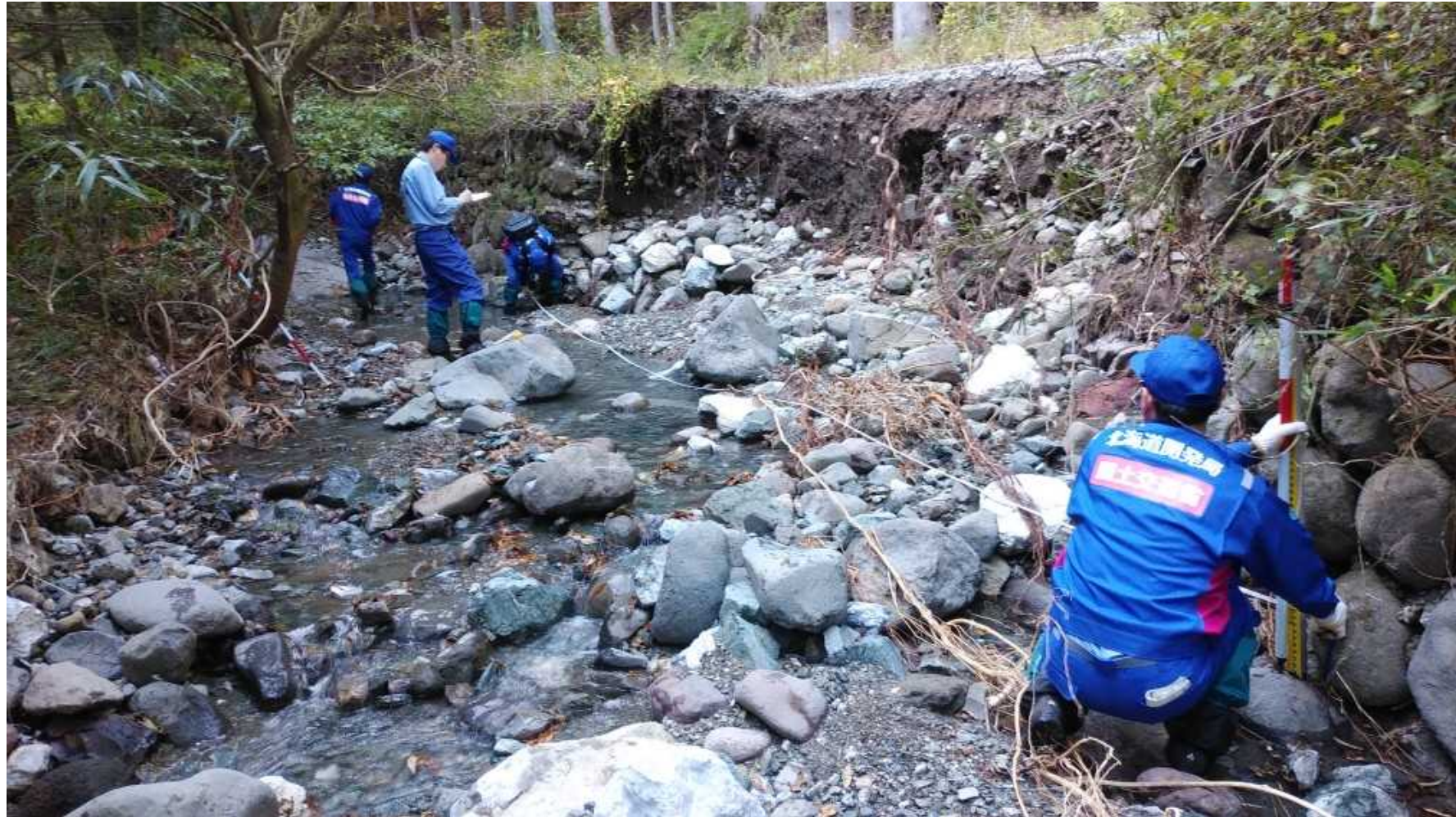
被災状況調査 (福島県相馬市)