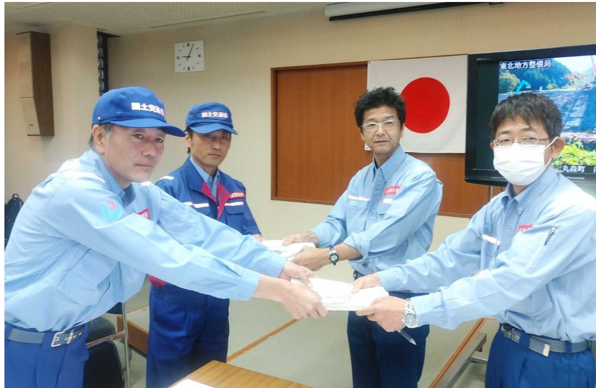
東北地方整備局へ被害状況調査報告書提出 (宮城県丸森町)