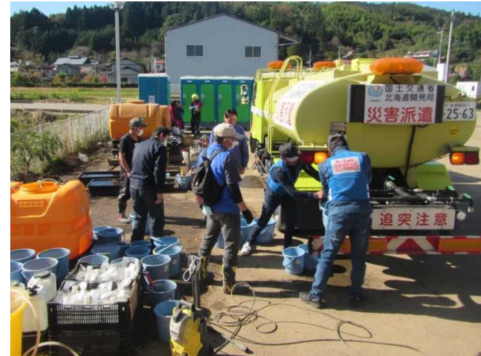
散水車(給水装置付)給水状況 (宮城県丸森町)