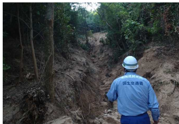
砂防現地調査の様子(呉市宇和木)