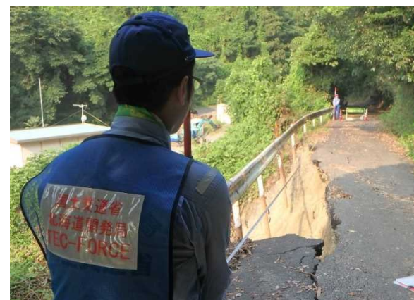
道路現地調査の様子(福山市)