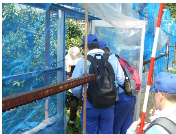
現地住民への道路状況の聞き取り状況