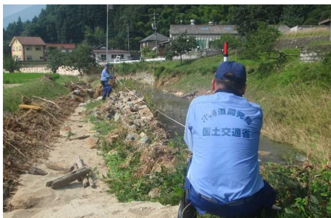
河川現地調査の様子(河津川)