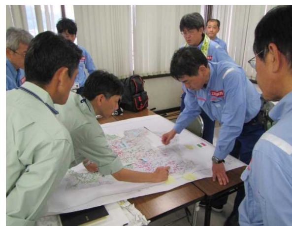
宇和島市との打合せの様子