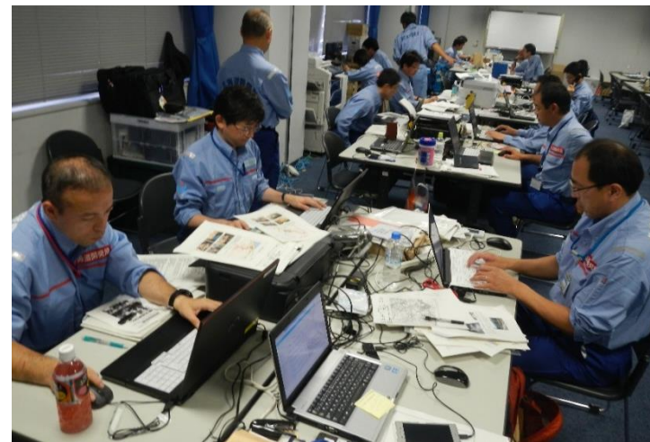
調査結果取りまとめ作業の様子②