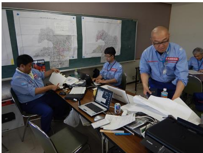
調査結果取りまとめ作業の様子①