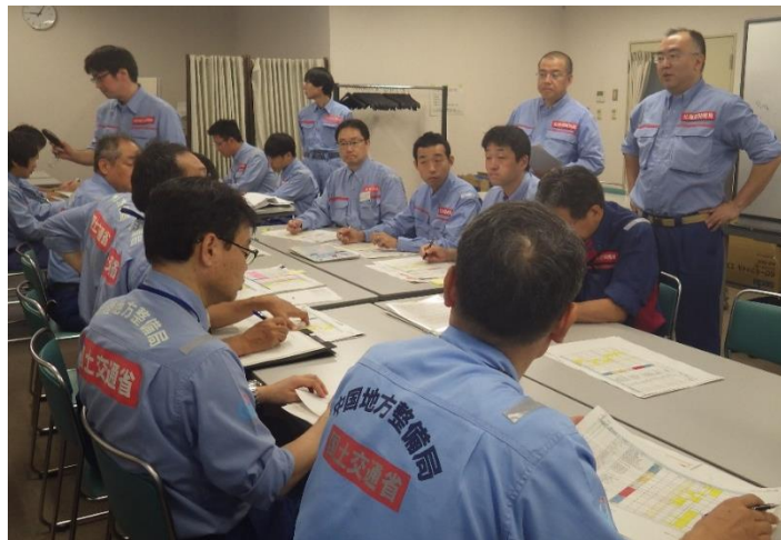
砂防班長会議の様子