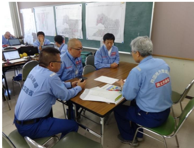
四国地方整備局との打合せの様子