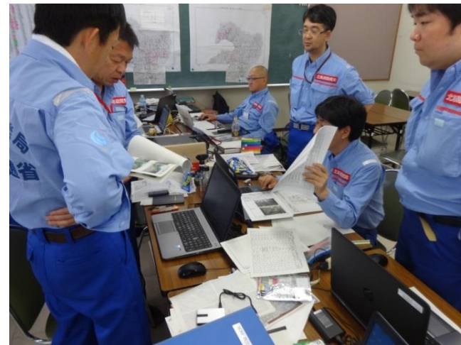
調査結果取りまとめ作業の様子②