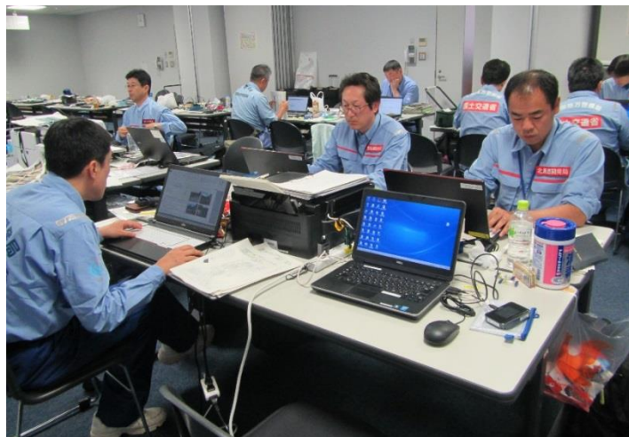
調査結果取りまとめ作業の様子①